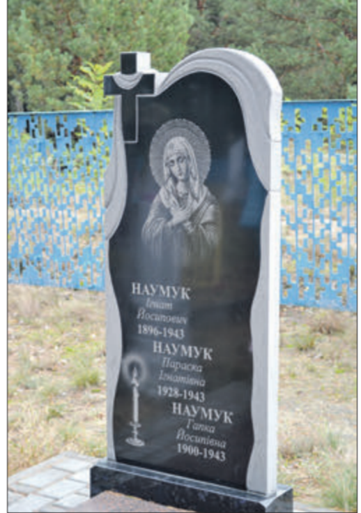
На кладовищі в Луцьці з'явився новий надгробок.