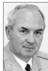
Олександр СКИПАЛЬСЬКИЙ, генерал-лейтенант, экс-заступник голови СБУ (м. Київ):

— Ці вбивства чітко демонструють, що ніхто не може почуватись впевненим і абсолютно захищеним. Прізвища не мають принципового значення. «Стосується всіх» – це головний висновок, який потрібно зробити владі. З одного боку, теракти мають демонстративний характер – показують слабкість до кінця не реформованих силових структур. З іншого, вони можуть бути підготовкою до замахів на посадовців найвищого рівня. Адже, як свідчить історія, вбити можна кого завгодно, було б лише бажання та ресурси. Президент міг би використати цю ситуацію, щоб, виправивши її, «на білому коні» в'їхати на другий термін. Але для цього потрібна політична воля, а її, на жаль, не бачу. Щодня чую новини, які свідчать, що у нас є можливість не тільки теракти організувати, а й цілі диверсійно-розвідувальні групи безперешкодно перевозити. Часом складається враження, що «гібридна» війна відбувається на мирній території.