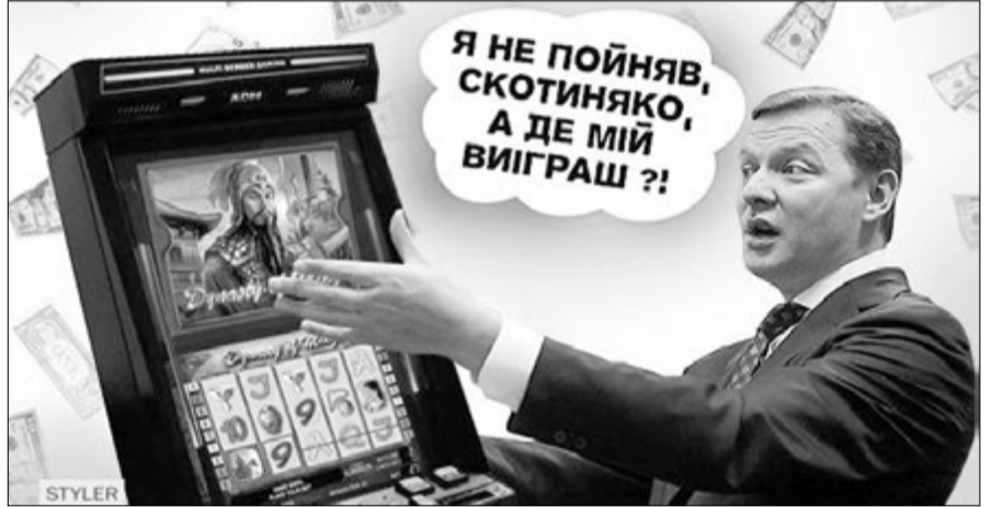
Після заяви про виграші Олега Ляшка в інтернеті присвятили багато фотожаб.

Можливо, б'ючи молотом автомати, політик намагався побороти свою від них