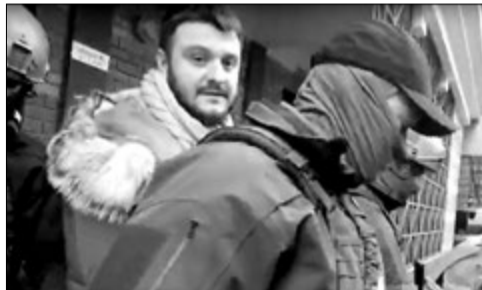
У те, що Аваков-молодший сидітиме за ґратами, мало хто вірить.