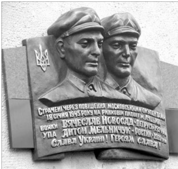
Меморіальна дошка страченим повстанцям.