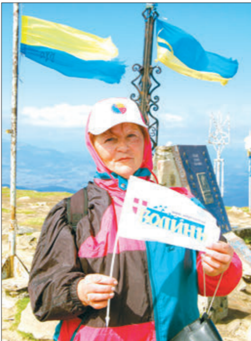
На найвищій вершині Українських Карпат.