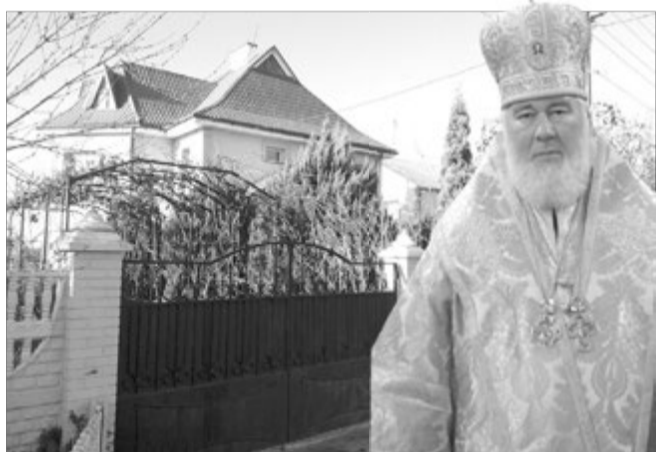
Крадії скористалися моментом, коли владика відбув у лікарню.

— Точно знали, коли лізти, — розповідає сусід митрополита. — У нас на вулиці таке вперше. У будинку завжди хтось є: там же й ікони, і одяг його. Але нічого з цього не взяли. Мабуть, тому що велике. Варфоломій — дуже хороша людина. Зараз