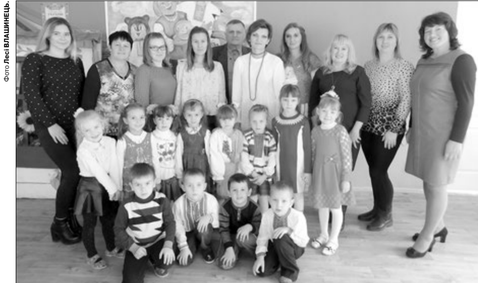
Учасники методичного об'єднання у селі Веселому з вихованцями дитсадка.

« Під час методичного об'єднання народилася ідея запрошувати на музичні заняття у ДНЗ місцевих поетів, художників, майстрів і майстринь. Адже великий цвіт любові до прекрасного неодмінно з'явиться, якщо буде посіяне добре зерно. »