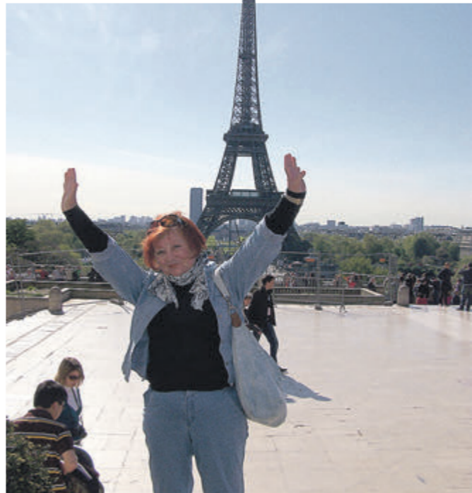
І фото на фоні символу Парижа – Ейфелевої вежі.