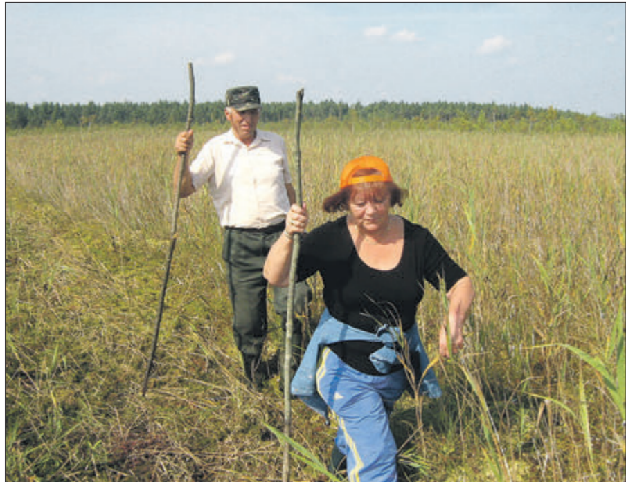
1200 метрів – по траєкторії.

Розумію, звідки це. Як ж — дитина повноного часу, яка пам'ятає хутори доволі рідного села Переспа, що в Рожицькому районі. Зокрема, і той, де жив мій дідусь по маминій лінії від якого в кінці 1950-х нічого не залишилося. Така тоді була установка, що хутори стягали у село.