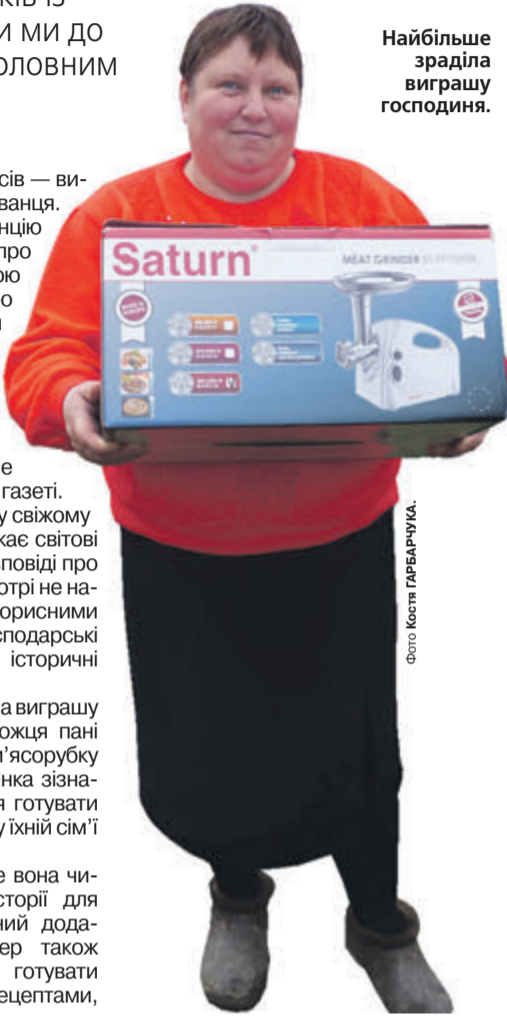
Найбільше зраділа виграшу господиня.

«Нічого в житті не приходило просто так, все доводиться заробляти власною працею. Лише один раз — ще за радянських часів — виграв у лотерею карбованця.»