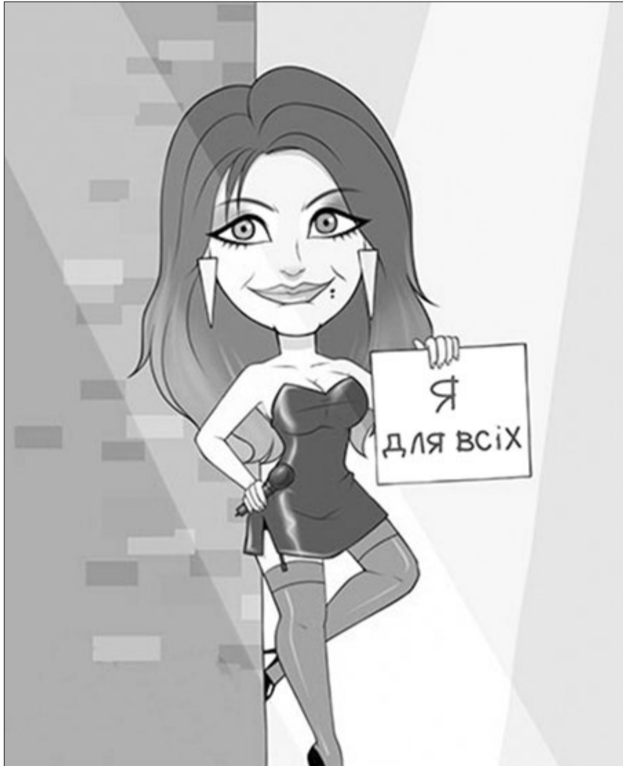
Ані Лорак: співала Путіну, і Порошенку заспівала, якщо заплатять?

— Не люблю говорити про шоу-бізнес, він для мене чужий і нечесний. Але загалом артист виступає там, де його приймають, це його повітря. Інше питання, якого він професійного рівня і що робить на сцені.