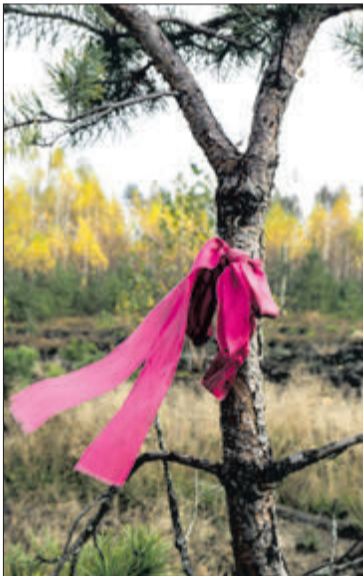
Дорогу до Хрестів підкажуть стрічки на деревах.