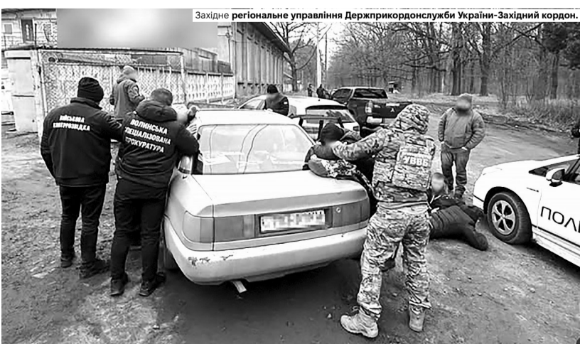
Один із організаторів каналу переправлення намагався утекти, але його зупинили.

За 12 тис доларів хотіли переправити чоловіка до білорусі