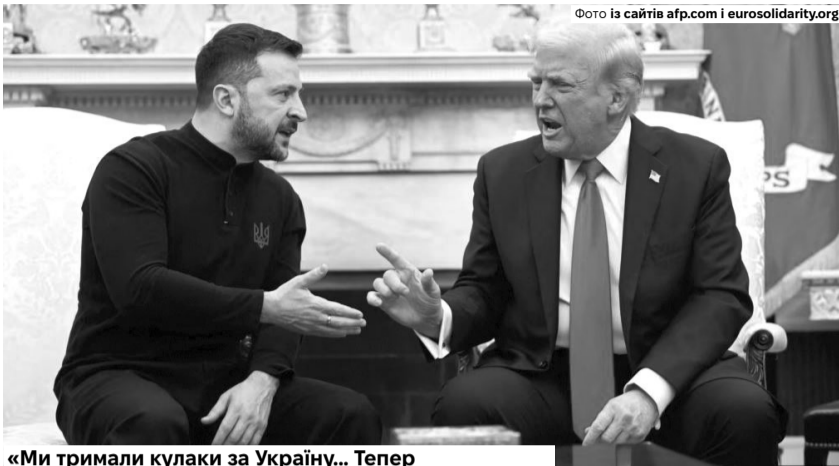
«Ми тримали кулаки за Україну... Тепер сподіваємося, що у Президента має бути план Б».

«Що нам робити? Вдень і вночі забезпечувати армію»