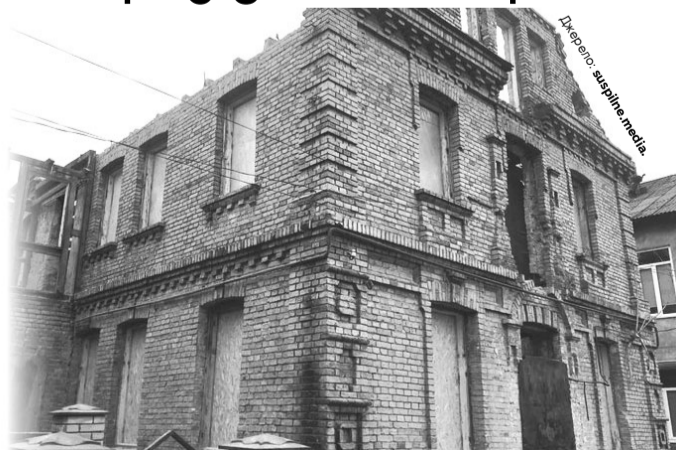
Такий вигляд має зараз пам'ятка архітектури місцевого значення у Луцьку на вулиці Галшки Гулевичівни, 12а.