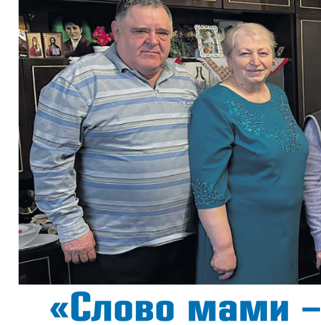
У світлиці вільхівчанки у день її 85-річчя було тепло від почуттів найрідніших людей.