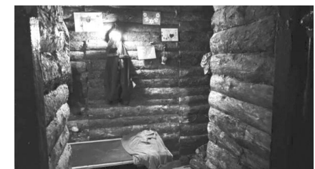
У середмісті Нововолинська можна спуститися у справжній солдатський бліндаж.