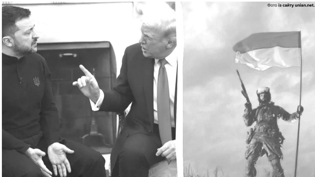
Після цієї сварки в Овальному кабінеті Білого дому в Москві багато людей напилися від щастя... Але світ ще раз почув, що Україна не збирається капітулювати.

І чи хотіла б країна, щоб він так зробив?