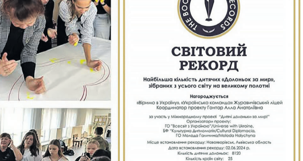
На фотокоріжі – учасники міжнародного проекту «Дітячі долоньки – за мир» – вихованці Книгачинського лінгвістичного ліцею.