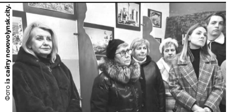
Перші відвідувачі укриття.

Незабаром тут будуть проводити екскурсії. ■