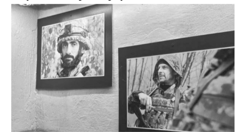
На стінах – світлина наших захисників.