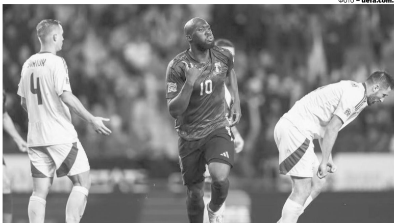
31-річний Ромелу Лукаку ще буде довго приходити в страшних кошмарах українським футболістам і уболівальникам.

Атака зрештою побила захист. Побила насамперед тому, що наш