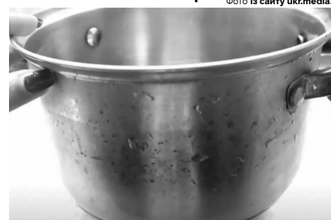
Кілька хвилин – і нагару та кіптяви як не було.