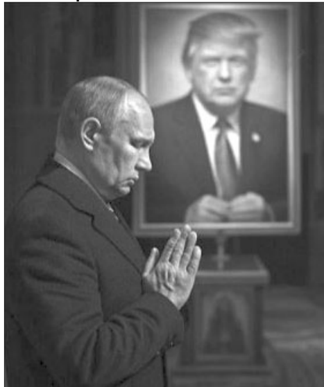
Слова Стіва Віткоффа про молитви путіна і його картину-подарунок Трампу швидко перетворились на в'їдливі фотожаби в інтернет-мережі.