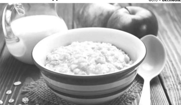
Крупа, зварена на воді, зберігає на 30% більше корисних властивостей, ніж при варінні на молоці.