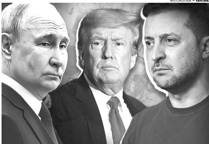
За даними Reuters, Білий дім розглядає можливість «підштовхнути Україну до згоди на президентські вибори як частину первісного перемир'я з росією».