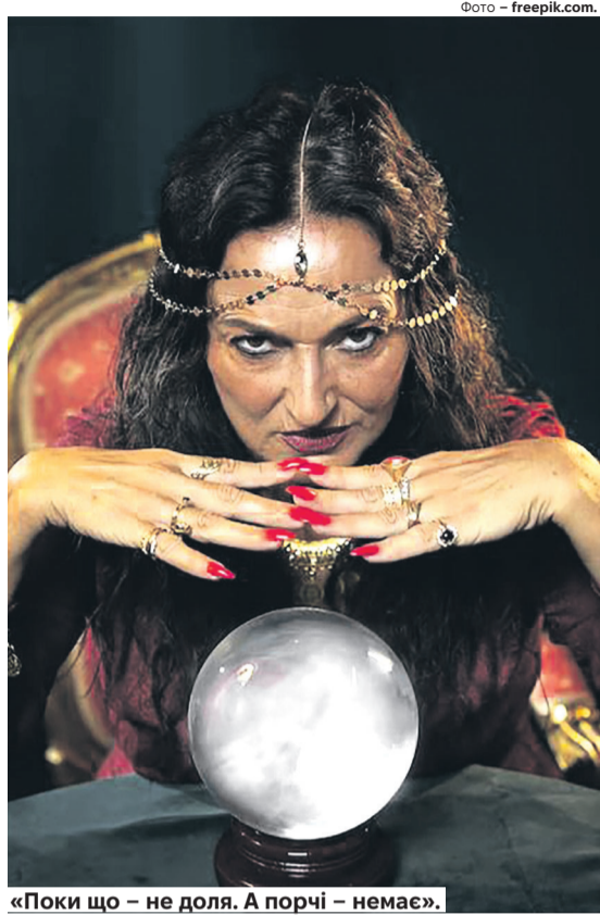
«Поки що – не доля. А порчі – немає».

Риті дуже не щастило з кавалерами. Зустрічалася вона з чоловіками, зустрічалася, але ніхто з представників протилежної статі, чомусь, не хотів бачити дівчину поруч із собою як дружину