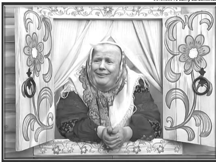
Фотожаба і з сайту durdom.in.ua.

56% американців, включно з 89% – демократів і 27% – республіканців, вважають, що Трамп занадто близький із Москвою. Тому й перетворюють на фотожабах главу Білого дому на Генсека КПРС Леоніда Брежнєва.