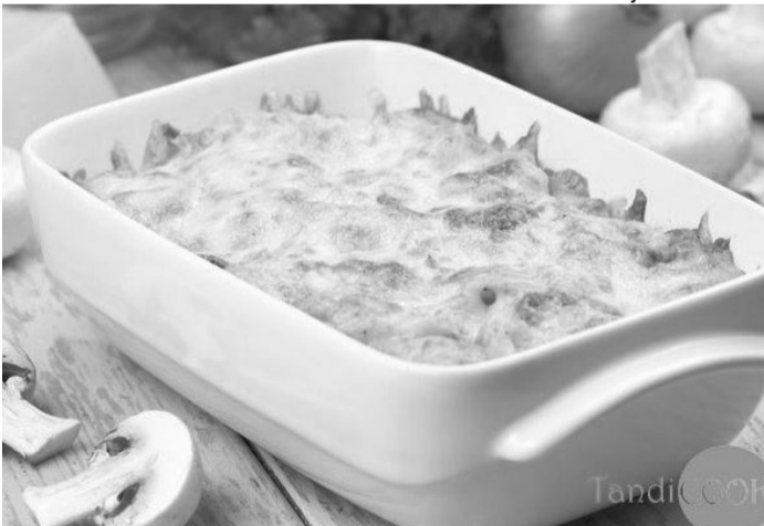
Картопля просто ідеально поєднується з грибною начинкою, а легкий присмак оливкової олії і часничку надають страві особливої пікантності й аромату.