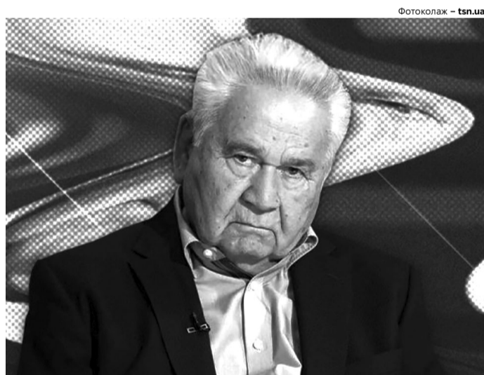
Політичний шлях Вітольда Фокіна супроводжували як реформи, так і скандали.

Фокін критикував декомунізацію, політику президентів Віктора Ющенка і Петра Порошенка, хоча й засуджував російську анексію Криму. «Коли ми втратили Крим, я мав сильний серцевий напад. Плакав. І мені не соромно про це каза-