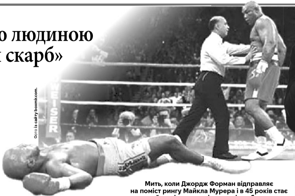
Мить, коли Джордж Форман відправляє на поміст рингу Майкла Мурера і в 45 років стає найстарішим чемпіоном світу з боксу.

Проте через 10 років – у 1987-му – знову повернувся на ринг. Джордж зумів встановити рекорд суперважкої ваги, ставши найстарішим чемпіоном хевівейту у віці 45 років, перемігши Майкла Мурера.