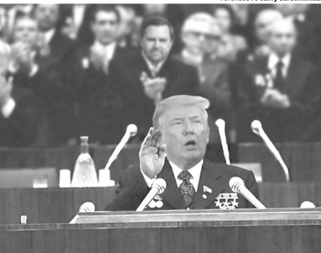
Фотожаба і з сайту durdom.in.ua.