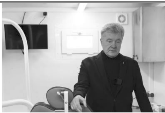
«У наших «вовків» мають бути міцні зуби, щоб рвати окупантів», – наголошує Петро Порошенко.

«Тож тепер наші військові зможуть отримати якісну медичну допомогу навіть там, де немає кабінету і лікарні. Там, де раніше військовим треба було або змиритися з болем, або їхати десятки й сотні кі-