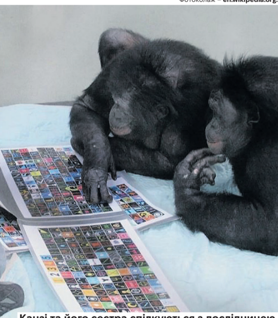
Канзі та його сестра спілкуються з дослідницею.

А також розводити багаття, готувати їжу на вогнищі та навіть грати у відеоігри