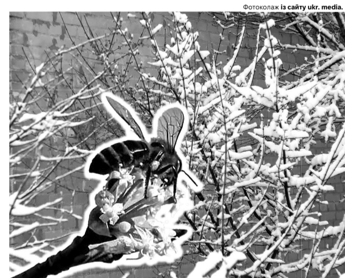
ще вчора бджоли в пошуках нектару і пилку запылювали кизилове дерево, а сьогодні «в саду раптом сніг, раптом сніг, ранній сніг на зеленому листі».

тяжкі, отримають ще більші терміни ув'язнення. Але це – не перше повідомлення про таку діяльність у Маневицькій колонії (добре, що не йшлося про наркотичні речовини). Питання залишається відкритим: як телефони потрапляють у виправну установу? ■