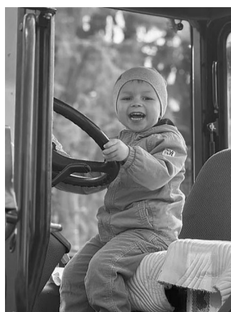
Малеча неймовірно тишилася можливістю посидіти за кермом.

А для 32 сімей, які мешкають у гуртожитку на вулиці Луцькій, 24, цей рік запам'ятовується приємністю: після десятиліть очікування вони стали повноцінними влас-