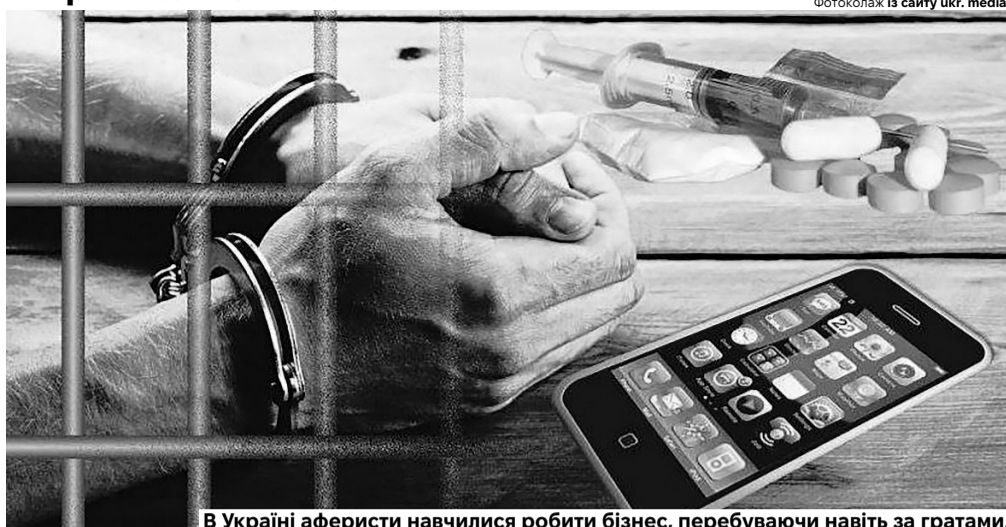
В Україні аферисти навчилися робити бізнес, перебуваючи навіть за ґратами.