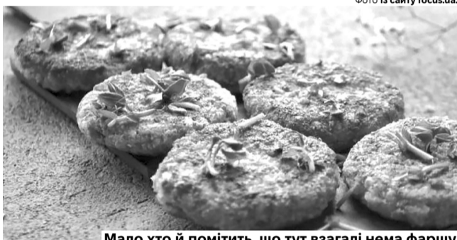
Мало хто й помітить, що тут взагалі нема фаршу.