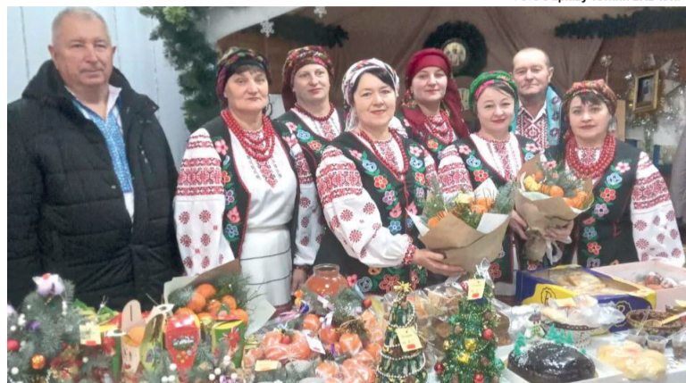
Фольклорний гурт «Журавлянка» закладу культури села Журавичі – на благодійному Різдвяному ярмарку.

Волонтерська діяльність охоплює і культурну складову. Усі концерти в громаді проводяться з благодійною метою: вхід – за