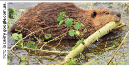
Ось він, бобер – строгий вегетаріанець.

Свого часу, за інформацією спеціалістів парку, бобрів відносили до рідкісних представників фауни через катастрофічне зменшення їх чисельності у результаті неконтрольованого відстрілу, зміни