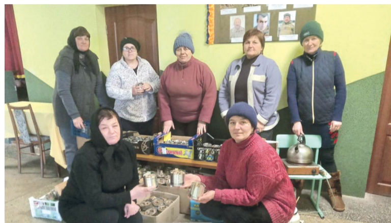
А окопні свічки зіграють земляків на передовій.