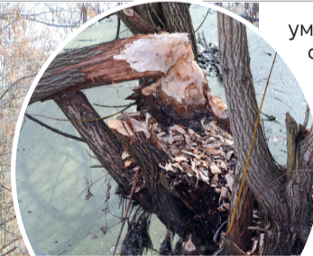
Найперша ознака, що в цій місцевості водяться бобри.

умов існування. А ось в останні роки найбільший гризун із числа фауни України суттєво розширив свій ареал, чисельність його у Східній Європі зростає. Збільшилася популяція «найкращих будівельників» і на території Національного природного парку «Прип'ять – Стохід»... На Поліссі бобри будують хатки. Задля запобігання проникнення хижаків у житло, вони штучно підвищують рівень води, споруджуючи