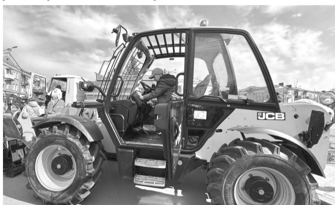
Автопарк комунальних підприємств протягом останніх років суттєво оновився.

Також було відзначено подяками голів ОСББ та пра-