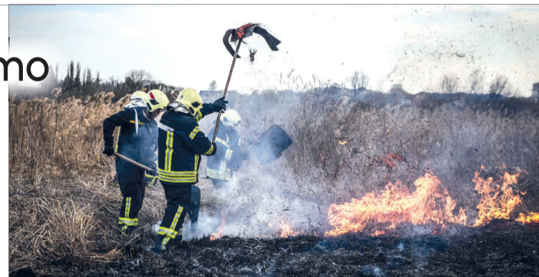
Пожежу на території заказника гасили 3 години.

Рятувальники б'ють на сполох через масові підпали сухою. Вогнеборці майже безперервно виїжджають на виклики, залучаючи до гасіння добровольців та використовуючи дрони для моніторингу. Проте, попри всі зусилля, ситуація залишається напруженою.