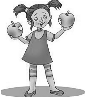
«Матусю! Візьми це яблуко! Воно – солодке!».

Але, на її подив, дівчинка простягнула неньці одне яблуко зі словами: