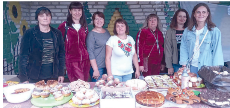
Торти, пряники та цукерки із Журавич регулярно вирушають до бійців на фронт.

донат на ЗСУ. Зокрема, з проектом «Запрягайте, хлопці, коней» митці віддали багато сіл Ківерцівської громади, а також побували у Тернополі, де підтримали поранених захисників-земляків.