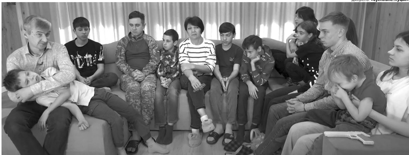
Подружжя Моїсеєнків – приклад батьківської любові, де кожна дитина відчуває себе потрібною.