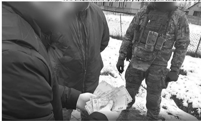
Правоохоронця викрили під час одержання 36 тисяч гривень за допомогу у перевезенні й реалізації незаконно зрубаної деревини.

«Спільники перевозили цінну деревину різних порід на підпільні пилорами, обробляли, а потім продавали.»