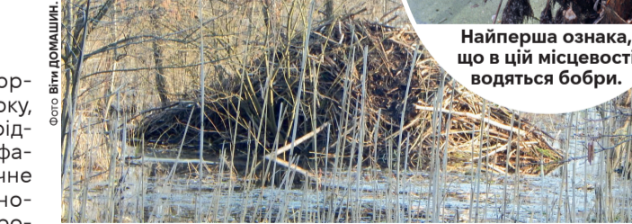
А вхід у хатинку, тобто в нору, зазвичай знаходиться під водою, щоб хижаки не добралися.