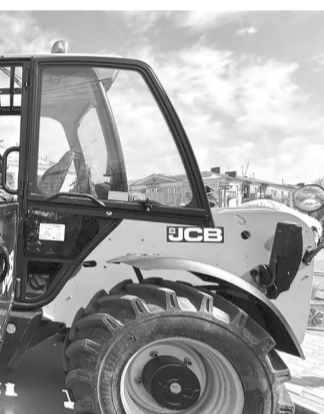
Автопарк комунальних підприємств протягом останніх років суттєво оновився.

На майдані Незалежності проводили збір коштів на підтримку українських військових – вдалося зібрати майже 29 тисяч гривень.