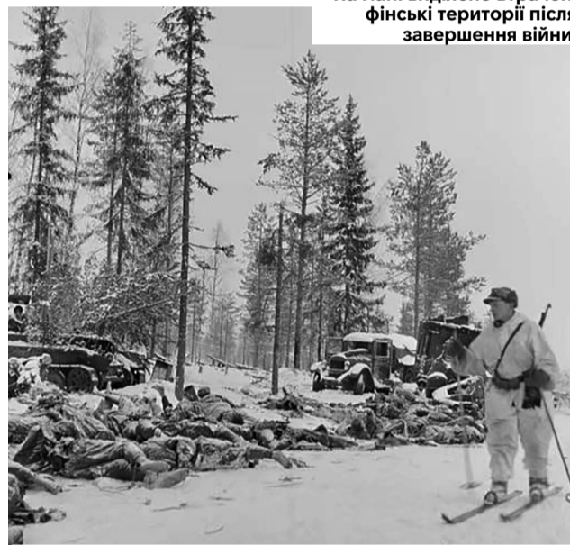
Тіла радянських військових лежать в снігу після атаки фінів.

Пізніше Сталін назвав оточених дармоїдами, які тільки просили харчів, а воювати не хотіли. Наприкінці лютого фіни остаточно розгромили залишки