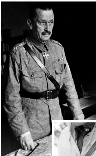
Карл Густав Маннергейм (1867–1951) – державний і військовий діяч Фінляндії.

За допомогою різного роду обіцянок і погроз, Сталін примусив Естонію, Латвію та Литву підписати нерівноправні договори про взаємодопомогу та розташування їх території військові бази. Після цього, 12 жовтня 1939-