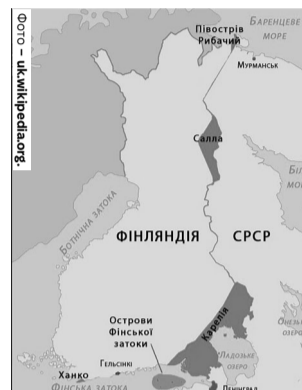
На мапі виділено втрачені фінські території після завершення війни.

сил, щоб закрити прорив. Ще 10 днів тривала оборона проміжної позиції. Радянське командування посилює натиск і вже на початку березня розпочало штурм тилівих позицій під Виборгом (Віпури), звідки відкривався шлях на Гельсінкі. Водночас декілька радянських дивізій наступали з флангу по льоду Виборгської затоки. Щоб їх зупинити, фінське командування змушене було використати всі свої резерви. Фіни розуміли, що їм більше відступати не можна, а Сталін хотів за будь-яку ціну перемогти до весняної відлиги, яка ускладнила б подальший наступ.