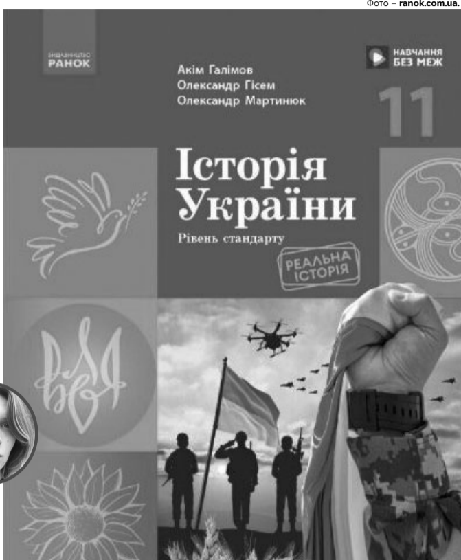
Держава лише в грудні замовила «Ранку» виготовлення цього підручника по ціні 135 гривень за одиницю і вже заплатила 11 мільйонів гривень за 83-тисячний тираж. А сьогодні «Історію України для 11 класу» той же «Ранок» продає по 600 гривень.