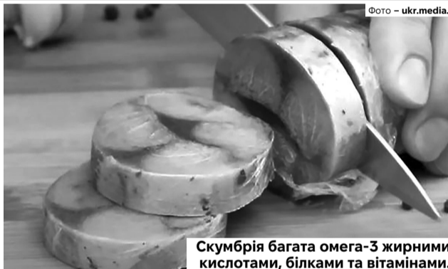
Скумбрія багата омега-3 жирними кислотами, білками та вітамінами.

Натріть підготовлене філе сіллю з обох боків. Внутрішню частину першого філе присипте перцем і