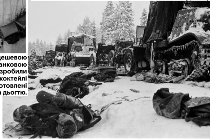
Тіла радянських військових після розгромного нападу на колону Червоної армії на Раатській дорозі в січні 1940 року.

розпочнеться війна. Населення Фінляндії у той час налічувало 3,7 мільйона чоловік. А населення Радянського Союзу перевищувало 180 мільйонів. Щоб виправдати агресію, 26 листопада 1939-го спеціальний підрозділ НКВС здійснив артилерійський обстріл радянської військової частини на кордоні біля села Майніла. Після цього СРСР розірвав спочатку договір про ненапад із Фінляндією, який мав діяти до 1945 року, а потім – і дипломатичні відносини.