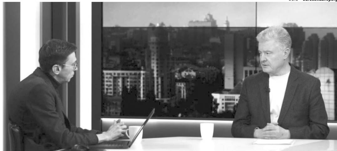
Петро Порошенко зізнався, що за увесь час перебування в політиці його вперше запросили в ефір телеканалу «Київ».