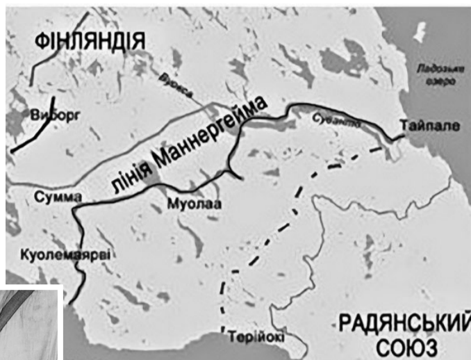
На головній смузі оборони «Лінії Маннергейма» протяжністю 140 км було збудовано 210 довготривалих вогневих споруд (дотів) і 546 – дерев'яно-земляних вогневих точок (дзотів).

Більш потужними були берегова та польова артилерія, успадковані ще від царської Росії. Але запасу снарядів мали лише на три тижні бойових дій. Найслабшою була протитанкова оборона. Тільки в останній момент війська отримали близько сотні 37 мм протитанкових гармат. З них половину закупили у Швеції, а решта були власного виробництва. Тому фінські солдати змушені були використовувати для боротьби з танками зв'язки гранат і пляшки із запалювальною сумішшю («коктейль Молотова»). Цю жартівливу назву суміші бензину і дьогтю фіни дали після того, як голова комуністичного уряду В'ячеслав Молотов заявив по радіо, що радянські літаки скидають на фінські міста продукти. Своїх легких танків фіни мали лише пів сотні. У військах майже не було засобів зв'язку. До останнього моменту ніхто не вірив, що