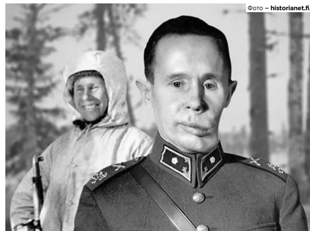
Легендарний фінський снайпер на прізвище «Біла смерть» Сімо Гяюґа (Simo Häyhä, Сімо Хайха), який вважається найрезультативнішим снайпером усіх часів: кількість вбитих ним солдатів Червоної армії становить 542 особи (згідно з іншими підрахунками – близько 200).

Бої в Північній Карелії показали, що в умовах повного бездоріжжя наступати великими силами – неможливо. Червона армія змушена була готуватися до нового штурму лінії Маннергейма. Активність радянської артилерії та авіації постійно зростала. Тисячі тонн бомб падали на фінські міста, залізничні станції і позиції військ. Рух