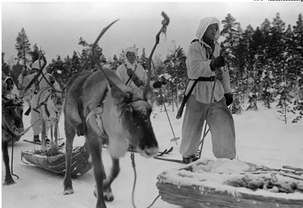
Фіни широко використовували оленів, це дозволяло бійцям майже нечутно перевозити кулемети та міномети лісами.

Радянське керівництво не сумнівалося у швидкій та легкій перемозі. На початку грудня земля вже замерзла, але морози і сніговий покрив були ще невеликі, що сприяло наступальним діям. Проте бліцкриг все одно не вдался. Несподівано для всіх виявилось, що грізна і прекрасна оснащена Червона армія має досить низький рівень підготовки та організації. Натрапивши на міни та лісові завали, її колони скупчувалися у заторах і потрапляли під нищівний вогонь фінської артилерії. Через слабку взаємодію різних родів військ, піхота часто піднімалася в атаку вже після закінчення артилерійської підготовки і без підтримки танків та – навпаки. Наслідком були важ-