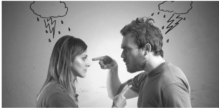
На думку вчених, ті, хто часто зазнають словесного насильства, крім хронічного стресу, схильні до фізичних захворювань, включаючи підвищений ризик розвитку раку, хвороб серця та астми.

Унікальний спосіб лісозаготівлі практикують деякі мешканці Соломонових островів. Якщо дерево завелике, щоб зрубати сокирою, місцеві селяни валять його власним криком. На світанку лісоруби, які є особливо сильними, залазять на верхівку дерева, інші – стають навколо і разом кричать на все горло. Це триває 30 днів. Дерево гине і падає. Кажуть, що галас убиває дух дерева. Селяни переконують, що крик завжди спрацьовує