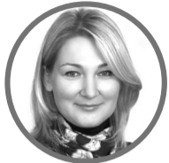
Марія ІОНОВА , народний депутат України, фракція «Європейська Солідарність»