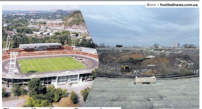
Після російської окупації за стадіоном у Донецьку ніхто не доглядає.

ЯКИЙ РАХУНОК? Українська Прем'єр-ліга. Результати матчів 23 туру: «Інгугульць» – «Оболонь» – 0:1, «Ворскла» – «Зоря» – 1:2, «Чорноморець» – «ЛНЗ Черкаси» – 1:0, «Олександрія» – «Кривбас» – 1:0, «Динамо» – «Лівий берег» – 2:0, «Шахтар» – «Верес» – 3:0, «Колос» – «Рух Львів» – 0:1, «Полісся» – «Карпати» – 1:1.