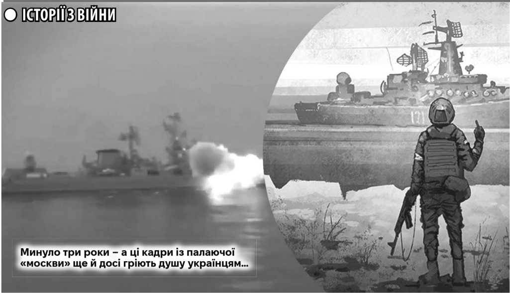
Минуло три роки – а ці кадри із палаючої «москви» ще й досі гриють душу українцям...