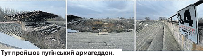
Тут пройшов путінський армагеддон.

Футбольна арена «Шахтаря» у Донецьку, який зараз знаходиться під тимчасовою окупацією, зазнає подальшого руйнування. В Інтернеті з'явилися зображення, що демонструють теперішній стан стадіону, де раніше відбувалося багато матчів