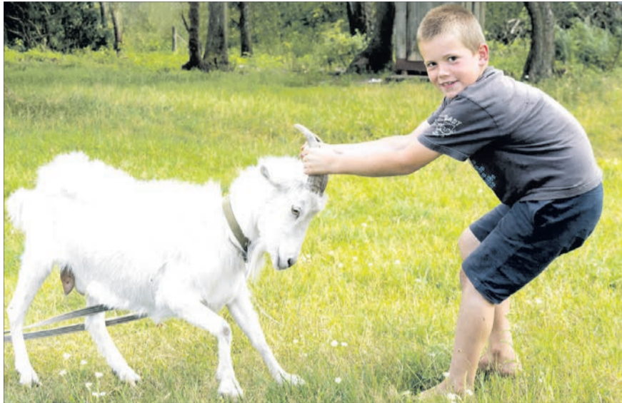
А як би ви підписали це фото? Автор найоригінальнішого отримає приз. Чекаємо ваших листів на адресу: volyn.nova@gmail.com або 43025, просп. Волі, 13, м. Луцьк, Волинська область.