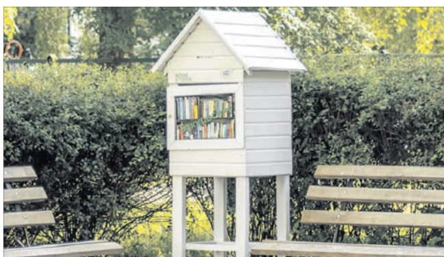
Ідея букросингу полягає в обміні!

Виявилось, це громадське місце обміну друкованою літературою, що називається букросингом. У середині — полиці з книгами. Принцип простий — бери, яка сподобалася, однак замість неї обов'язково залиш свою. Бажано цікаву та в хорошому стані. Це в