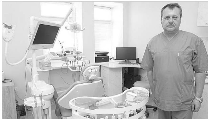
В оснащеному сучасним обладнанням стоматкабінеті приємно працювати.

«Усі роботи ПАТ «Луцьксантехмонтаж № 536» виконав високоякісно і з використанням сучасних будівельних матеріалів, енергоощадних технологій.»