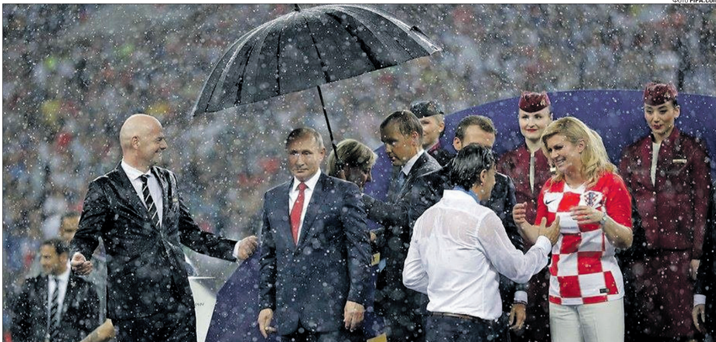
Про гендерну рівність у Кремлі не чули?