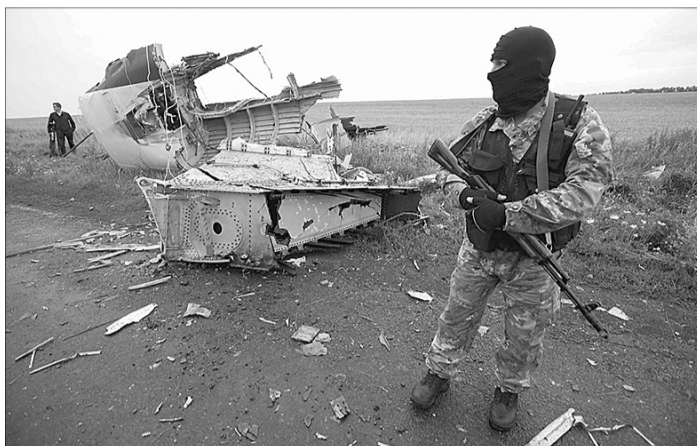
Бойовики до збитого літака спочатку нікого не пускали...

У зв'язку з тим, що проросійські бойовики ще у травні 2014 року знищили два військові вертольоти, а в червні — літак ІЛ-76, було прийнято обмеження на польоти цивільної авіації над зоною конфлікту до висоти 7900 метрів. Після збиття транспортного літака АН-26 підняли планку до 9750 метрів. Згідно з міжнародними нормами немає прямої вказівки закривати небо для польотів над зонами воєнних дій.