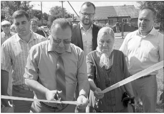
Бабці Наді й не снилося, що відкриватиме «больницю» разом з в. о. луцького мера.