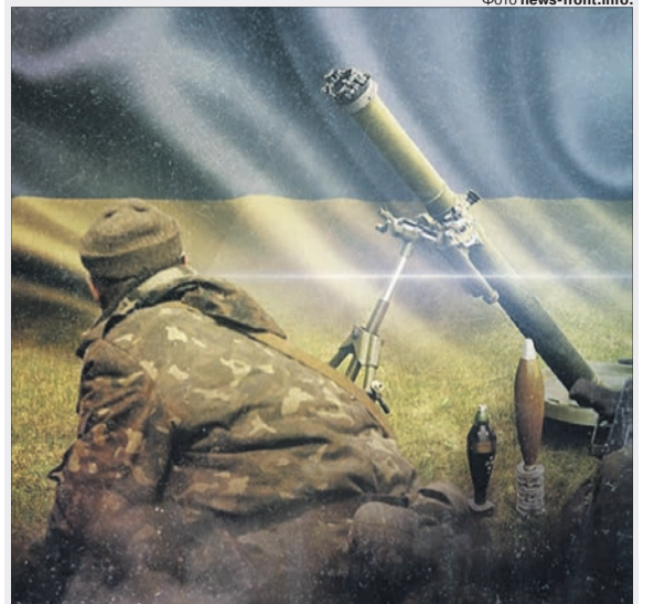
Вартість одного екземпляра «Молота» — 18 тисяч доларів.