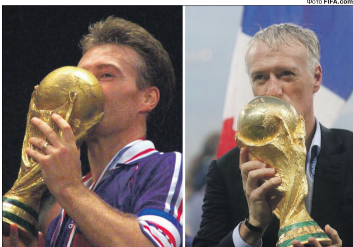
«Цілуй, цілуй, цілуй його...»: Дідьє Дешам має прекрасну традицію — раз на 20 років прикладається вустами до найзаповітнішого трофею у світовому футболі.

« Найкращим гравцем Мундіалю-2018 визнали капітана збірної Хорватії Луку Модрича, кращим молодим гравцем турніру прогнозовано став уже розхвалений з усіх боків француз Кіліан Мбаппе, а кращим бомбардиром — маючи в активі 6 забитих м'ячів — англієць Гаррі Кейн. »