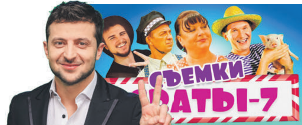
Невже для Вови головне – бабки?!