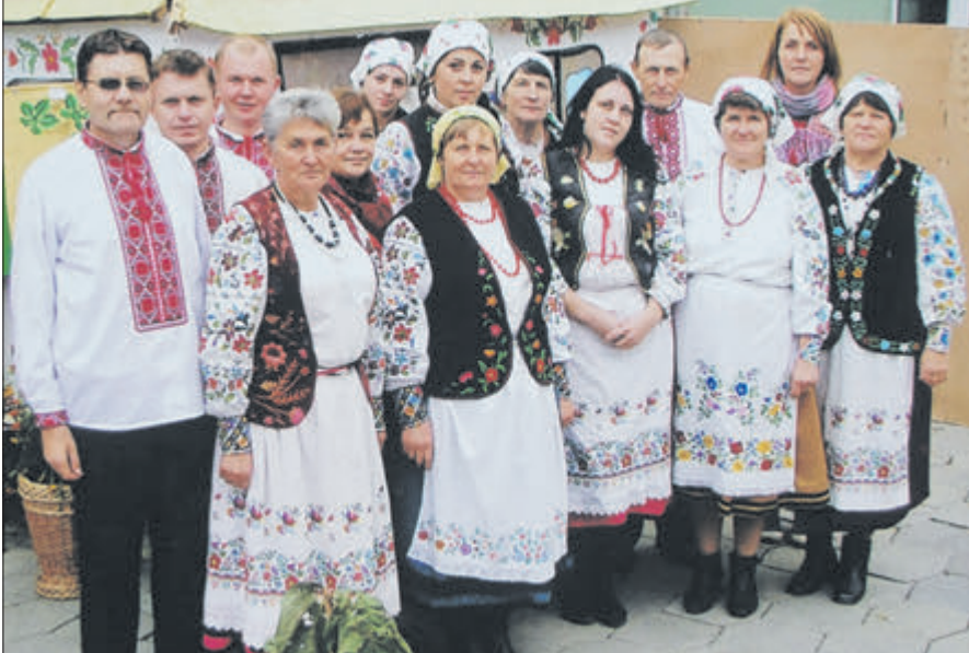
Народний гурт «Заболотчанка» співає так, що серцю в грудях тісно.