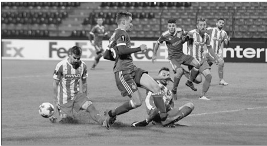
Албанці не тільки кістками лягали біля своїх воріт, а й «знімали скальпи» біля наших.

За другу перепустку від групи «J» 7 грудня у Львові в очному поєдинку помагаються «Зоря» й «Атлетік». Козакам Юрія Вернидуба потрібна лише перемога. Завдання — не з легких. Надишає хіба те, що у Більбао «Зоря» сенсаційно здолала басків — 1:0.