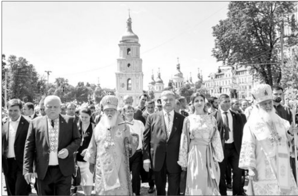
Патріарх Філарет та Президент України Петро Порошенко були в суботу у центрі багатотисячної колони.