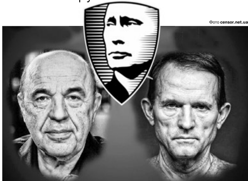
Вадим Рабінович: «Ми пропонуємо створити в Україні Швейцарію Східної Європи — незалежну, нейтральну, позаблокову державу».

Тому можна не сумніватися: зараз з усіх «говнозящиків» на нас посиплеться злива ма-