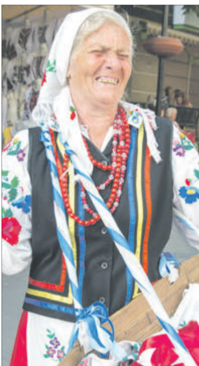
Де ще почуєш такі голоси і побачиш диво-барви та оздобу народного вбрання?

А гурти з Білорусі, Польщі, Словаччини, Словенії та Франції засвідчили: творчість є універсальною мовою. Особливо якщо вона йде від серця з глибини сторіч! ■