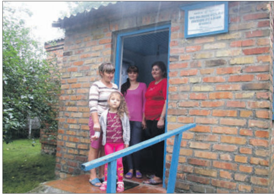
У фельдшерсько-акушерському пункті зібралися і дорослі, і малі.