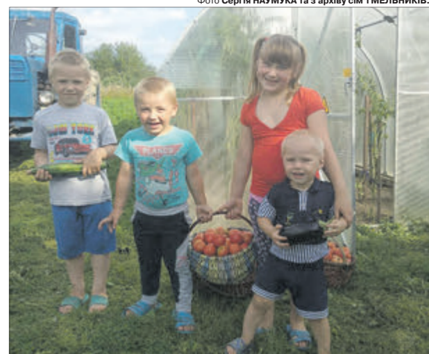
Найбільше врожаєм тішитися дітвора.