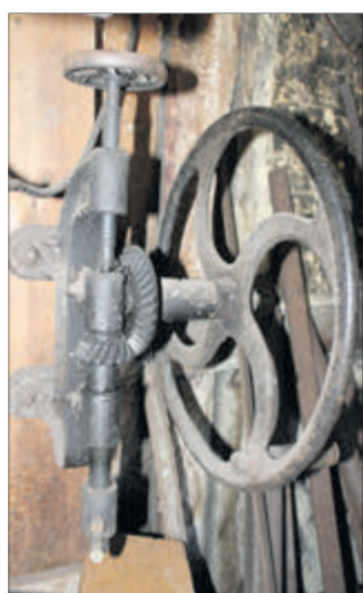
Свердлильний станок 1920-х років називали бормашиною.