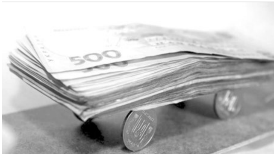
За кошти чесних платників податків вони і «руляють» у політиці.

Про каву. За тиждень випили лише двічі – у Братиславі та Відні, – і то, щоб «відмититись» у кожній із столиць. Пересічним українцям справді дорогоувато смакувати щодня цей напій мінімум за 70 гривень (2,5 євро). Але, як кажуть, не кавою єдиною. Віднем можна насолоджуватись і потягуючи безплатну водичку з міських бюветів. Цікавого тут – море, починаючи від знаменитої опери, куди ми, звісно, сходили... Несподівано, але дуже приємно було побачити наш синьо-жов-