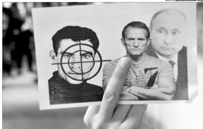
Не дамо на 27-му році незалежності України «прикрити» Василя Стуса (1936–1985)!