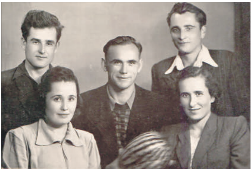
Зустріч після важких випробувань і довгої розлуки.