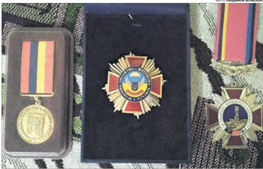
На ці відзнаки батьки солдата не можуть дивитися без сліз.