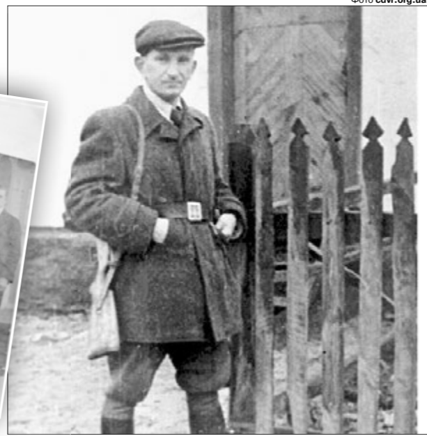
Роман Шухевич у селі Бударж Рівненської області 21–22 листопада 1943 року.