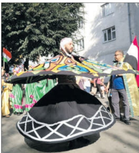
У центрі Волині — яскраве різноманіття культур світу.