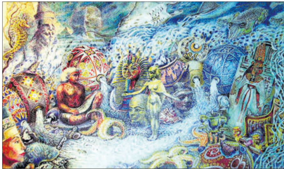
«Затонулі цивілізації. Єгипет».

Євгенія Ковальчук протягом року систематизує ці роботи.