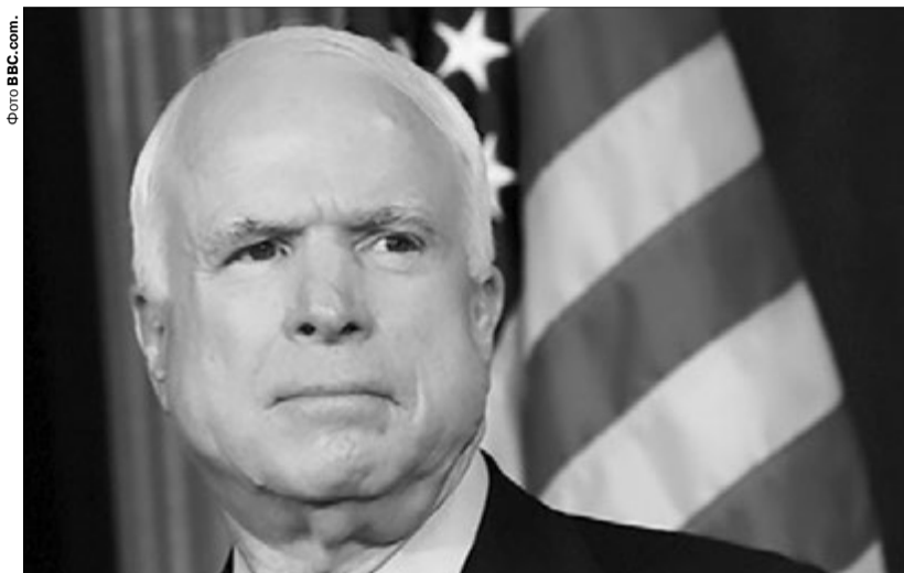
Це він сказав: «Росія – бензоколонка, яка керується мафією і притворюється країною».

Джон ненавидів Путіна і вважав Росію більшою загрозою для світу, ніж Ісламську державу. Усіляко лобював надання Києву зброї: «Ми будемо жити у вічній ганьбі, якщо не дамо Україні леталь-