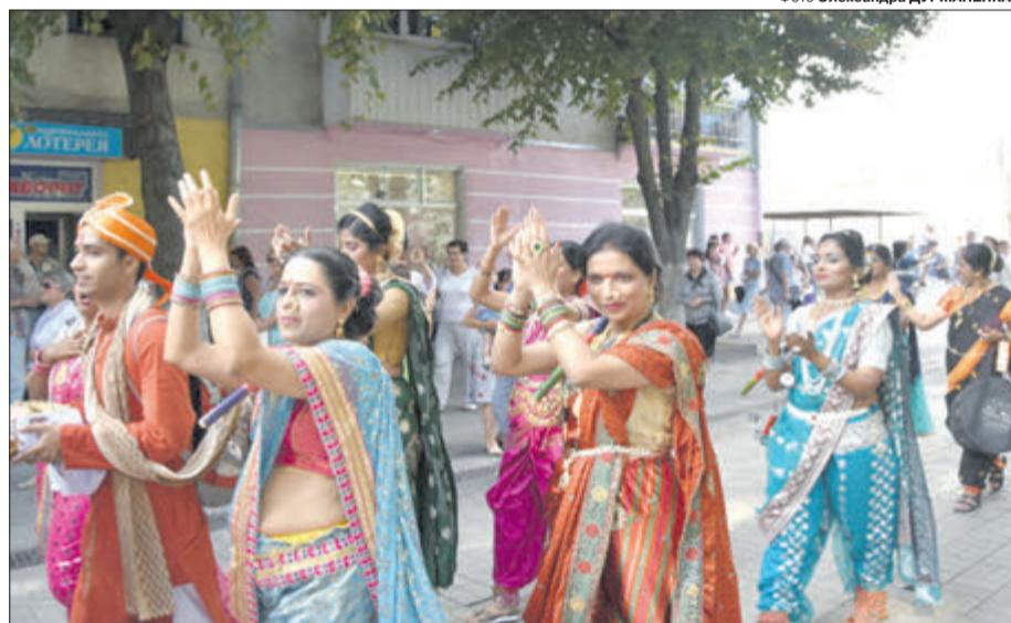
А танцівниці з Мумбаю (Індія) зацікавили не лише любителів індійських фільмів...