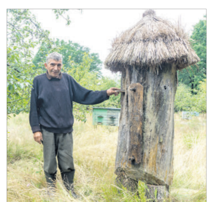
Ось цей будиночок для бджіл — то вже пам'ятка про минуле.