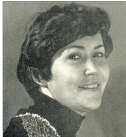
Прийшла в життя, щоб зазвучати картинами.

«Кожен міліметр полотен гелевими ручками із серії «Гармонія» можна вивчати годинами. Давно не бачила на виставках подібного.»