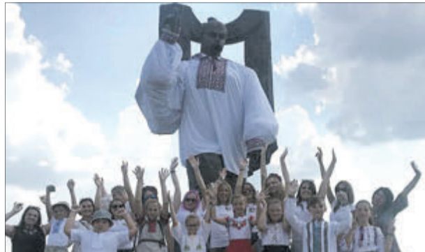
Фото з facebook-сторінки Наталії Попової.