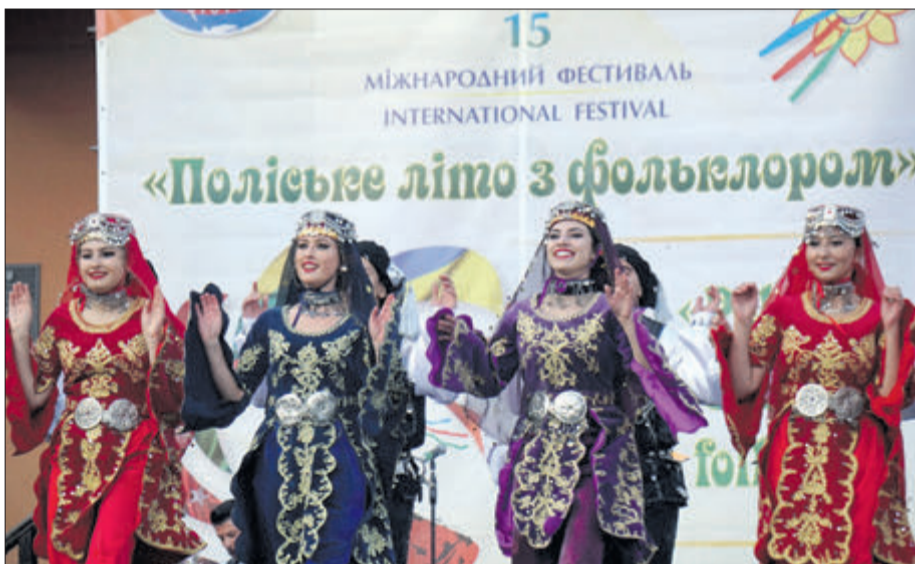
Представниці молодіжного фольк-гурту з університету Анкари (Туреччина) заворожували красою й граційністю.