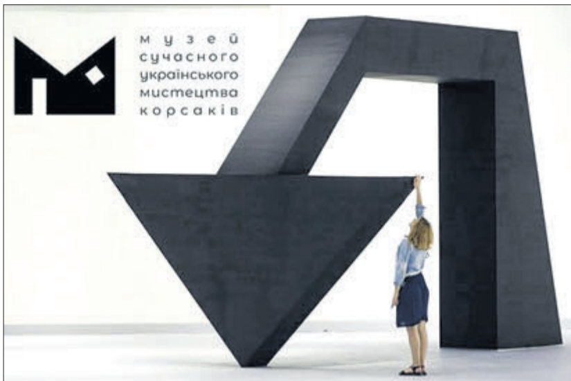
Створення такого сучасного закладу — це наближення людей до мистецтва, а мистецтва — до людей.