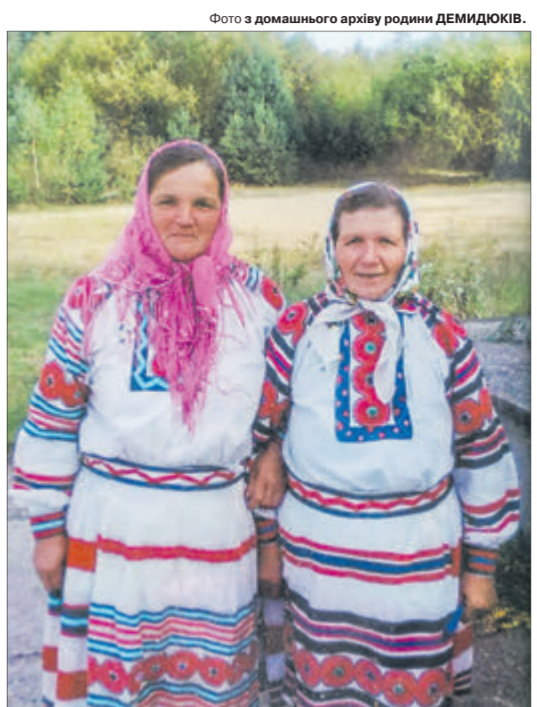
Такі костюми колись на Поліссі мала кожна жінка.