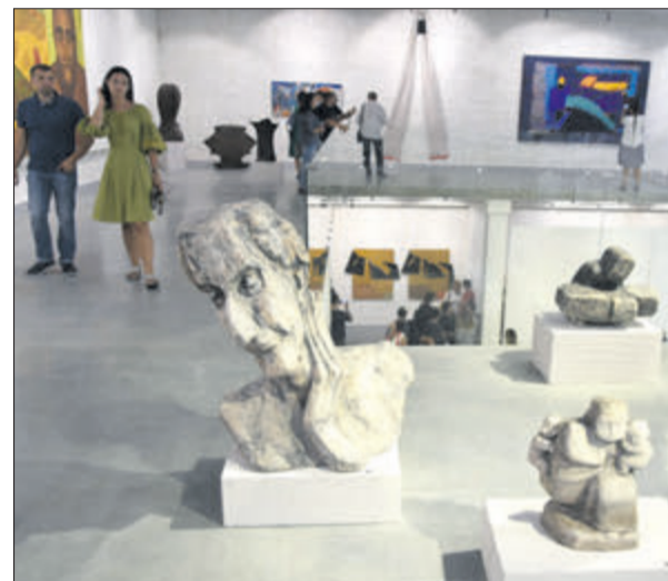
Розглядаючи експозиції, можна міркувати про вічне, а можна, за Екзюпері, очистити душі від невігластва.