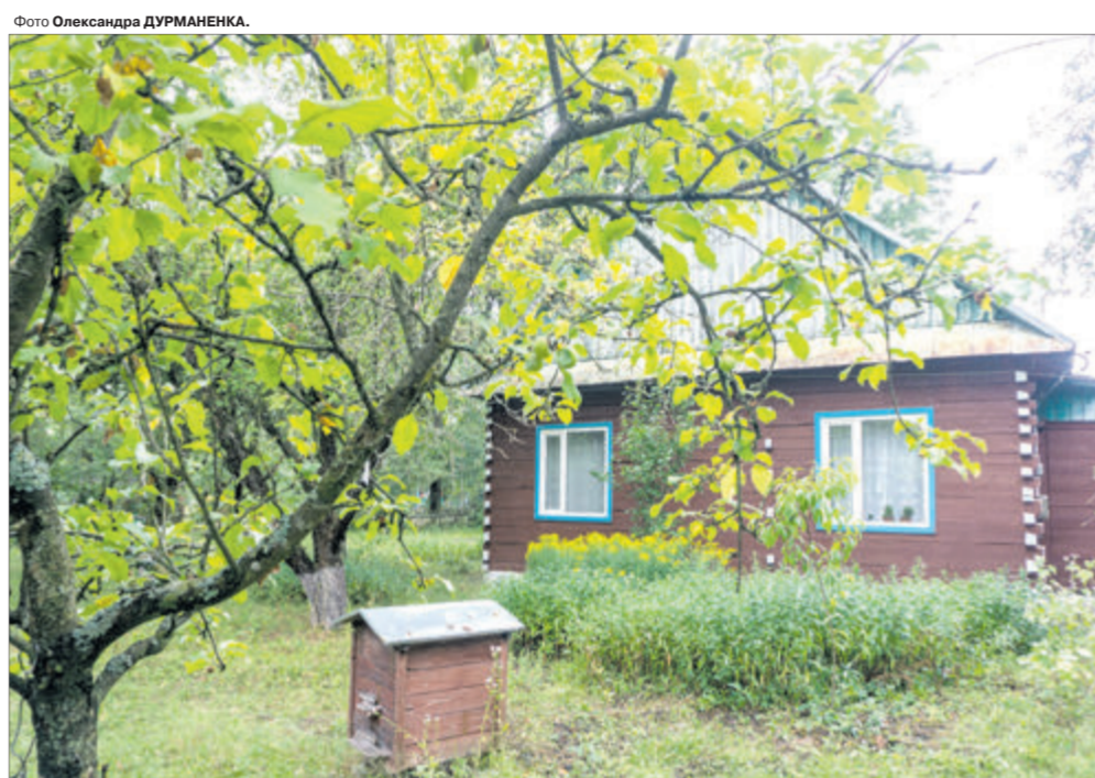
Господарям хати серед лісу не потрібний будинок — їх птахи будять.

— Мужики посходяться, курять, лампа гасова горить, баба тче — крос-