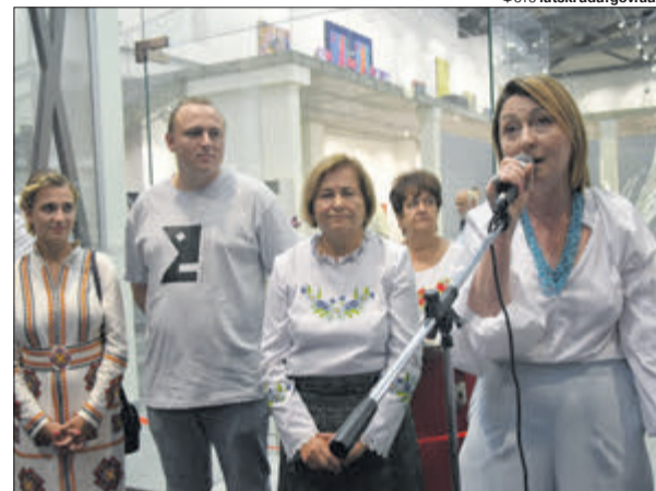
Волинська родина Корсаків відновлює традиції меценатства.