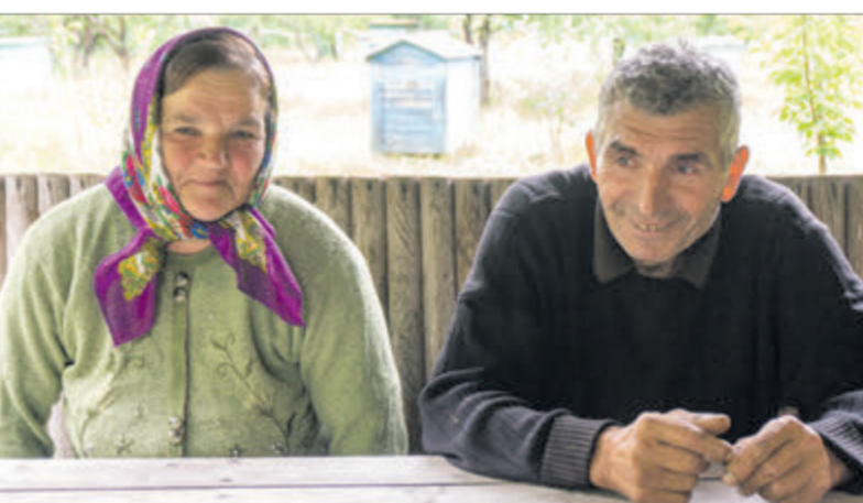
Уже 45 років вони у парі.