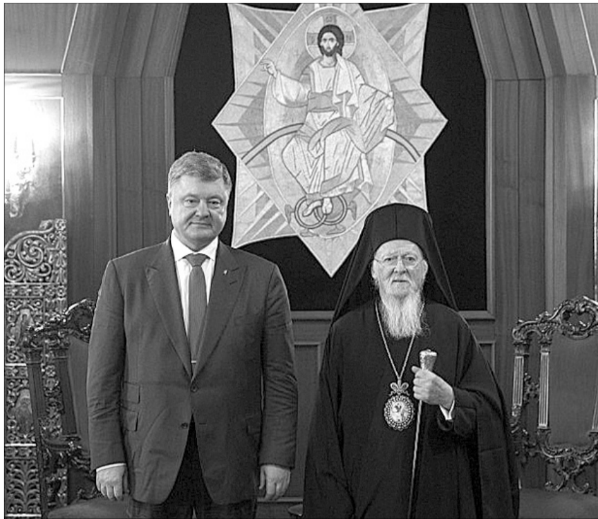
Чи витримає Вселенський Патріарх Варфоломій тиск Москви?

Нагадаємо, Московський патріархат заявив, що розірве відносини з Константинопольським, якщо православній Церкві в Україні нададуть автокефалію. Цікаво, що у 1996 році Російська православна церква вже припиняла контакти із Вселенським патріархатом через те, що Константинополь відновив автономію Естонської православної церкви під своєю юрисдикцією. Однак згодом спілкування було відновлене після того,