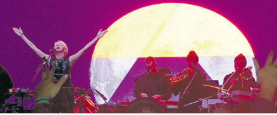
«Ми не німі, німі — не ми, в нас голос є, лунає» — додавала драйву запальна «ОНУКА».