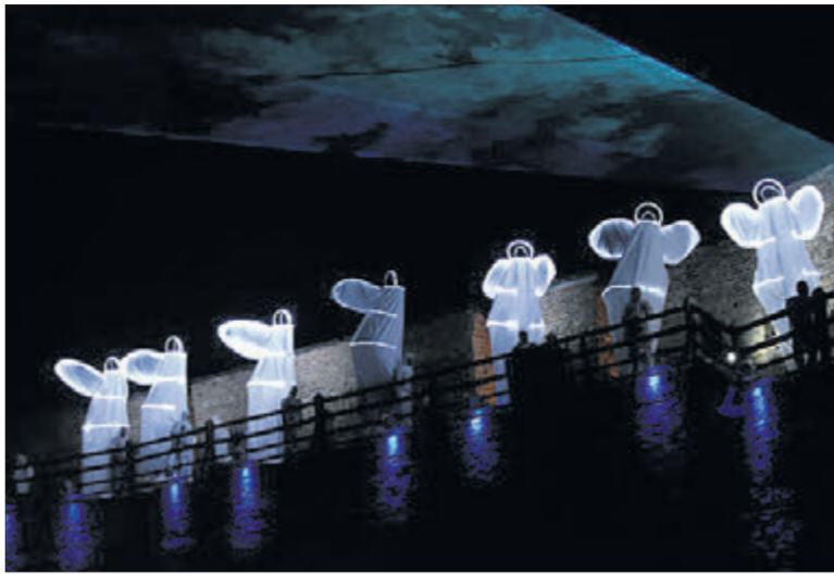
Вежа замку за допомогою 3-D мапінгу за кілька хвилин змінювалася в стилях різних епох, а її охороняла небесна сторожа.