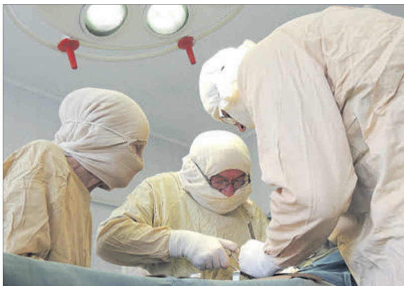
В операційній триває напружена робота.