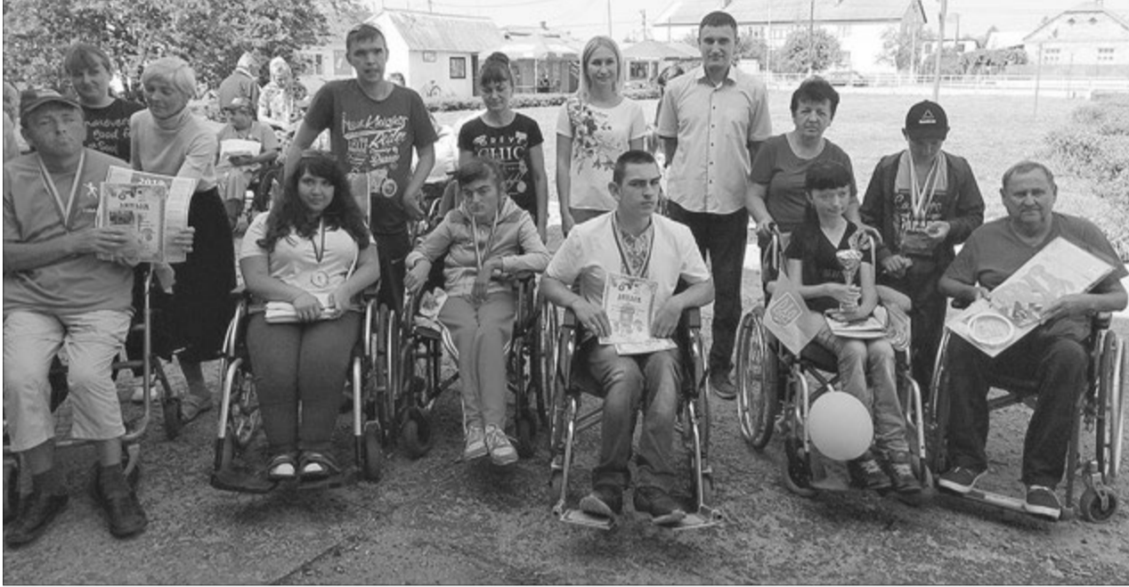
Паралімпійці готові підкорювати нові вершини.