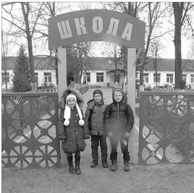
А ці дітки, може, дочекаються нової школи...

«Торік до першого класу в Цепцевичах пішло понад 60 діток, цього року — уже 90, а в наступні буде ще більше.»