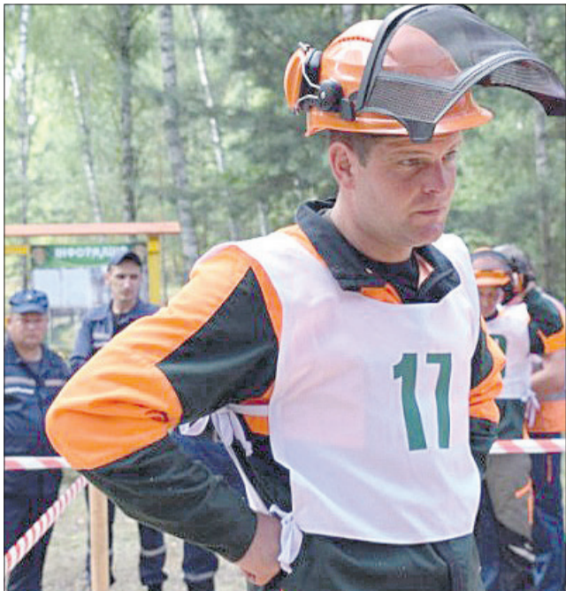
«Бути першим – приємно і почесно», – зізнається переможець.