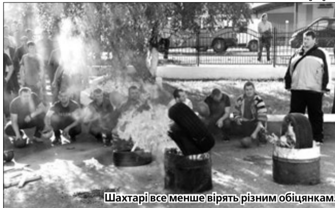
Шахтарі все менше вірять різним обіцянкам.

Десятий день триває протистояння на ВП «Шахта № 9 «Нововолинська» ДП «Волиньвугілля». Та якщо раніше гірники вимагали погашення боргу із зарплати, скасування наказу про переведення підприємства у список тих, які підлягають реструктуризації, то зараз коло претензій збільшилося