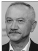
Віктор ПИНЗЕНИК, народний депутат України (м. Київ):

Або інші країни (Болгарія, Естонія), які шукали внутрішні резерви стимулювання економіки: проводили реальну боротьбу з корупцією (а не імітацію!!!), податкову реформу, зменшували бюджетні витрати. Уряд повинен зрозуміти: кабальні умови МВФ — це дорога в нікуди! І якщо Греції пробачили 300 мільярдів доларів та додали ще 80, то в Україні за 2 мільярди доларів народ зроблять жабраками. Вихід є, рішення є, досвід інших країн є. Потрібна політична воля. Але влада зайшла у пік виборчого процесу, тому не до реформ і економіки.