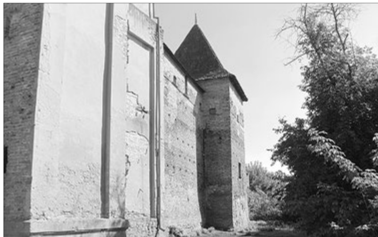
Нині вежа у занедбаному стані.