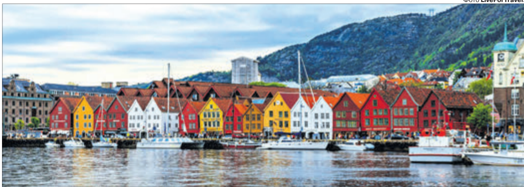
Норвежці живуть у таких гарних будиночках, і багато хто має власну яхту.