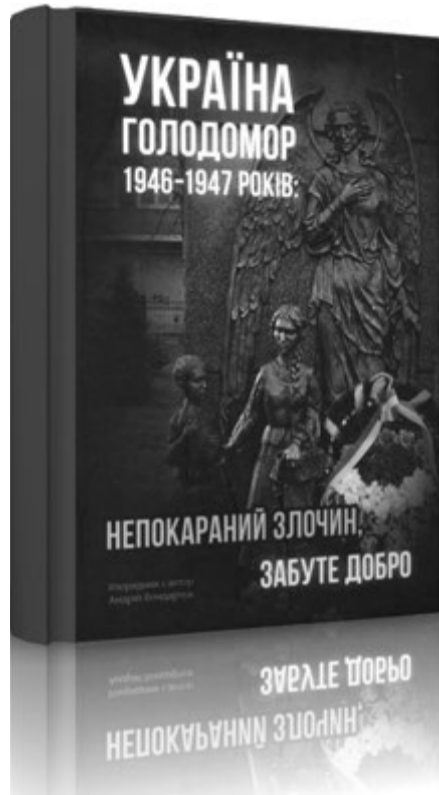
Час продовжити збирати гіркі і болючі спогади.

Якраз ця назва і складе русло нової книги, яку треба створити за вашою, дорогі читачі, участю, співтворством. Насамперед тих, хто пам'ятає лихі післявоєнні роки, коли після жертвовної допомоги голодуючим, які заповнили західноукраїнські села, а волинські особливо, більшовицька система «ощасливила» наш край голодом, якого він не знав протягом минулого століття. Колективізацією з її неодмінними складовими — примусовим вступом у колгоспи, усупільненням нажитого тяжкою працею приватного сільськогосподарського реманенту,