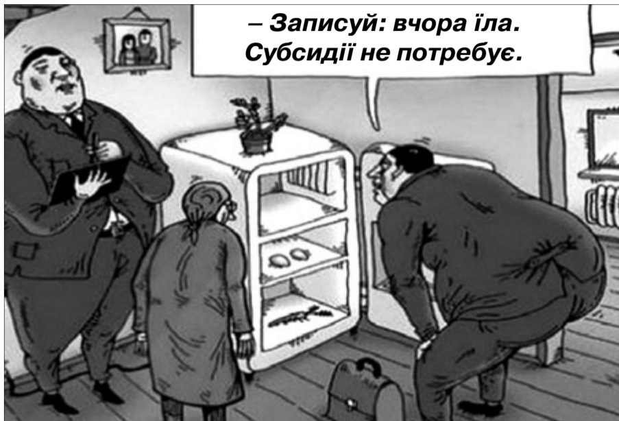
Аби не дійшло до такого...

Перше, що впадає у вічі, — це занедбана територія за кованим парканом і напівзруйнована будівля. Всередині: стеля обвалилася, затікають стіни... Власник декілька років поспіль обіцяє виготовити проектно-кошторисну документацію й розпочати ремонтні роботи. Але, як кажуть, віз і досі там. Не зроблено практично нічого. На всі закиди громадськості у безгосподарності є відмовка: нема коштів. Мовляв, добре, що хоч охороняємо. Інакше б вона перетворилася на притулок для безхатьків. Тож, дивлячись на занедбане приміщення в центрі міста, дивуєшся: чим керувалася влада, віддаючи його установі, яка неспроможна ним опікуватися, довести до пуття? Нині воно для вишу, як чемодан без ручки, — нести тяжко і кинути шкода. Втім, хоч минуло майже вісім років від часу передачі, керівництво університету ще й досі будує проєкти щодо реконструкції. Планують зробити його центром спілкуван-