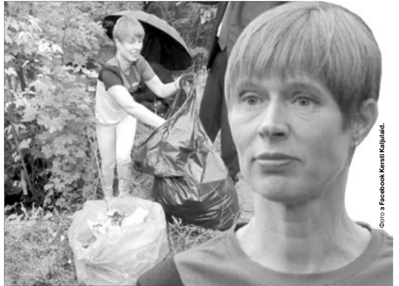
Пані Керсті, ох і здивували ви нас!

— Дуже правильно написано на смітниках: «Чисто там, де не сміять». Для цього потрібно не лише виховувати людей, а й контролювати та карати. Я нещодавно повернулася з Казані, була вражена чистотою на міських вулицях. Поліція дуже строго стежить за порядком. Треба, щоб і в нас так було. Проживаю в Привокзальному районі, і просто страшно стає від того, як безхатьки розкидають непотріб зі сміттєвих баків. І нікому до них нема діла! А з Петром Порошенком прибирала б луцьку Набережню. Там зараз трохи чистіше, ніж раніше, але роботи ще дуже багато. Такий гарний вид на місто. Отож ще треба попрацювати.