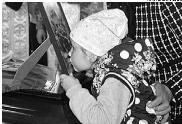
Тепер лише на фотознімках дівчинка бачитиме батька.