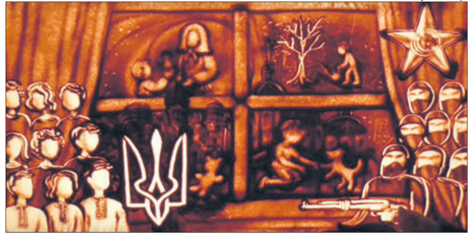
«Ти на Голгофі вже Месія, а на руках іще дитя...»

розширити простір поезії і музики та сказати вам те, що і сьогодні переповнює моє серце. Я не забула, я продовжую розпочату нашими героями і ще не завершеною нами боротьбу за побудову гідної, справедливої і дійсно незалежної держави України.