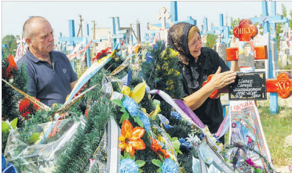
Михайло Іванович і Галина Федорівна не думали, що похоронять сина.