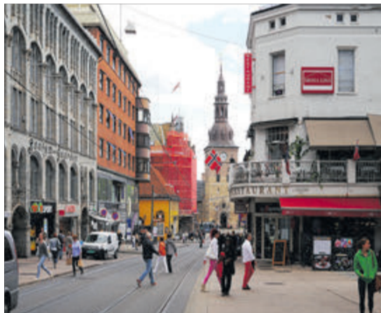
Одна з найдорожчих столиць світу — Осло — не вражає туристів надмірною розкішшю.

Якби до цієї розповіді треба було дібрати епіграф, то найкраще для цього підійшов би вислів «Будьте обережні — мрії збуваються». Річ у тім, що кожного літа, потерпаючи від спеки, я мріяла втекти з Волині в якесь прохолодне місце, наприклад, у... Гренландію, щоб там відпочити від нашої погоди. З кожним роком ставало все важче терпіти спекоту з високою вологістю, а нинішнє літо видалося взагалі, як у тропіках: задуха-дощ йшли щодня по колу. І саме тоді, коли здавалося, що мучитися доведеться до осені, думка про відпустку на півночі несподівано матеріалізувалася! Щоправда, не в Гренландії, а в Королівстві Норвегія