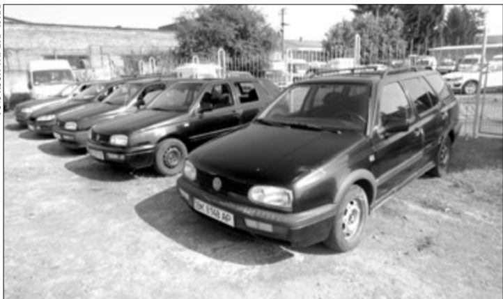
Ці автівки змінили власників і тепер будуть служити громаді.

Така безкоштовна передача здійснена згідно з рішенням засідання Комісії по розпорядженню майном, конфіскованим за рішенням суду і переданим органам держав-