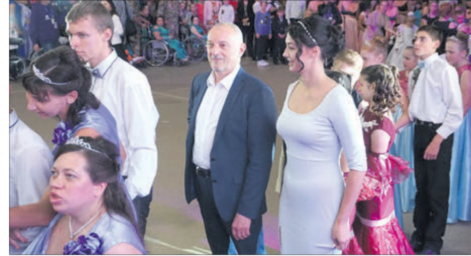
У коло став і голова облдержадміністрації зі своєю чарівною партнеркою.

вказуючи на помилки, не забував хвалити за кожне вдале «па». «Головне — сміливість й усмішка», — підбадьорював і охоче фотографувався з шанувальниками його таланту.