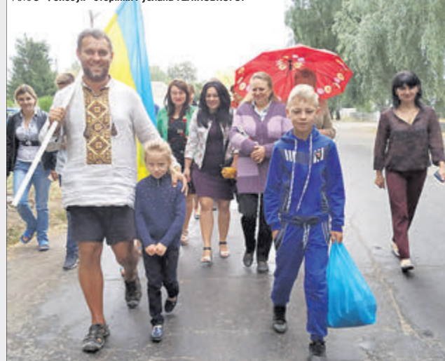
Мандрівника радо зустрічали по всій Україні, а діти переконувалися: мрії здійсненні!