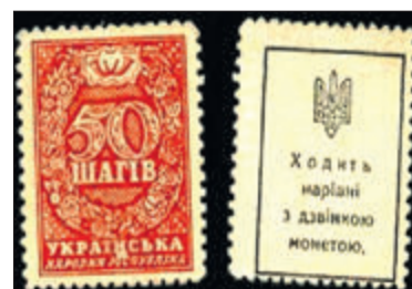
Такими були перші українські марки.

В Україні вони вперше з'явилися в 1918 році в період існування Української Народної Республіки. Творцями сюжетів поштових мініатюр були видатні графіки Георгій Нарбут і Антін Серета. На підставі закону Центральної Ради від 18 квітня 1918 року замість зниклих з обігу розмінних монет були випущені марки-гроші з номіналом від 10 до 50 шагів. Першу серію, названу «шагірковою», друкували на тонкому картоні з написом на звороті — «Ходять нарівні з дзвінкою монетою».