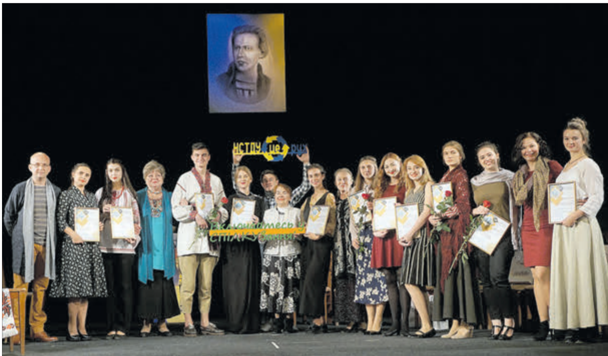
Лауреатів XXII Всеукраїнського конкурсу професійних читців поезії привітали справжні майстри слова.