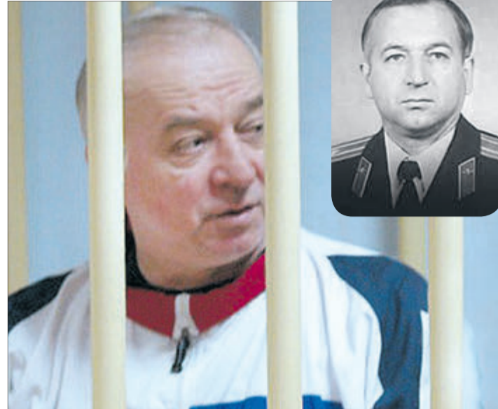
Лише нещодавно світ дізнався, ким був пан Скрипаль.

на Сході України, сказавши, що «якби вони це зробили, то швидко дійшли б до Києва», зазначає Урбан.