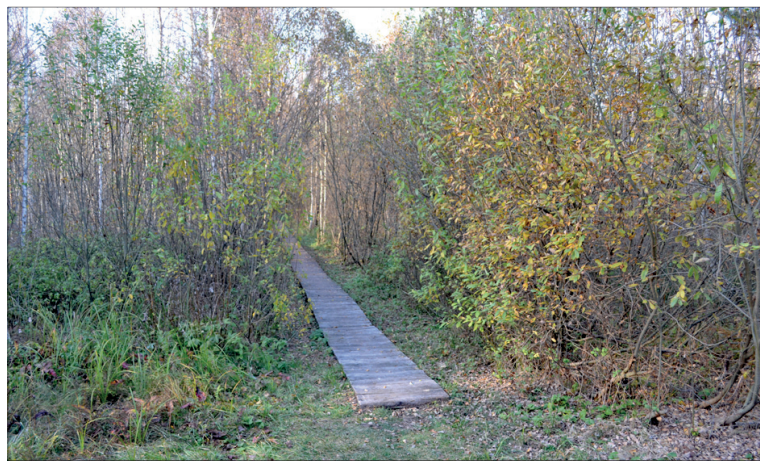
Кладка до Лесинового озера.