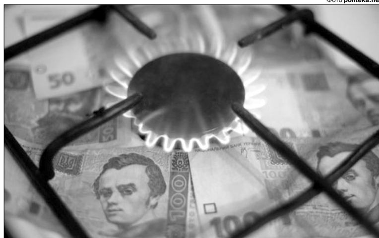
Блакитне паливо тепер стане золотим: подорожчак із 6,96 гривні до 8,55 за кубометр.

Найбільше суперечок виникає довкола визначення ринкової ціни на блакитне паливо. Частина політиків стверджує, що газу українського видобутку достатньо для потреб людей, тому і тариф треба встановити за принципом: собівартість виробництва плюс прибуток. Але за таких умов позбутися монополії на ринку не вдасться. Інший варіант, на який нібито Кабмін погодився