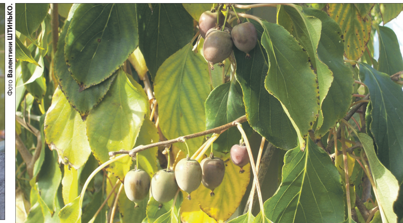
Протягом місяця актинідія радує господарів свіжими ягодами.