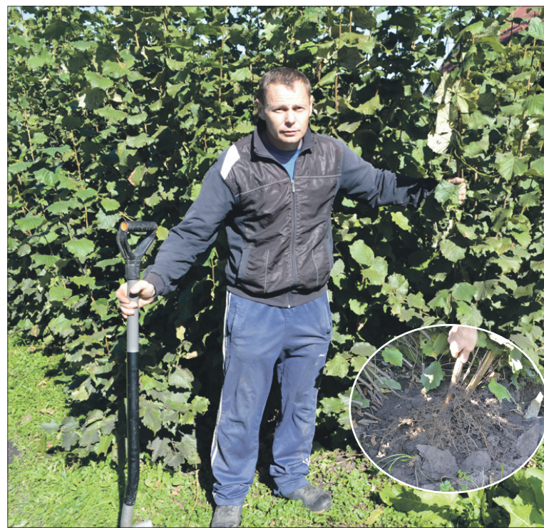
«Горіхи тільки на перший погляд доглядати просто».

Навесні або пізно восени нагинає гнучкі гілки і прикопує їх. На перший погляд усе дуже просто. Але насправді це не так. Адже, аби кожен пагін пустив корені й у майбутньому став саджанцем, треба дотриматися певних