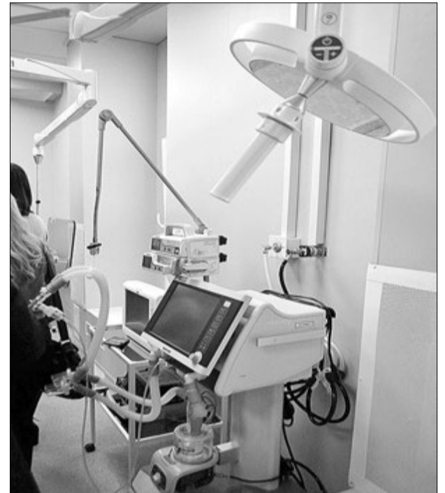
Дорогоцінне обладнання допоможе рятувати жителів Полісся.

На ангиографі працюватимуть четверо заздалегідь підготовлених фахівців, які неодноразово проходили навчання і стажування в Київському центрі серця,