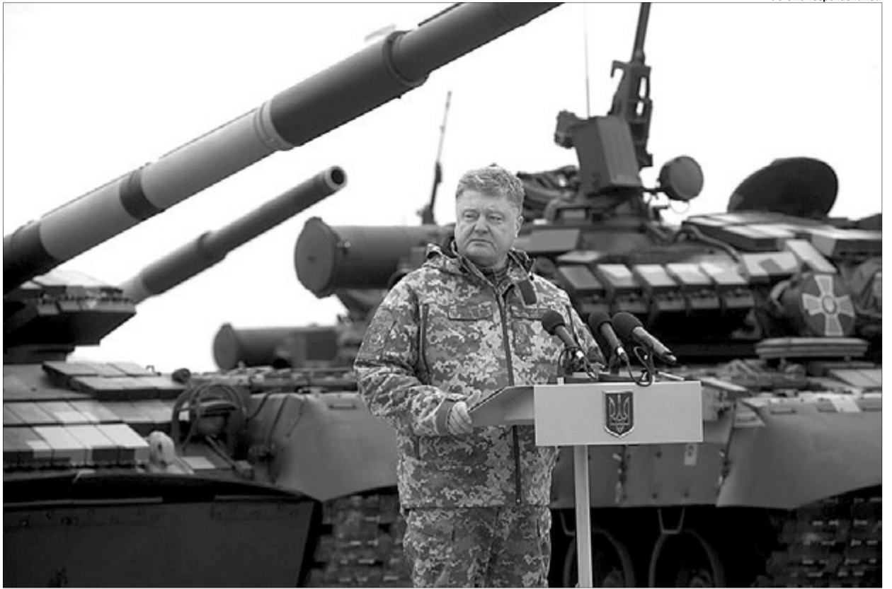
«Прощай, немытая Россия!»