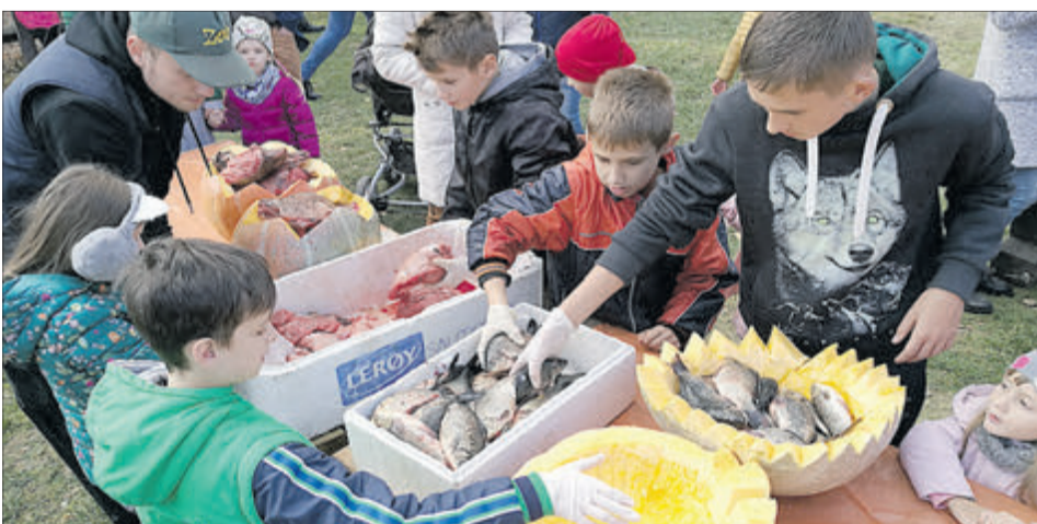
Гості зоопарку допомагали готувати гарбузове частування.