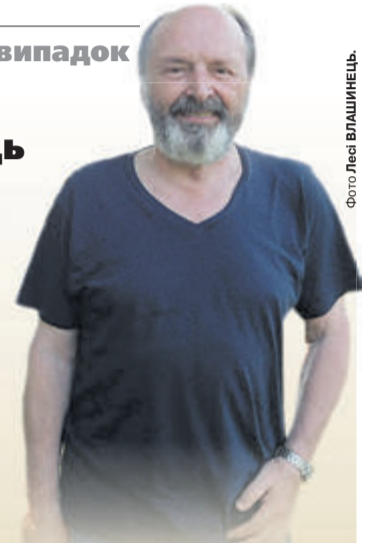
У Звинячому на Горохівщині Павло Дацюк почувався як удома.