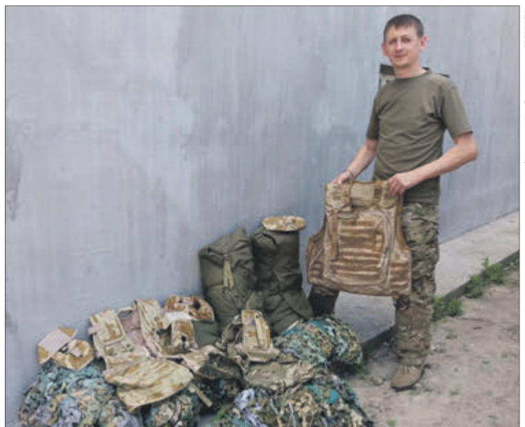
«Ми воюємо — і хочемо перемоги. Зі звільненням окупованих територій», — говорить капелан.