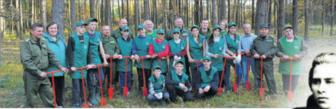
Серед учасників акції — і учні, і письменники, і художники.