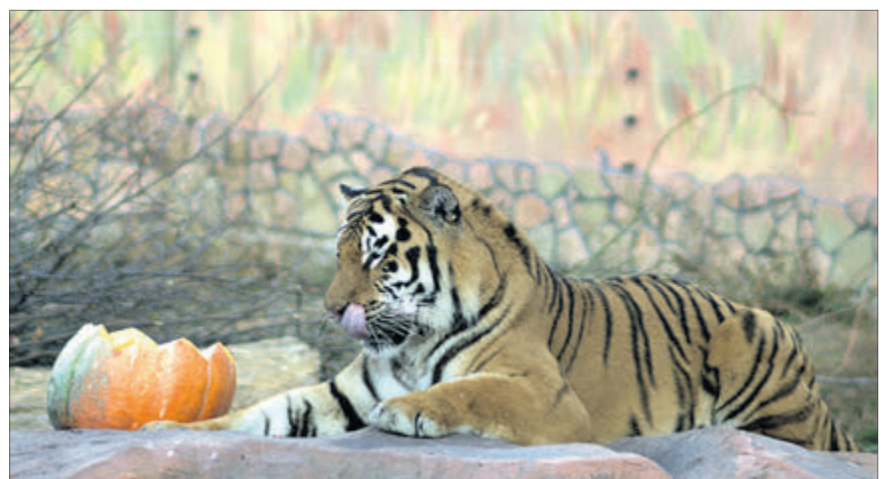
Смачно так, що велика кішка аж облизується!