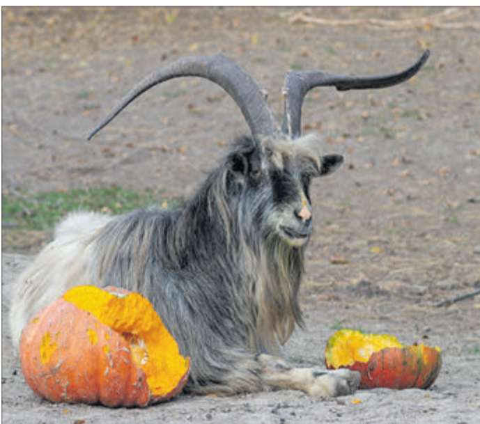
Що то природна хитрість — обклався гарбузами з обох боків!