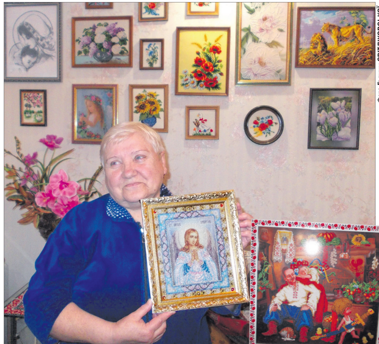
Фото Галини СВІТЛІКОВСЬКОЇ.

Спілкуючись колежанці, жінка, напевно ж, згадувала про свою доню, яка вже понад 10 років опікується прикутими до ліжка недужими в Італії. Наталія, за словами мами, має добрий, але сильний характер. «Вибиває» у господарів гроші на ліки для підопічного, аби поліпшити його самопочуття. У попередній сім'ї, де медсестру з Луцька вважали членом родини, все було по-іншому. Там діти й онуки шанували батька й дідуса, а його доглядальницю дуже цінували. Коли ж старенького не стало і Наталія йшла з того дому, то подарувала своїм уже колишнім роботодавцям вишиті мамою