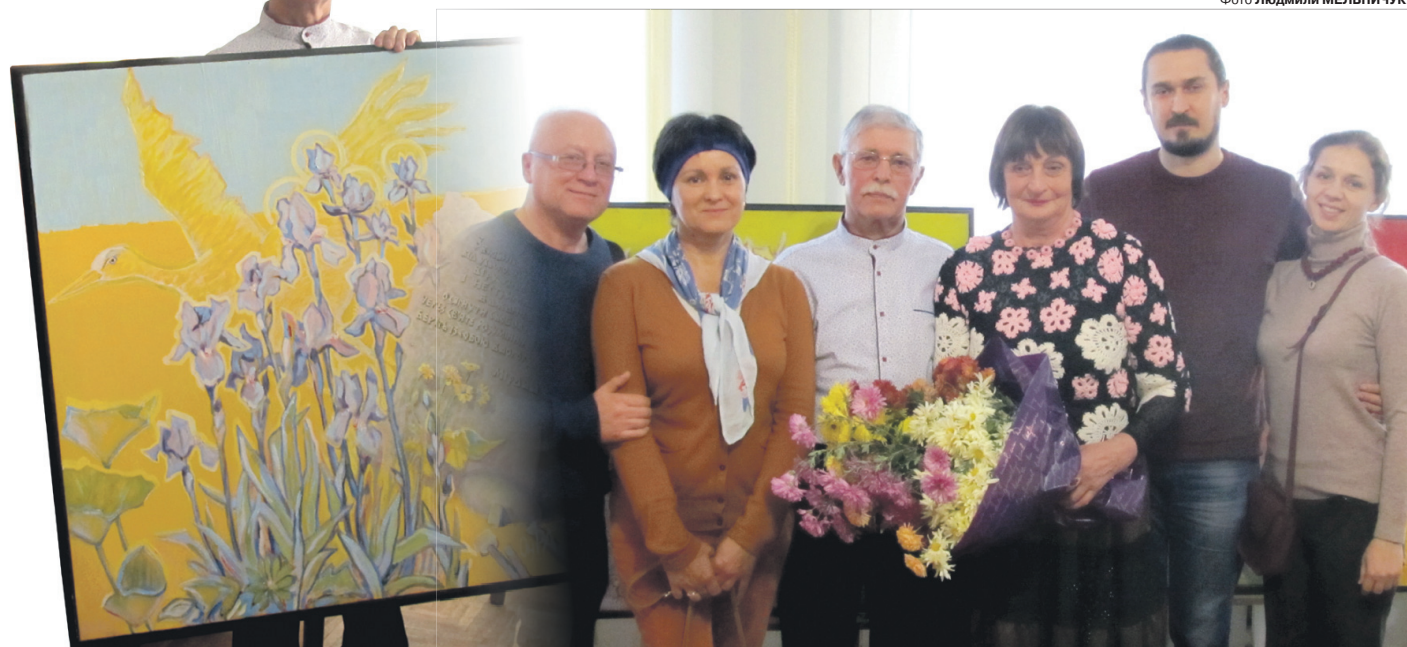
Одне з нових полотен майстра першими побачили локачани.