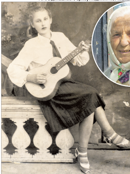
А в молоді літа дівчина була нерозлучна з гітарою.