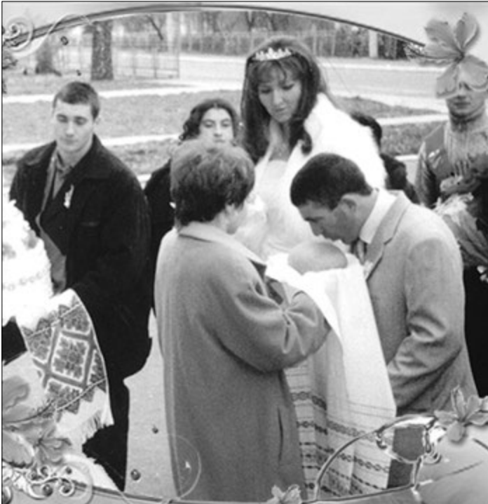
Головне, що почуття високі!