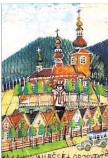
Храми, гори та святі часто фігурують у роботах художника.

році польський художник Єжи Вольф опублікував нарис «Малюк наївного реалізму у Польщі», і з того часу кілька десятків літ Никифор був у центрі уваги і митців, і глядачів, котрих захоплювала його самотнтя творчість.