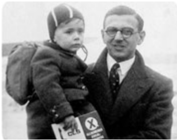
Для більш як шести сотень дітей він став другим батьком.

Чоловік 50 літ мовчав про те, як у 1939 році він вивіз із окупованої німцями Чехословаччини приречених на смерть хлопчиків і дівчаток, які повинні були загинути у фашистських концтаборах під час Голокосту