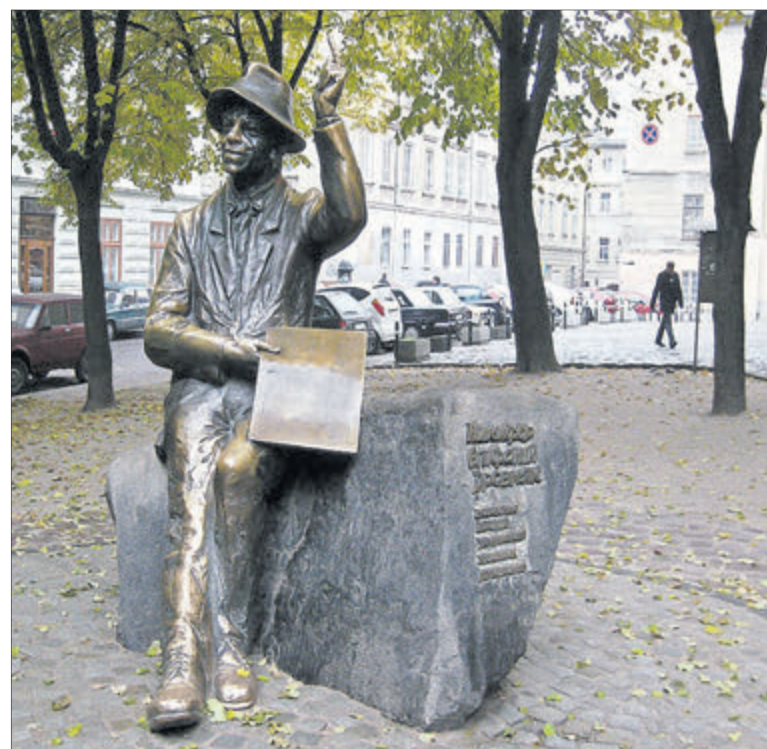
«Щасливий палець» Никифора Дровняка на пам'ятнику у Львові туристи затерли до блиску.