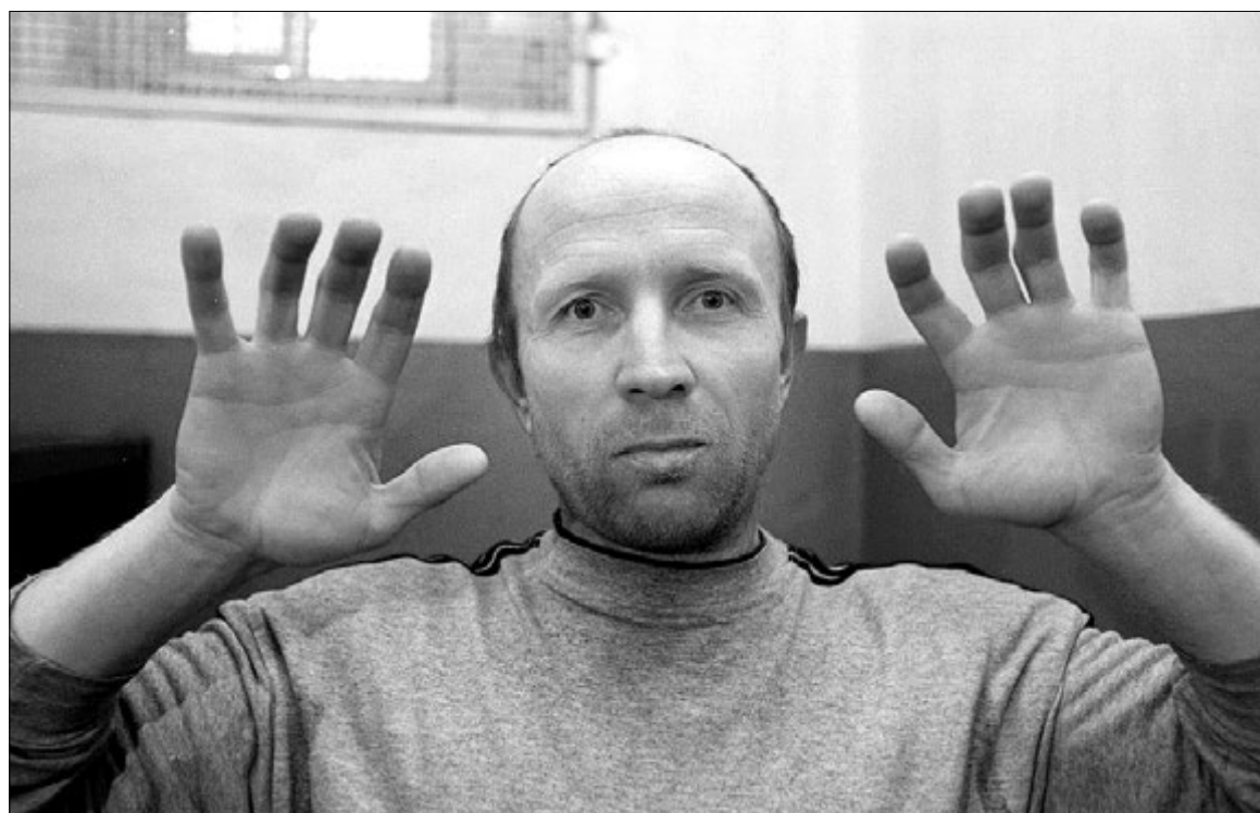
«Може, це подіяли на мене якісь впливи? Я сам не міг такого зробити».

Здавалося б, колишньому вихованцю дитбудинку радіти з такої прихильності долі й щиро тішитися життям. Проте він обирає інший