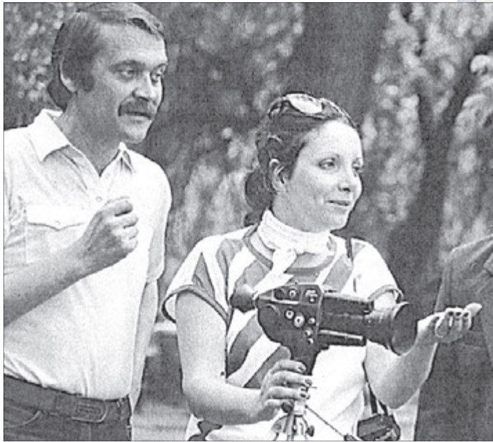
Французька режисерка, зачудована українською природою та людьми, багато фільмувала на камеру.

— На жаль, ніхто не підійде до цієї теми з таким боєм, як Іван Миколайчук, — вважає кінокритик. — Його завжди цікавили історії і переживання людей, відірваних від рідної землі. Сьогодні, як і століття тому, українці їдуть у чужі світи, залишаючи сім'ї. Є чудова документальна стрічка Вікторії Мельникової «Четверта хвиля» про проблему еміграції. Але «Острів сліз» — про інше. Про почуття людини, яка втрачає Батьківщину назавжди. Поставити його здатен лише той, кому болить так, як боліло колись Миколайчуку. Французька режисерка