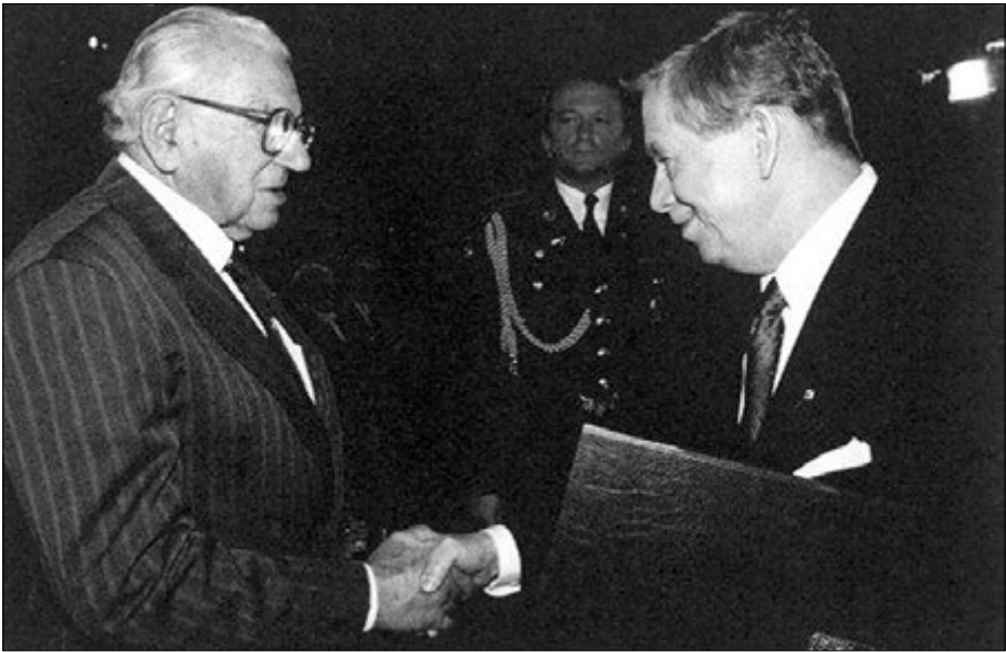
1998 рік. Легенда зустрілася з легендою: руку Ніколасу Вінтону (ліворуч) тисне колишній президент Чехії Вацлав Гавел.