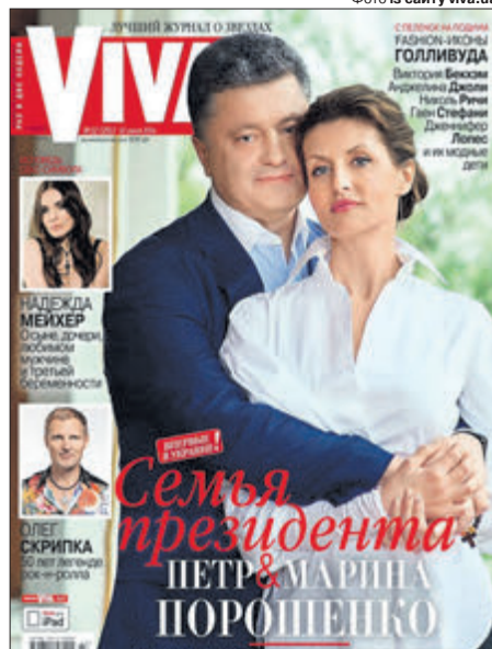
«Я люблю тебе, як у перші дні нашого знайомства».

Дівчина була не з прости, її батько обіймав посаду заступника міністра охорони здоров'я УРСР.