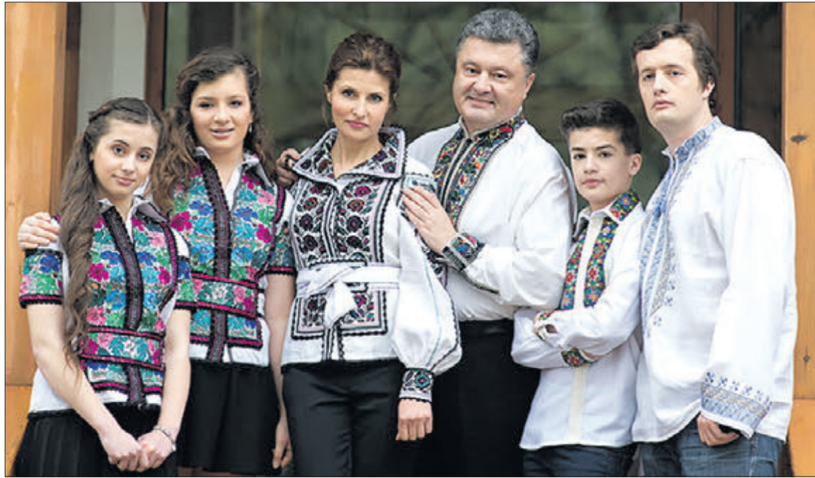
Порошенки всі головні свята відзначають у родинному колі.

Правда, зустрічатися молоді люди почали лише через півроку. Вийшло так, що їх направили в колгосп збирати урожай. «Офіційного запрошення не було. Просто непе-