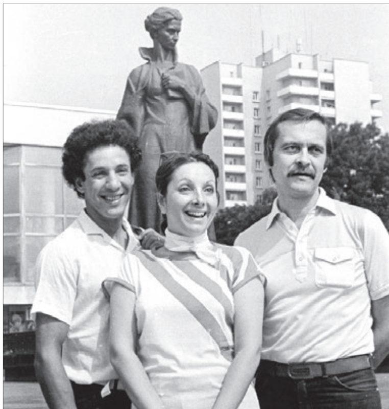
Актор Яхія Хараши (чоловік Еліані), режисерка Еліані Сабате та Іван Миколайчук у Луцьку, 1985 рік.

Таких сіл у 1980-х було немало, але тодішні спецслужби, поінформовані про приїзд іноземних гостей, доручили місцевій владі показати таке село, яке проілюструє успіхи Радянського Союзу, а не злидні: великі кол-