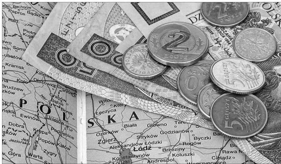
Є цілі сайти, які не просто запрошують наших абітурієнтів навчатися в Польщі, а й одразу пропонують їм підробіток.

Немає сумніву, що такий крок наших найближчих сусідів сприятиме подальшому відтоку української робочої сили,