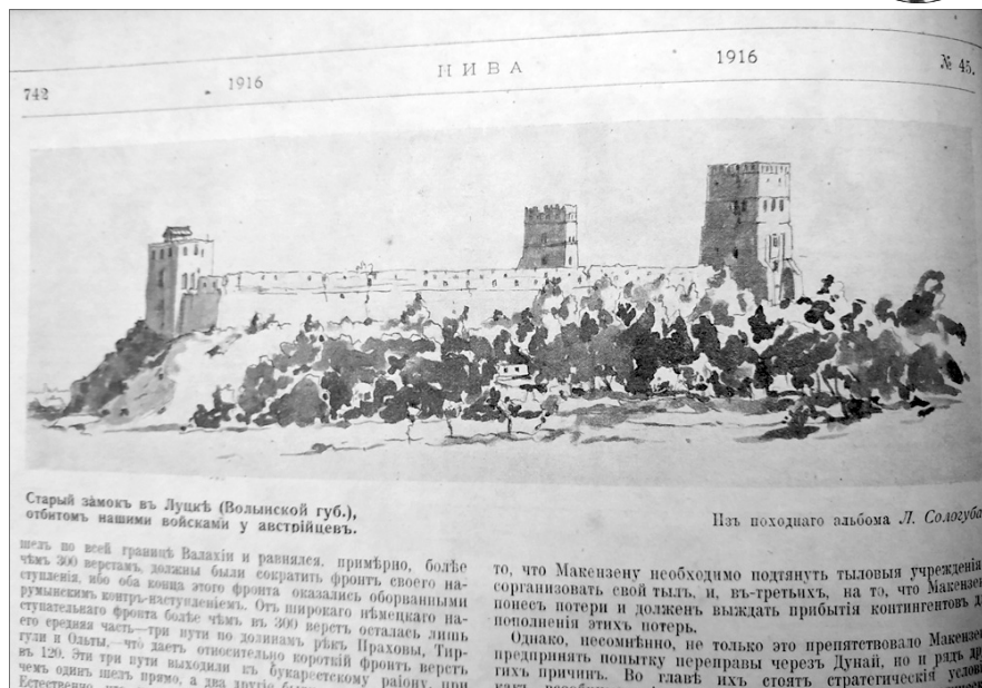
Старий замок в Луцьку (Волинської губ.), отбитий нашими військами у австрійців.