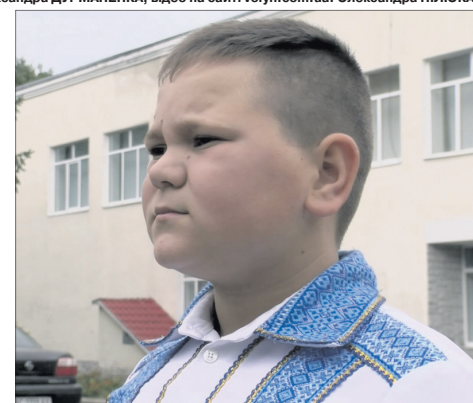
Проникливі слова з дитячих уст: «Я не можу бачити могили...»