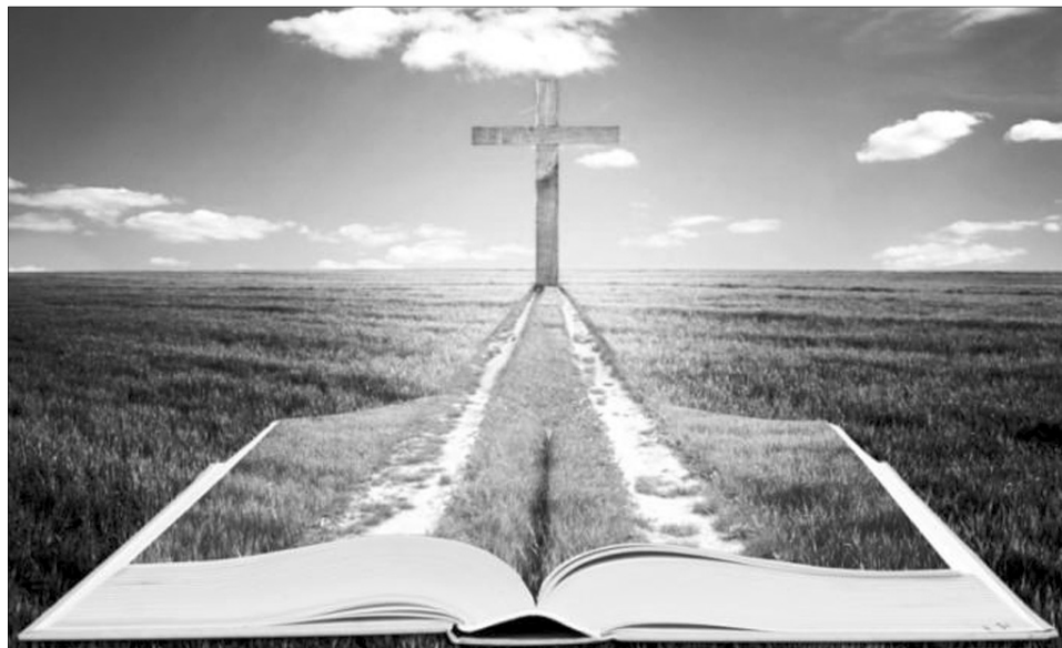
Любов до Бога — це насамперед любов до ближнього.

Я, відверто кажучи, дещо заскочений. Ні, Боже збав, у протестанта, а тим більше в якогось мусульманина чи кришнаїта «перехрещуватися» за жодних умов не збираюся. Заскочений саме посиленням на дружину російського імператора