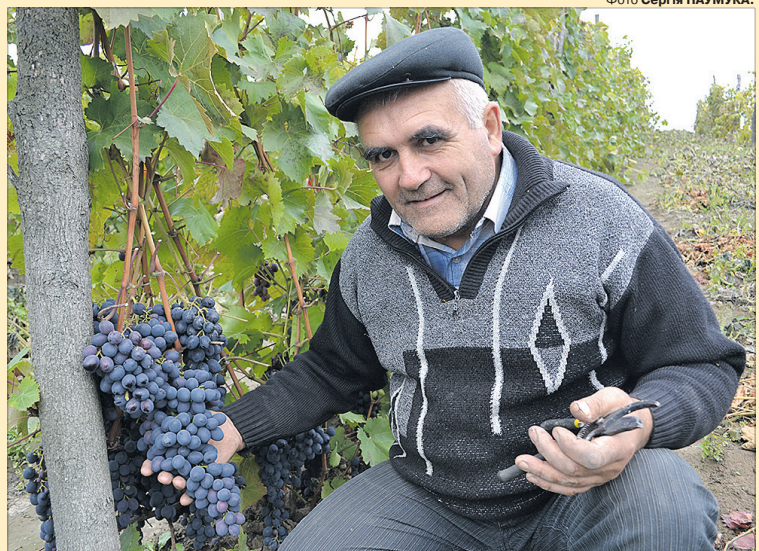
У досвідченого виноградаря виростають ось такі солодкі грона.

«Уся робота забирає небагато часу — на один куц витрачаю близько 15 хвилин.»