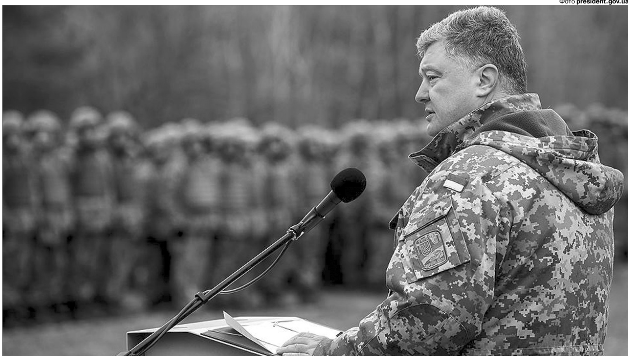
«Президентські вибори мають відбутися 31 березня 2019 року. Крапка».