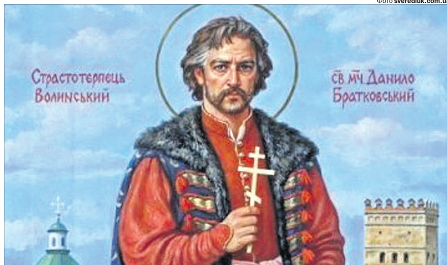
Таким побачив Братковського сучасний художник Артур Орлюнов.

« 27 червня 2013 року Помісний Собор УПЦ КП канонізував Братковського і причислив його до святих Волинського краю в лику стратотерпець. »