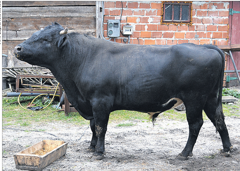
Бичок у Масловоці, напевно, найкрупніший з тих, яких тримають одноосібники на Волині.