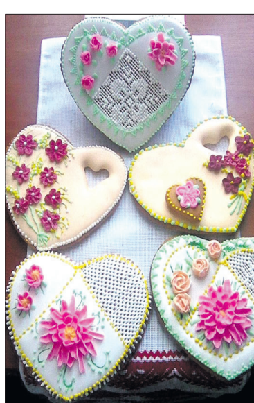
Медові пряники можуть зберігатися кілька місяців.

— Не чула, щоб у Шацькому районі хтось їх випікав.