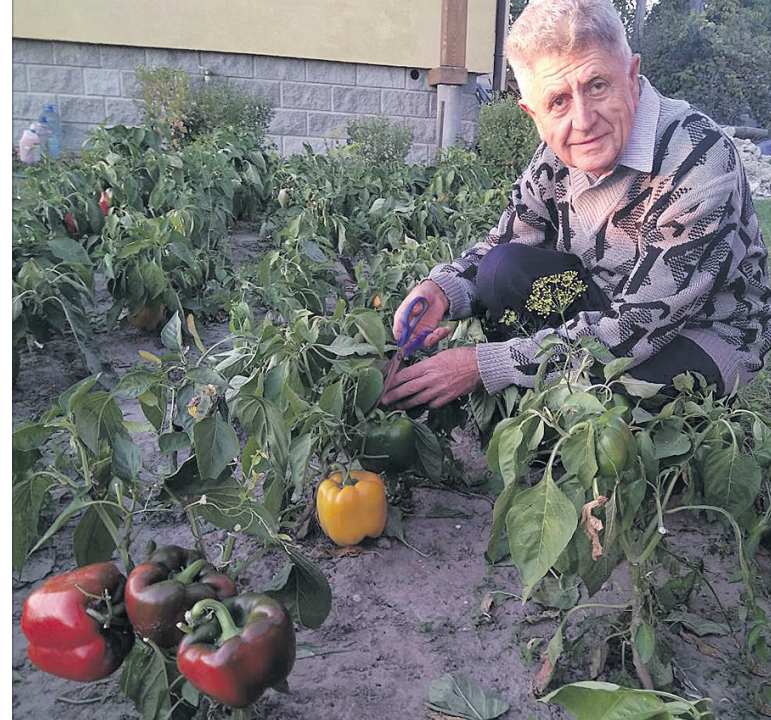
Цьогорічний плід-чемпіон заважив 410 грамів.

дуть зелене добриво. Для цього використовують олійну редьку, гірчицю, жито або пшеницю, які здатні витримувати примороз-