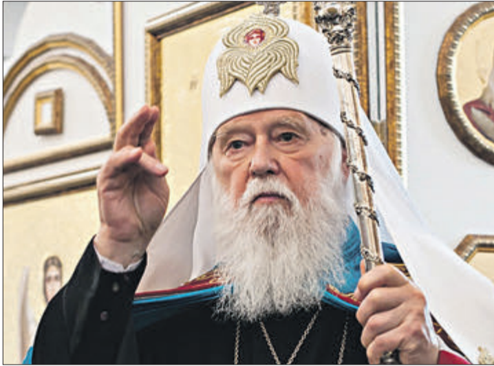
У Москві поширили інформацію, що предстоятель Київського патріархату просив Кирила про помилування.

29 листопада у Москві відкрився Архієрейський Собор, який став рекордним за кількістю учасників — на нього зареєструвалося 347 архієреїв російських і зарубіжних єпархій РПЦ. Його вважають особливим для української церкви, бо багато уваги приділено саме питанню статусу УПЦ (МП). А звернення патріарха УПЦ (КП) Філарета до учасників з'їзду викликало неабиякий резонанс як серед духовенства, так і серед вірян