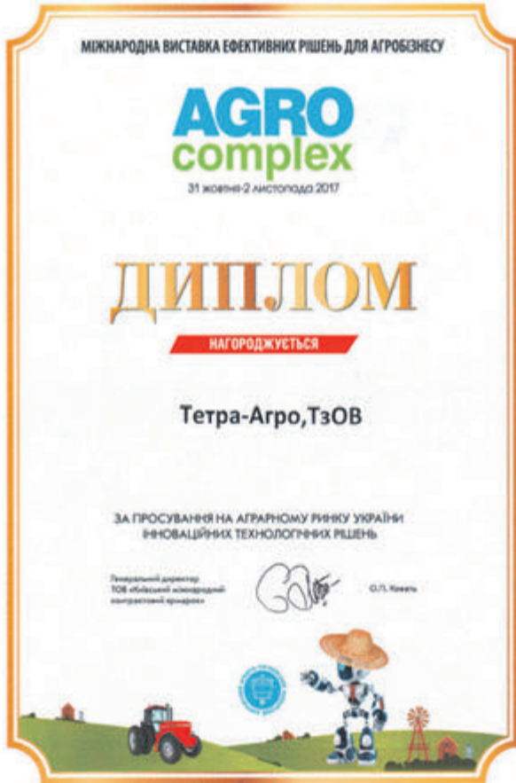
Здобутки компанії відзначили міжнародні експерти.

Компанія співпрацює з науково-дослідними установами. Зокрема, спільно із Львівським національним аграрним університетом проводили дослідження щодо впливу нашої продукції на вирощування сої, і їхні результати додали впевненості у перспективності виробничого напрямку діяльності підприємства.