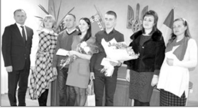
Фото молодят і їхніх гостей на згадку.