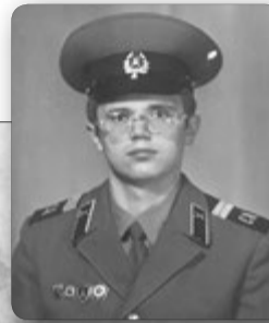
Таким їхав на «дембель».

чорної землі». Хлопці відразу робили висновок: «Нажрався, сволота, й жінка відмовила, то тепер він нас буде дрючити».