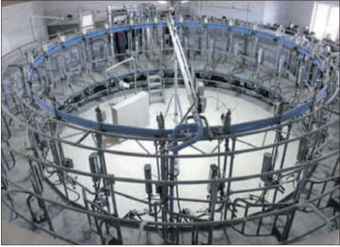
Унікальний шведський доїльний зал, так звана карусель, обслуговує одночасно 24 корови.