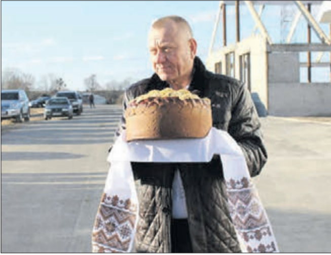
Володимир Яренчук упевнений, що робить потрібну для держави й українців справу.