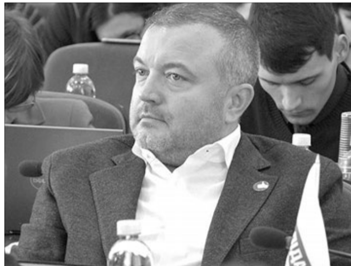
Депутат Луцькради та засновник громадянського руху «Свідомі» снів на вітер не кидає.

«Програма не виконана повністю: з передбачених