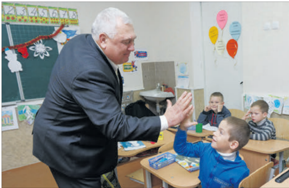
Яку оцінку сьогодні приніс додому? «П'ять» від директора!