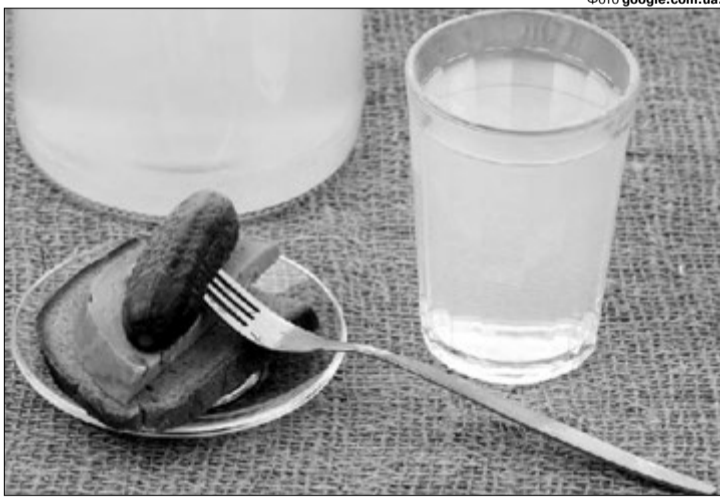
Ось і вся закуска на такий гранчак...

Депутат Рівненської обласної ради Микола Драганчук, до якого звернулися чудельці й котрий відправив