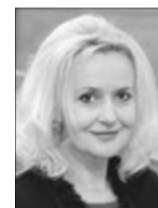
Ірина ФАРИОН, народний депутат України VII скликання (м. Львів):

А найбільш негативною у житті України є, звичайно, бойове протистояння на Сході: гинуть бійці, зокрема й наші земляки. Може, забагато у мене негативу, але, що ж зробиш... Засмучує поштова реформа. Щодня до редакції дзвонять читачі чи пишуть листи, в яких нарікають на скорочення листинош. Це дуже болісне питання, бо виникає проблема з доставкою газет. І йдеться не лише про зменшення тиражу, а про те, що інформация не доходить до людей.