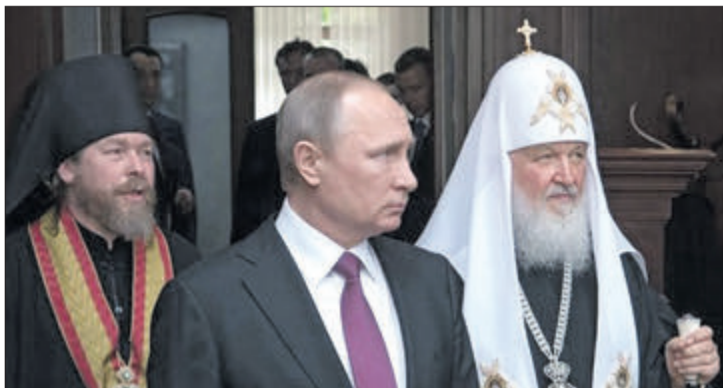
Через кілька років місце Кіріла займе наближений до Путіна митрополит Тихон (Шевкунов) (на фото зліва).

От і все. Скінчено. Незалежність Української церкви стала реальністю