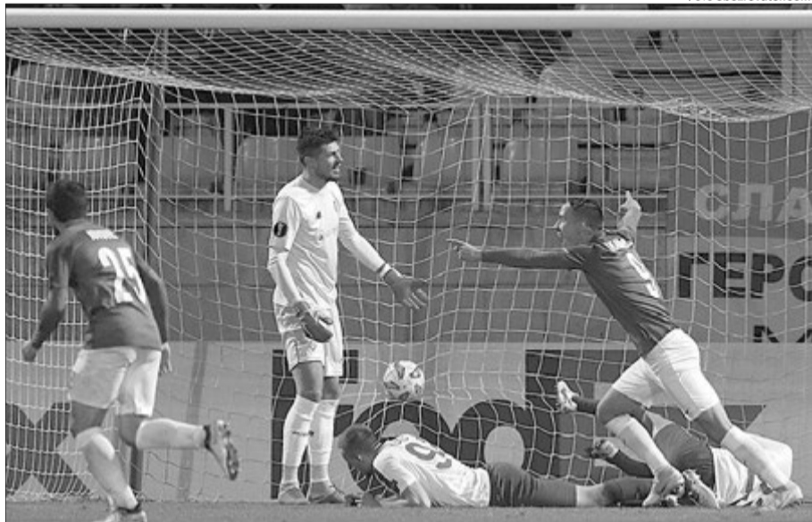
У двох матчах із аутсайдером групи із Чехії динамівці набрали лише 1 очко із 6 можливих...