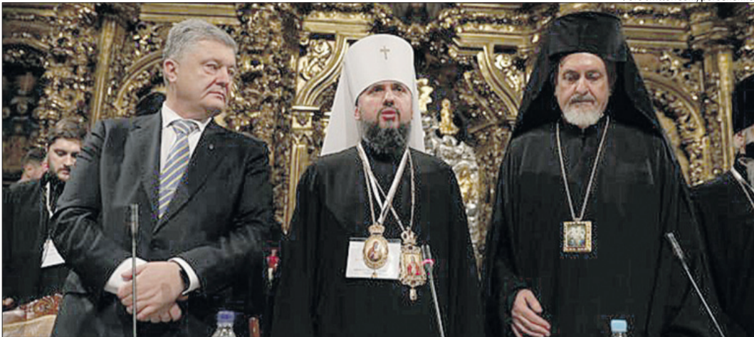
Історичне фото: Президент України Петро Порошенко, митрополит Київський та всієї України Епіфаній, митрополит Гальський Емануїл.