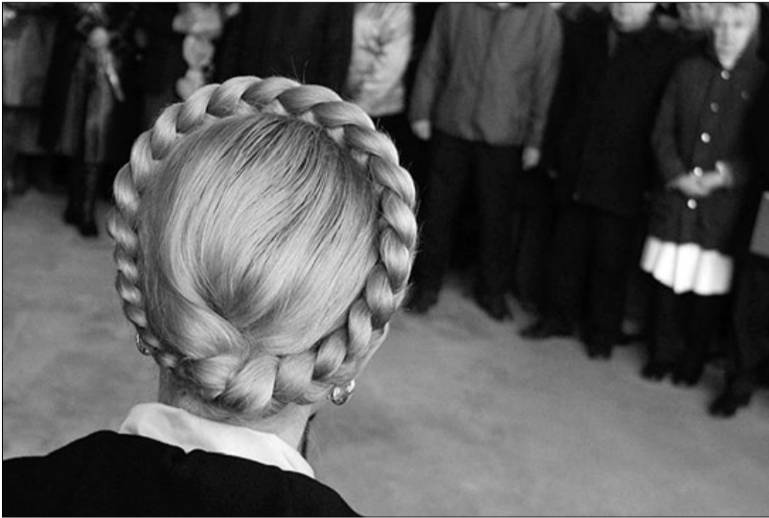
«Коса моя розплетена, її піарниця розплела...»

«Їхні обличчя знайомі всім українцям. Вони десятиліттями не «злазять» з екранів, наче, герої улюблених серіалів. Учора — при владі, сьогодні — в опозиції, а завтра йтимуть у президенти», — це початок однієї із серій програми «Джокери», ведучим якої став екс-президент Грузії Міхеїл Саакашвілі. Герої проекту — українські політики, які вирішили змагатися за президентське крісло. Першою в об'єктив журналістів і Саакашвілі потрапила Юлія Тимошенко. Гості програми розвідали, як і з якими грошима «Вона» прийшла в політику, які «персонажі» входили в її оточення, а також з'ясували, чи справедливо кандидатку на найвищий пост в Україні називають «кремлівською зозулею»