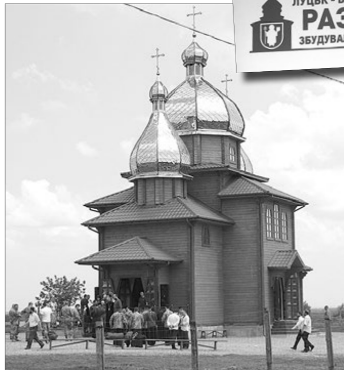
Освячення храму у травні 2018 року.

Для ефективної роботи елеватора потрібна хороша логістика. Знаючи це та зважаючи на дефіцит вагонів, неефективну роботу залізничні, ми зважилися ще на один важливий крок — закупили 54 вагони-зерновози за 3,5 мільйона доларів. А також тепловоз, який може здійснювати маневрові роботи, надавати послуги на залізничній станції «Володимир-Волинський». До слова, за минулий місяць по Україні відправили 350 вагонів із зерном.