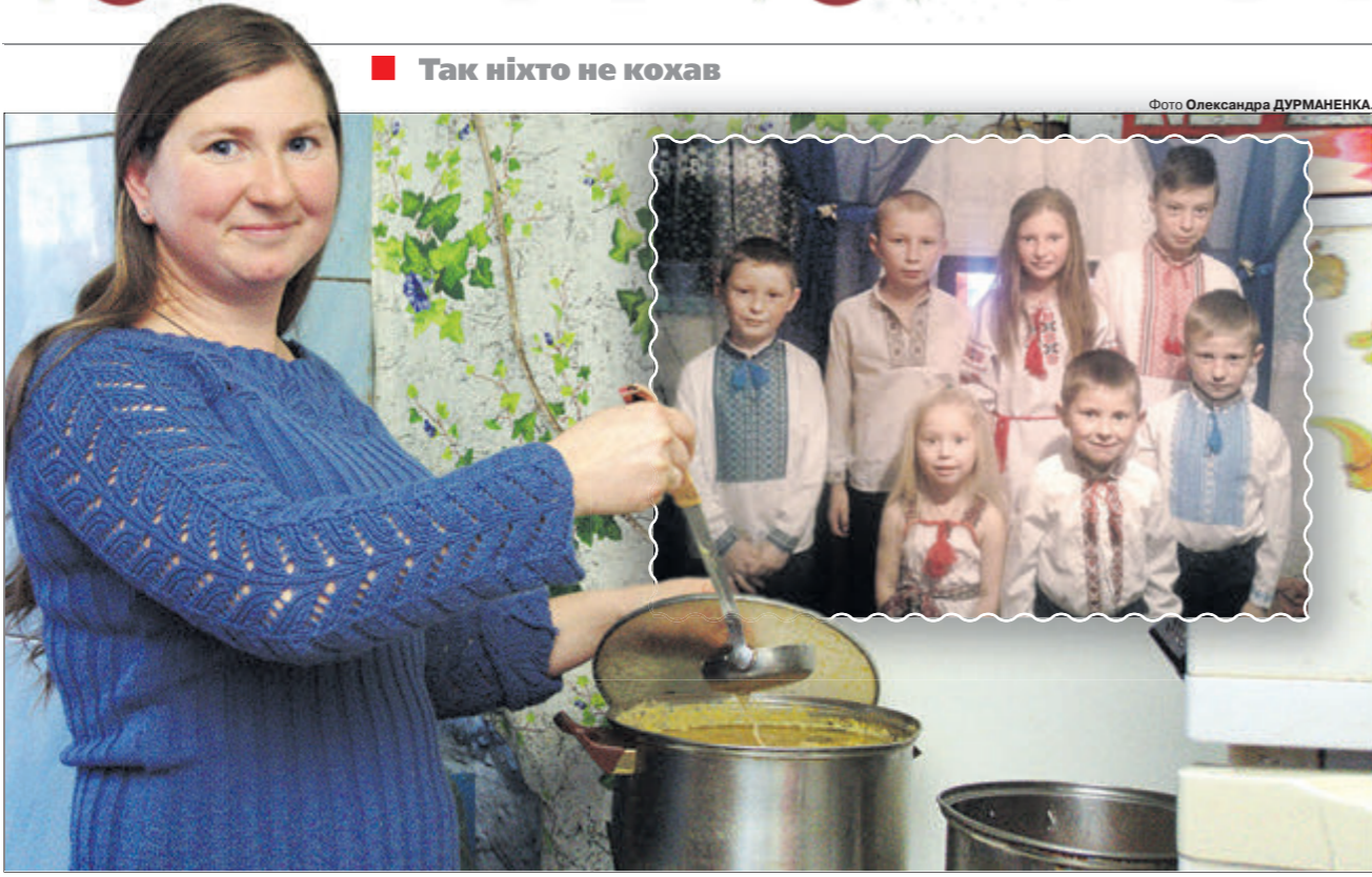
Так ніхто не кохав