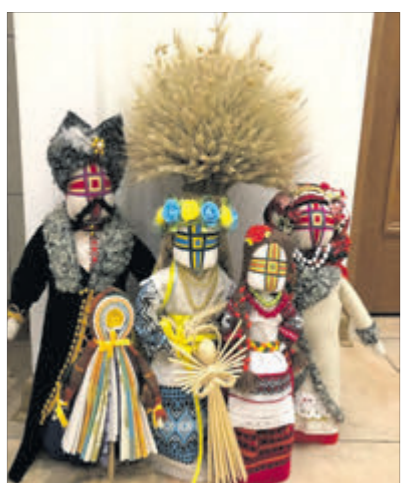
Вироби народних майстрів.

Проект «СВОЇ» відбувається завдяки підтримці благодійного фонду Сергія Мартиняка. ■