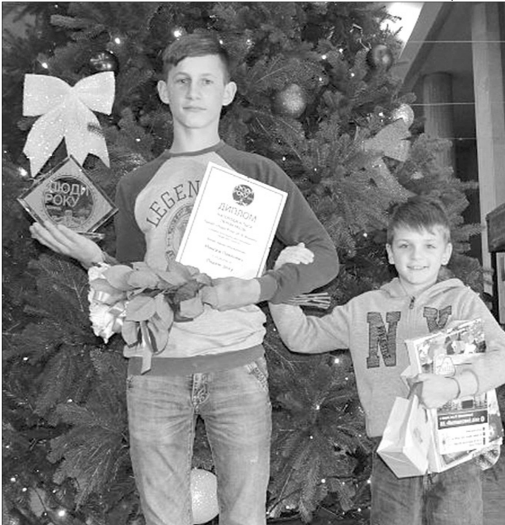
Переможець у номінації «Подвиг року» і його тезка, якого врятував.