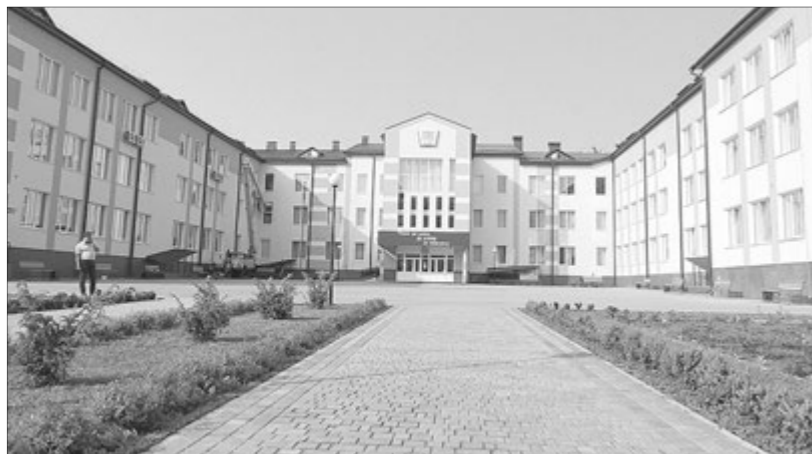
Ошатний ліцей ще торік був довгобудом.