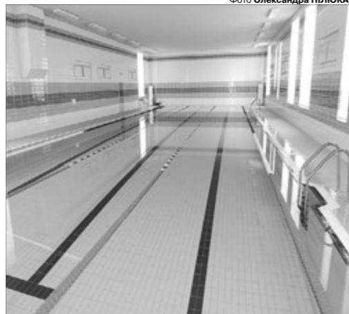
Дитяча радість — сучасний басейн.