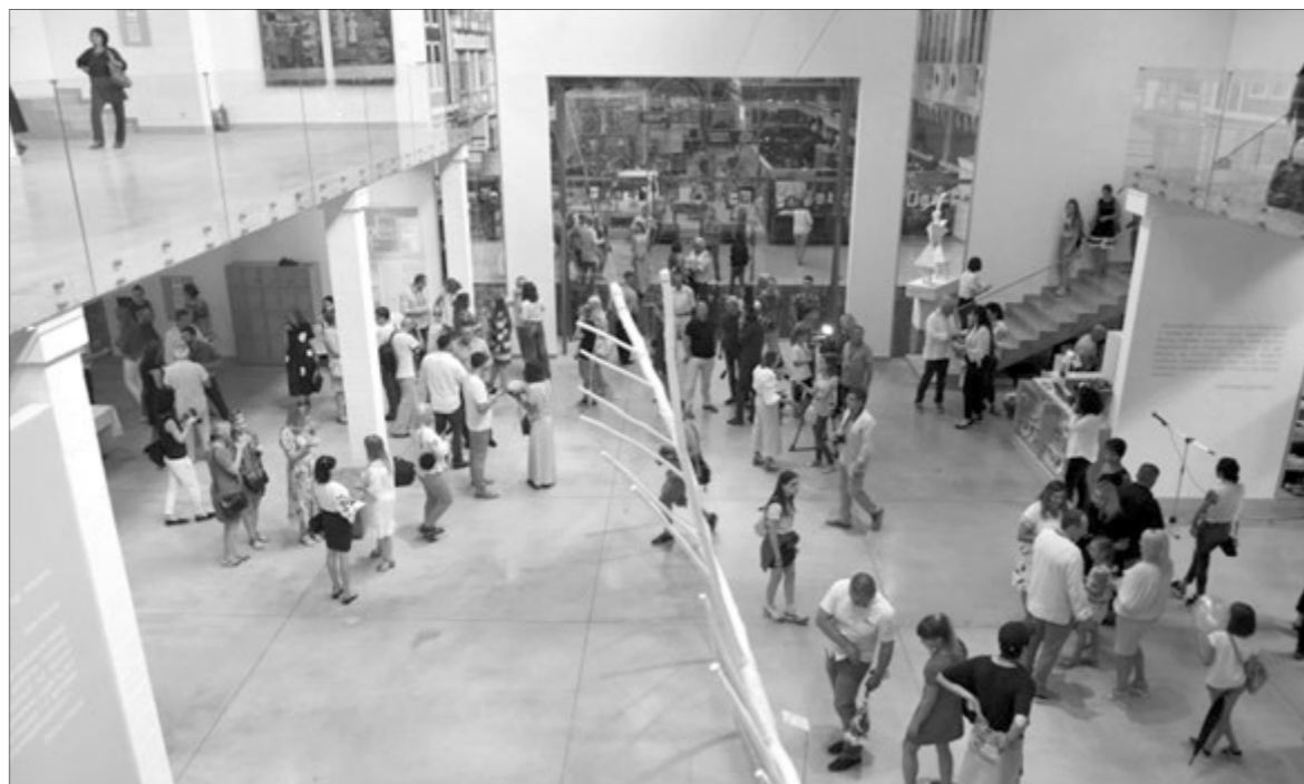
Музей працює на території колишнього заводу (загальна площа 5 тис. кв. м). У ньому представлено понад 800 творів мистецтва.

— У мене емоції такі, ніби в храм заходжу. Це енергетика художників та їхньої праці... І я стаю інакшим. Якщо знервованій чи замученій — стає легше, якщо,