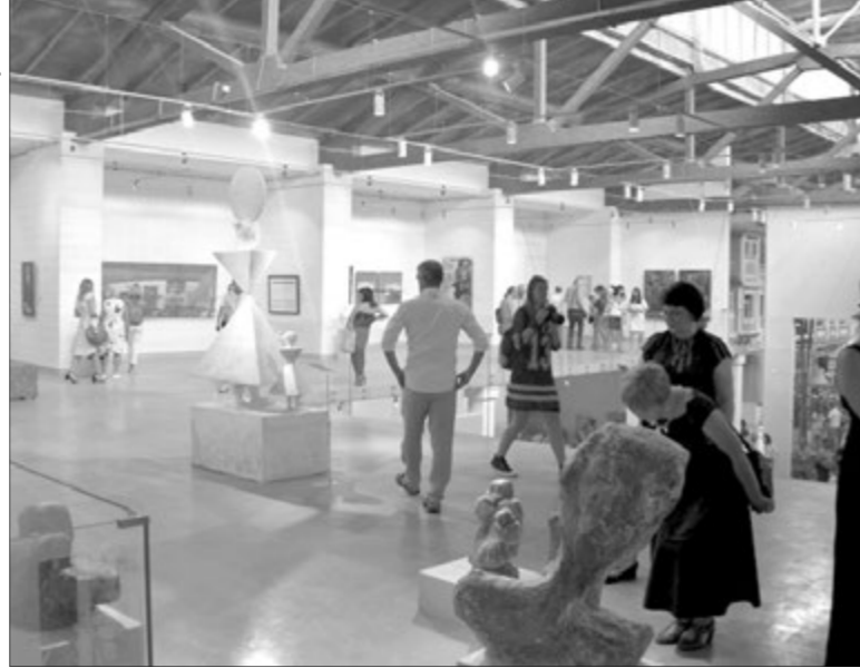
Щосереди тут можна побувати безплатно, а щопонеділка проводяться безкоштовні групові екскурсії.