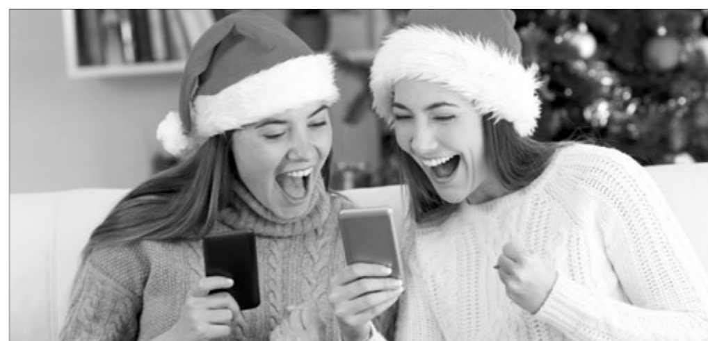
Сміливо переключайте свої смартфони у 4G-режим та насолоджуйтеся дійсно швидкісним мобільним інтернетом.

Почавши працювати в 4G-мережі, краще переключитись на безлімітний мобільний інтернет у 4G-мережі без додаткової плати.