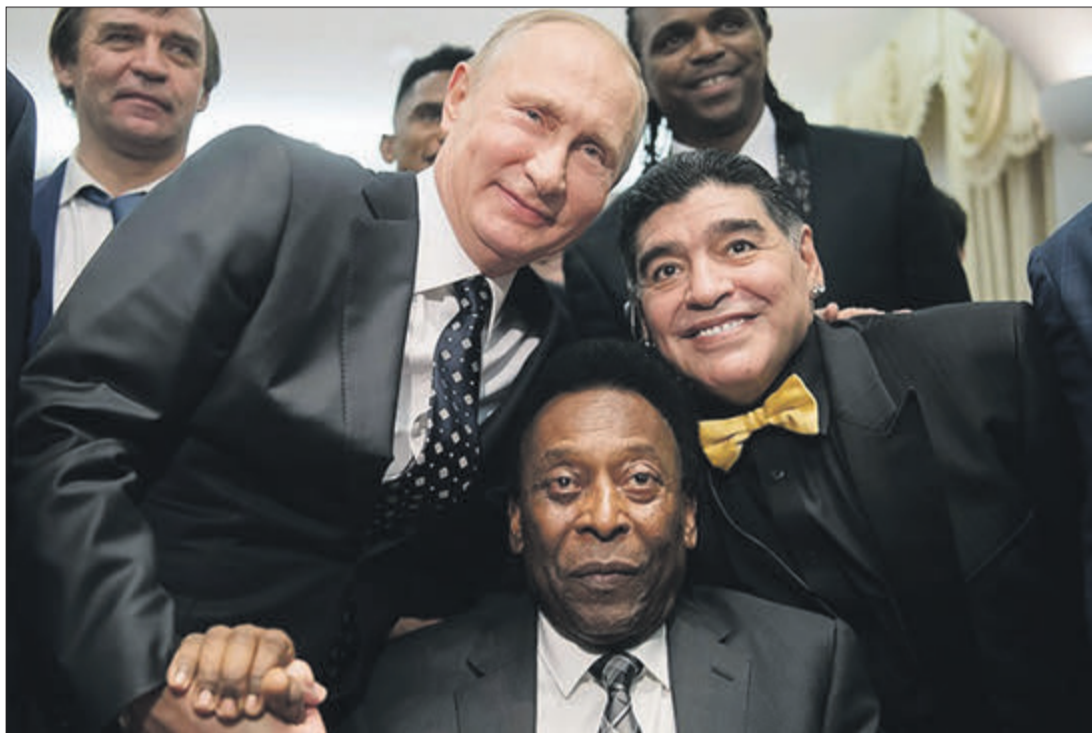
Що їм наші сльози?

Тож участь Росії в зимовій Олімпіаді-2018 у південнокорейському Пхьончхані досі лишається під величезним питанням. Говорять або про повну дискваліфікацію російської збірної, або ж про участь у змаганнях лише окремих «чистих» спортсменів під нейтральним прапором. А за кілька місяців ця країна прийматиме Мундіаль?! До речі, кажуть, що вживали допінг не лише біатлоністи, а й гравці національної збірної Росії з футболу... ■