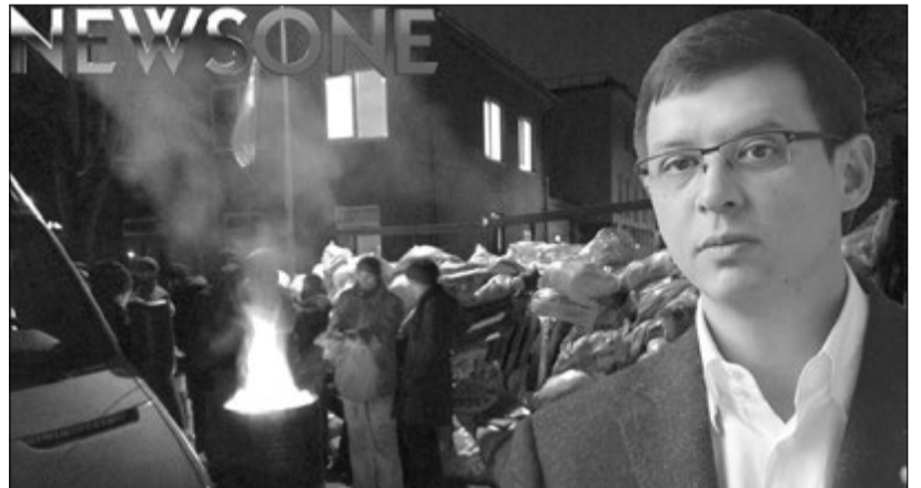
Барикади біля «свого» телеканалу Євген Мураєв вважає на незалежний ЗМІ.

На захист «NewsOne» став також Міхеїл Саакашвілі. Він відкидає звинувачення в тому, що, підтримуючи