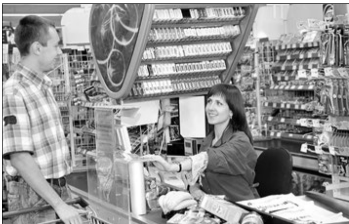
Зараз у корпорації «АТБ» працює понад 50 тисяч осіб.