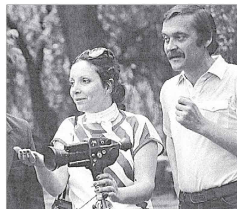
Французька режисерка, зачудована українською природою та людьми, багато фільмувала на камеру.

«На багатолудній вулиці Нью-Йорка розгублена бідно вдягнута жінка з розпущеним волоссям когось шукає. Її погляд порожній, вона постійно повторює незрозумілі слова: «Моє дитя... моє дитя... Ясику... Ясику...»