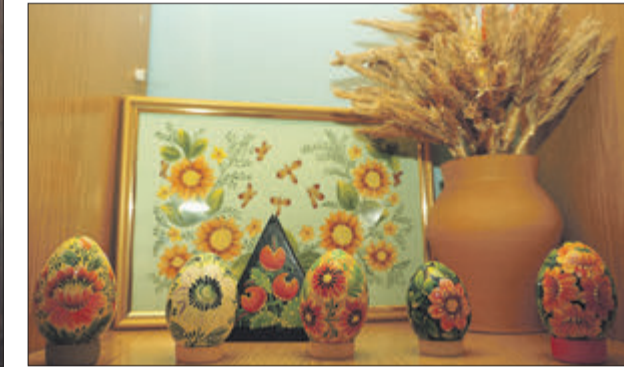
Великодні яйця-мальованки – справжнє рукотворне диво.

можна знайти хіба що у приватних колекціях чи музеях.