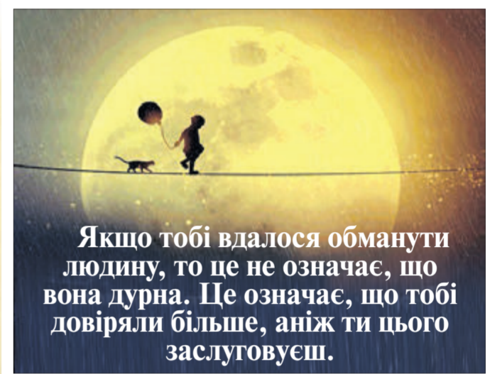
Якщо тобі вдалося обманути людину, то це не означає, що вона дурна. Це означає, що тобі довіряли більше, ніж ти цього заслуговуєш.