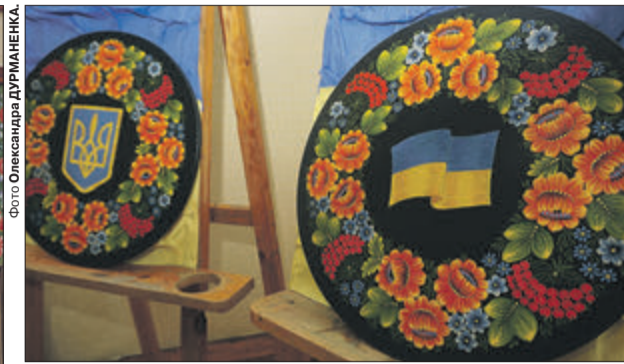
Тарелі майстрині у техніці петриківського розпису неодноразово демонструвались на виставках.