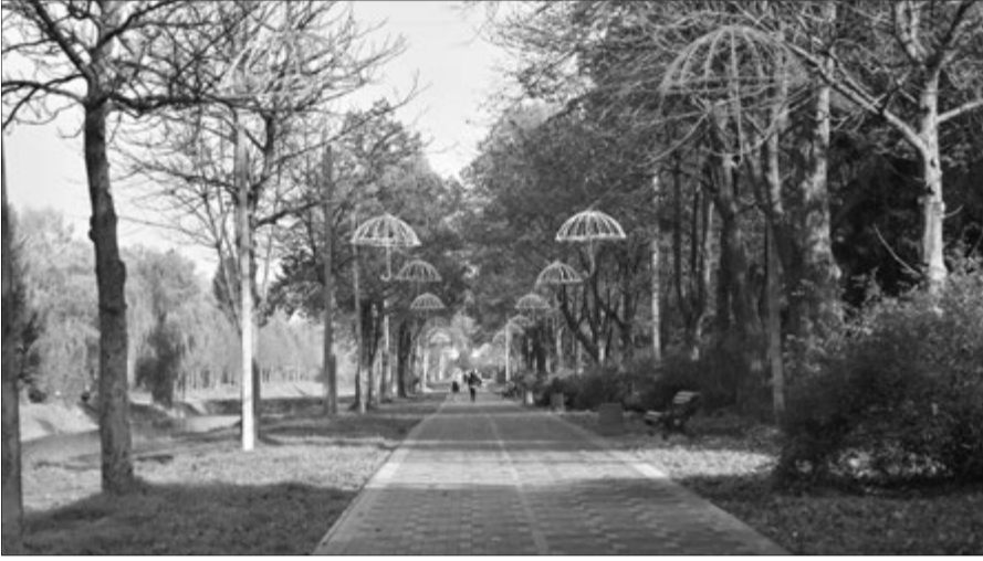
Алея парасольок – ще одна «родзинка» місця відпочинку.