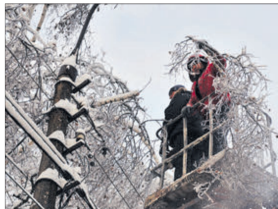
Енергетикам у ці дні роботи додалося.