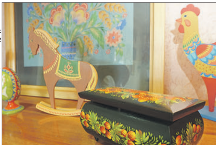
Вироби майстрині є окрасою приватних колекцій.

Майстриня робить усе, як каже, для себе. З кожним виробом зріднилася душею. Тож продавати шкода. Її роботи — як дерев'яні народні іграшки, так і різноманітні шкатулки, тарелі, великодні яйця-малюванки, настінні панно — можна побачити на виставках, у приватних колекціях в Україні й за кордоном, а також у близьких серцю людей. Їм роздаровує з радістю. До речі, петриківський розпис локачанки дещо відрізняється від звичного. Відтворюю-