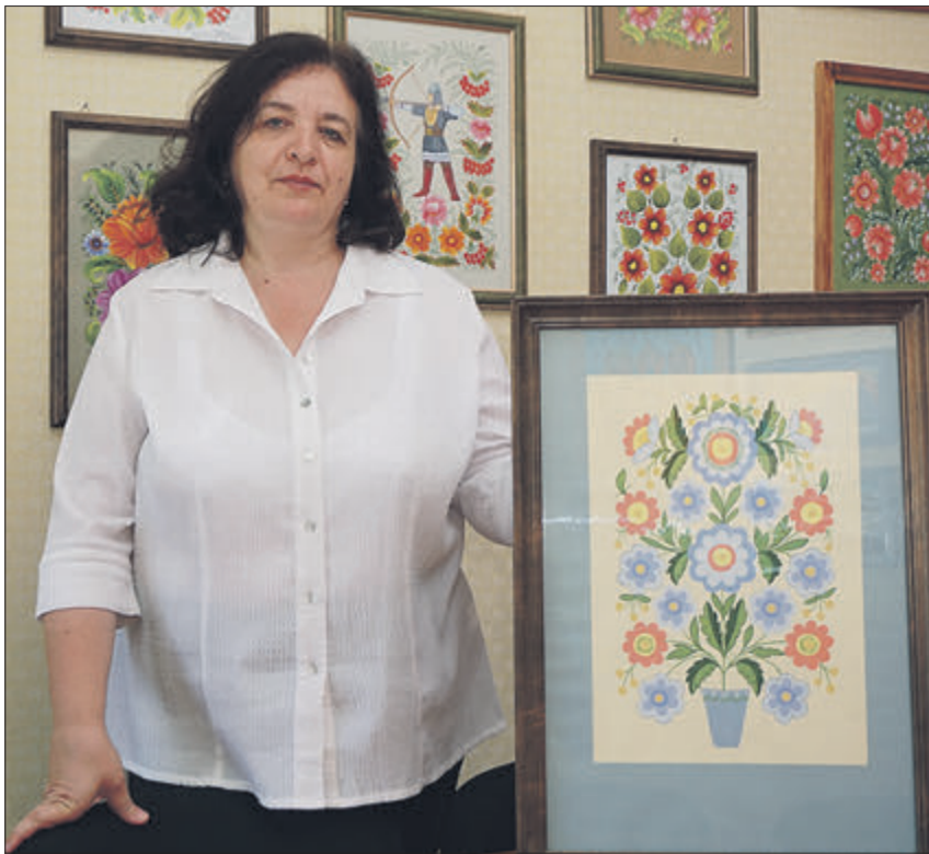
Колись у селах розписували печі квітами, як на цьому панно.