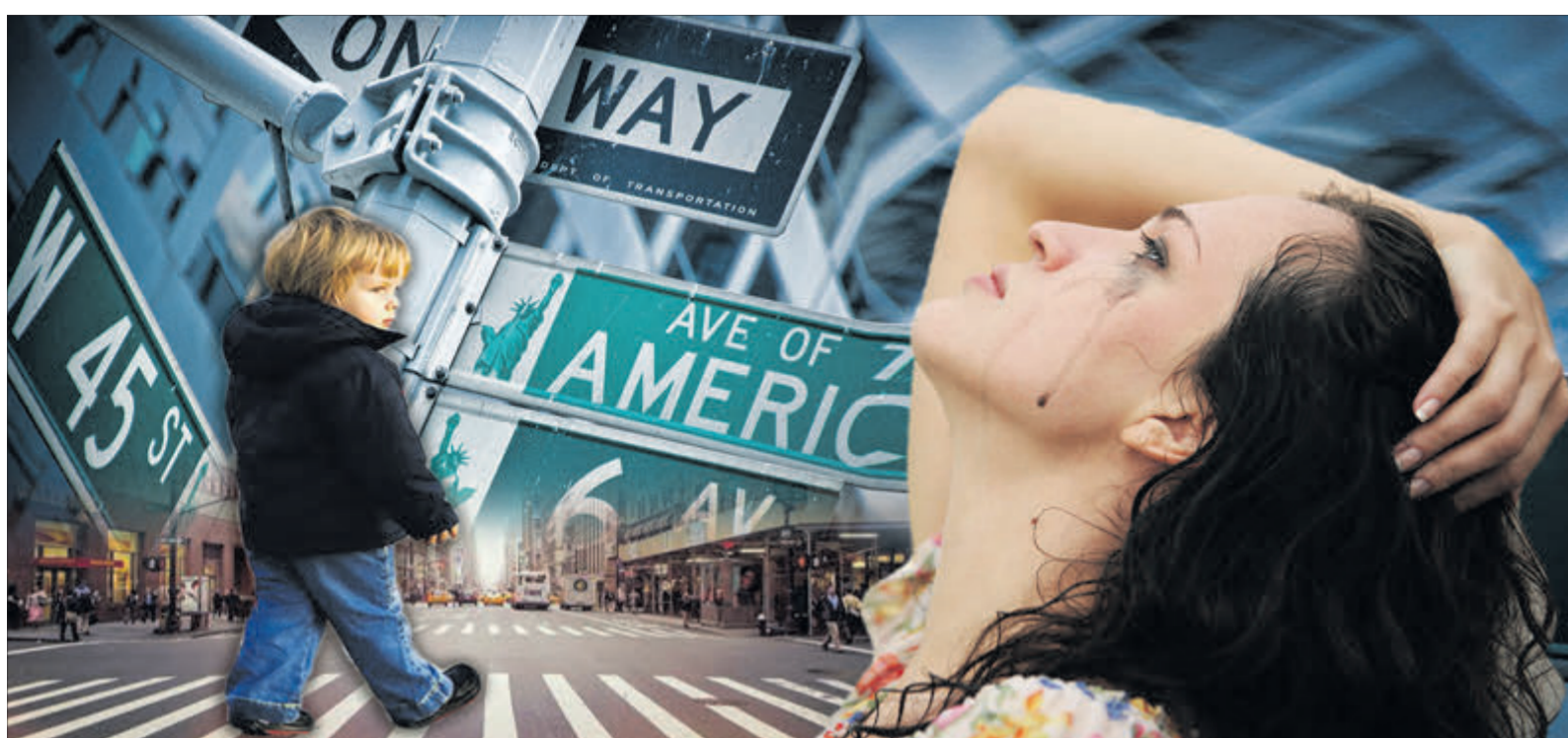
Лише через роки всі дізналися про причину материнського болю.