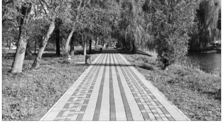
Оновленими доріжками можна прогулятися і на підборах.