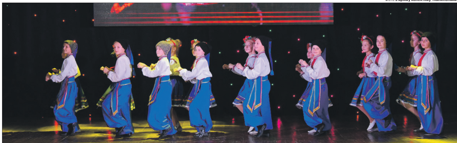
Запальні танці цього колективу бачили глядачі всієї України.