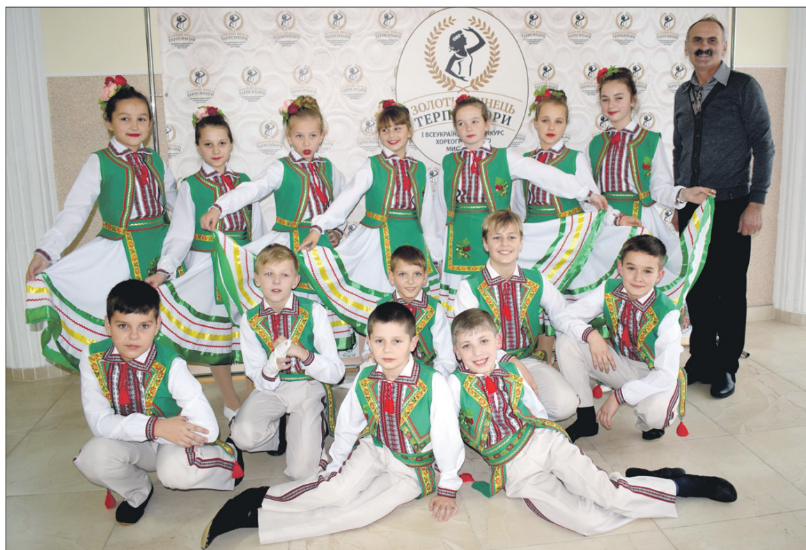
Учасники запевняють, що не підведуть учителя і тих, хто в них вірить.

Вже звикли мандрувати Україною та щоразу підкорювати нові вершини. Не одну пару взуття стоптали ніжки юних танцюристів, виростають й зі сценічних костюмів,