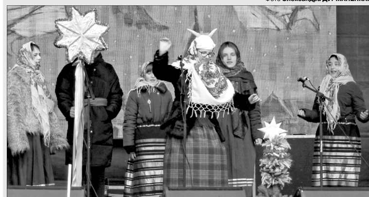
Так уже та Кізенька витанцювала.

«Програма свята передбачала не лише виконання колядок і щедрівок, а й різноманітні майстер-класи, розваги та частування, тож сумно не було нікому.»