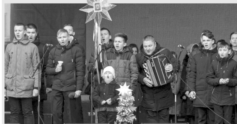
Колядка об'єднала артистів різного віку.