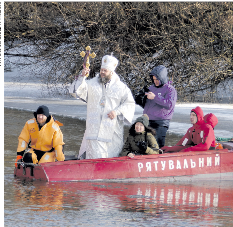
Свята вода очищає та зцілює душу і тіло.