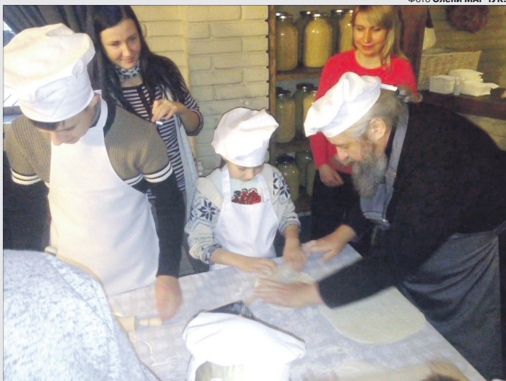
Діти показали себе вмілими кухарями.