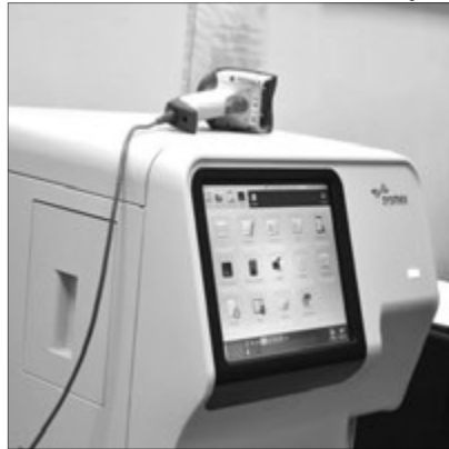
Гемоаналізатор – подарунок благодійників.