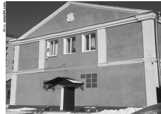
Приміщення РБК депутатів цікавить більше, ніж його працівники.

Думалося: що можуть вирішити люди, які не всі навіть знають про театр «Гармидер», Галину Конах та й з творчістю Алли Опейди не дуже знайомі, не були й