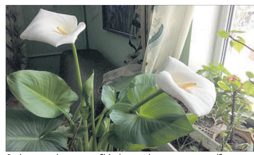
За вікном уже кінець зими, а білі квіти з-поміж зеленого серцеподібного листя все ще визирають у вікно.