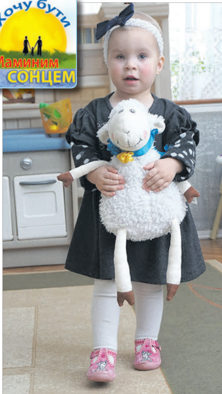
Злата чекає на Маму і Тата.