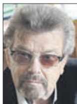
Данило ПОШТАРУК, директор — художній керівник Волинського академічного обласного театру ляльок, заслужений діяч мистецтв України (м. Луцьк):

кону — це не зовсім правильно. На жаль, нині українське суспільство демонструє розбалансованість.