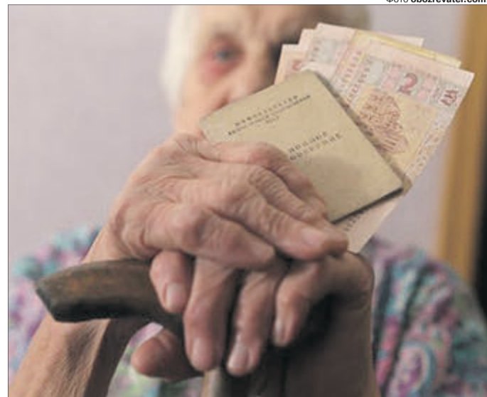
Люди поважного віку такій новині точно зрадіють.

Перераховуватимуть пенсії за формулою, затвердженою у 2017 році. Зважатимуть на стаж, за який сплачувався єдиний соціальний внесок, зарплату, що отримували пенсіонер, і середню по Україні. Зазначимо, що законом передбачено проведення щорічних перерахунків раніше призначених пенсій шляхом збільшення показника середньої зарплати в Україні. Як повідомили нам у головному управлінні Пенсійного фонду в області, у 2019—2020 роках він збільшуватиметься на коефіцієнт, що відповідатиме 50% показника зростання споживчих цін і 50% середньої заробітної плати за попередній рік. Суть змін у тому, що при проведенні березневого перерахунку показник середньої зарплати в Україні, який враховується для обчислення виплат, — 3 764,40 гривні збільшиться з урахуванням показника 1,17 і становитиме 4 404,35 гривні (3 764,40 x 1,17). Для кожного пенсіонера розмір підвищення буде різним, але не нижчим 100 гривень, якщо не досягатиме, доплатять до цієї суми. Він визначатиметься в автоматизованому режимі залежно від тривалості страхового стажу та індивідуального коефіцієнта заробітної плати, з якого проводиться обчислення пенсії.