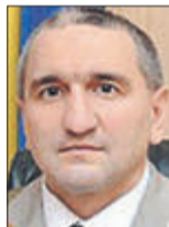
Ігор ГОРДІЙЧУК, Герой України, генерал-майор, начальник Київського військового ліцею імені Івана Богуна (м. Київ):

— Питання дуже цікаве і неоднозначне. З одного боку, люди повинні мати можливість вибору, бути вільними — і тут примусом нічого доброго не зробиш. А з іншого, думаю, потрібно ввести такі закони, які стосуватимуться тих, хто хоче представляти Україну на міжнародній арені — чи музичній, чи спортивній. Кожен вибирає сам, де йому більше подобається, і з цього не варто робити проблему. Тобто планує людина виступати в Росії — будь ласка, але тоді назад не повертайся. Або принаймні не будь «обличчям» нашої країни.