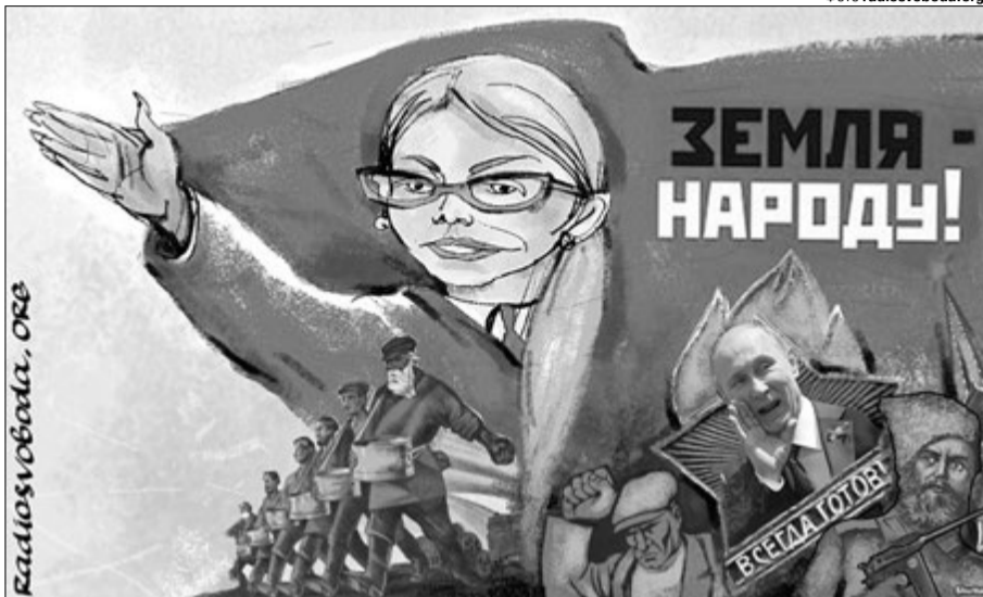
А так обіцяє, так обіцяє...

Та найцікавіше і найганебніше навіть не це. Як повідомляють деякі ЗМІ, посилаються на власні джерела, всю цю схему СБУ накрила у рамках