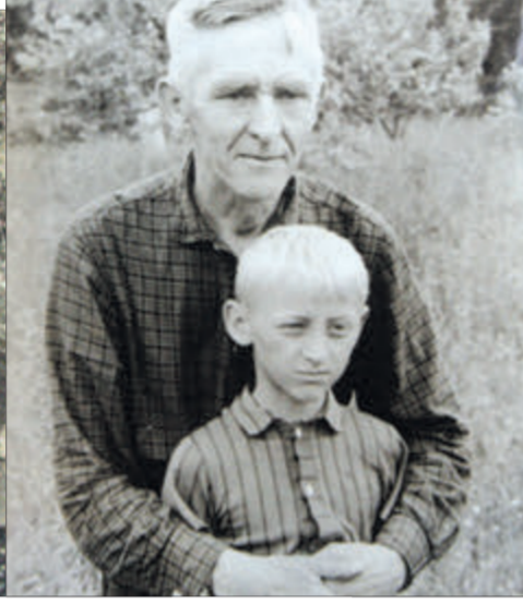
Батько із сином.