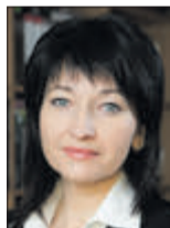
Ірина КОНСТАНКЕВИЧ, народний депутат України від партії УКРОП (м. Луцьк):

— Україна — демократична країна, й заборонити «ватникам» на законодавчому рівні виступати десь у Росії наш парламент не може, й не потрібно цього робити. Хочеш — співай чи танцюй, але від себе, а не від імені всієї держави. Тому такі діячі не повинні представляти інтереси України на міжнародній арені в різних творчих конкурсах і фестивалях. Ми вже переконалися, що такої «вати» вистачає в мистецькому середовищі. Ці люди за гроші будуть давати концерти та співати російському агресорові.