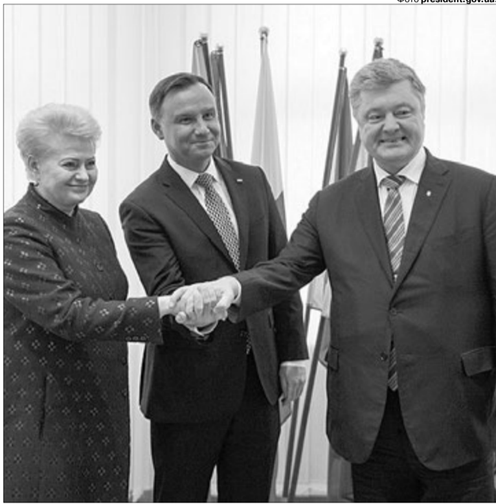
Наші друзі на шляху до цивілізованого світу: президенти Литви та Польщі Даля Грибаускайте і Анджей Дуда.

Україна якісно змінилася і консолідувала зусилля на шляху до ЄС і НАТО, визнало й керівництво Євросоюзу: на підписання конституційних змін приїхав голова Європейської Ради Дональд Туск. Уперше світовий лідер такого