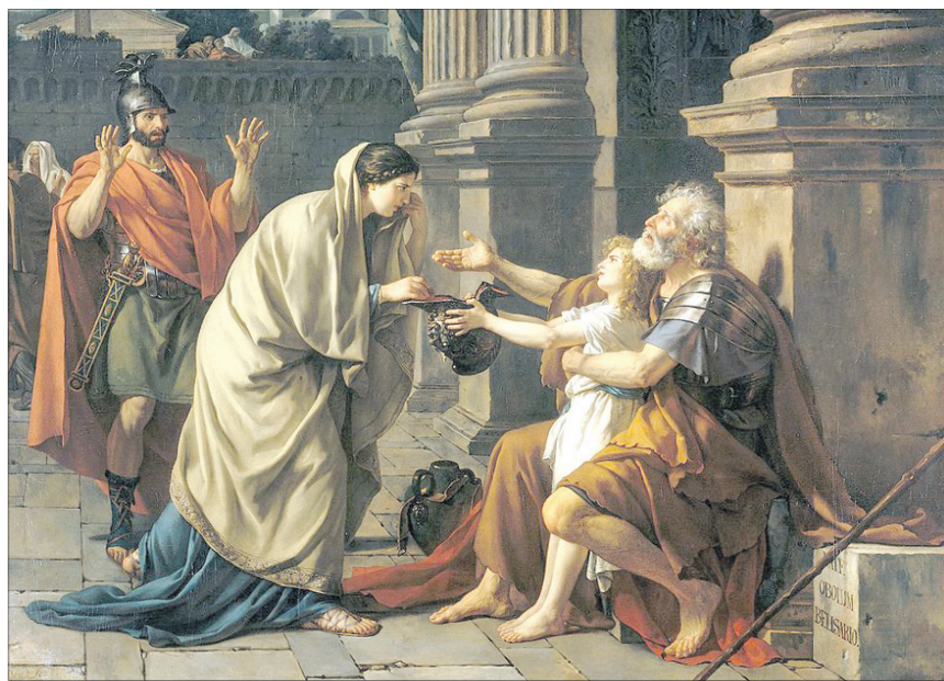
Картина художника Жак-Луї Давіда «Велізарій просить милостиню» (1781).

Його хворобливий, жалюгідний вигляд і вкрай зношений одяг не дають можливості визначити, якого він віку. Та я його знаю. Колись був поважним працівником, мав вищу освіту і пристойну роботу. Та у сім'ї зловживали горілкою. І як результат — уже нема ні сім'ї, ні житла, ні друзів... Цілорічно жебракує і за ті кошти живе. Ні дощі, ні сніги й вітри його не лякають. Люди переважно байдуже проходять повз нещасного. Дехто зупиняється і шукає дрібні купюри, за що він ледь чутним голосом дякує. Раптом із натовпу вибігає дівча, витягує гарнесенький гаманець і кладе з нього в целофановий пакет згорнуті гривні. Зупиняю дитину, знайомимось і запитую, навіщо вона повернулася і віддала гроші,