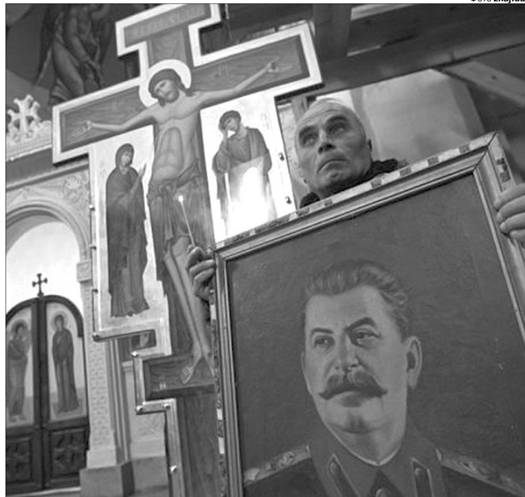
Ще й нині для багатьох українців Йосиф Віссаріонович — святий.

А відчуваю, що він не розуміє українців. І навіть не любить. Коли «95 квартал» та їхній шеф жартують над нашими заробітчанами, над мовою, Томосом, Майданом, то у мене нема враження, що українці сміються над собою, а є неприємне відчуття, що над нами насміхаються. Зеленський видається мені малоросом, який ледь приховує своє роздратування нашою мовою і всіма цими майданами, які закрили йому дорогу до російських грошей. Це молодий прилакований Янукович.