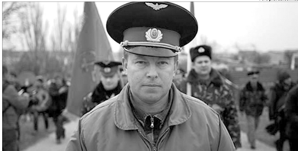
Похід беззбройної колони на російський спецназ у 2014 році льотчик досі пам'ятає в деталях.