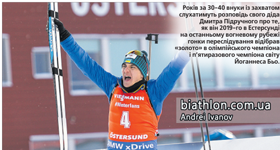
Років за 30-40 внуки із захватом слухатимуть розповідь свого діда Дмитра Підручного про те, як він 2019-го в Естерсунді на останньому вогневому рубежі гонки переслідування відібрав «золото» в олімпійського чемпіона і п'ятиразового чемпіона світу Йоганнеса Бьо.

Уперше українець (українкам такі вершини підкорювалися вже не раз) стає чемпіоном світу з біатлону!!!