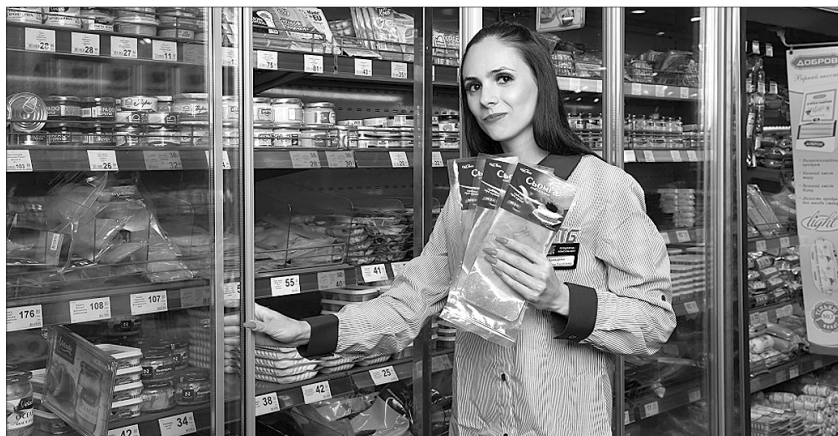
Безліч нововведень мережі «АТБ» придумані жінками для жінок.

За її словами, нині в компанії працюють понад 50 тисяч співробітників. Це дійсно вагомий показник, який можна порівняти, наприклад, із населенням великого районного центру. З кожним працівником проводиться робота, що передбачає навчання, розвиток, професійне зростання. І якщо за підсумками всіх цих процесів людина покаже позитивні результати, то вона може досягти будь-яких кар'єрних успіхів. Приміром, прийти в магазин звичайним касиром, а згодом стати топ-менеджером на регіональному або навіть національному рівні. В «АТБ» таких історій успіху безліч. Причому більшу частину з них можуть розповісти саме жінки: вчорашні студентки, які очолили величезні колективи; матері, що вирішили підзаробити після декрету, а потім, посту-