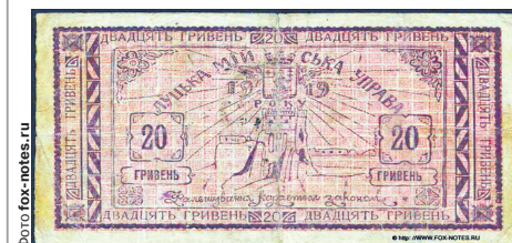
Такими грішми розраховувалися в Луцьку в 1919 році.

Гривні мали бути в обігу до 1 січня 1920-го. «Згідно постанови Мійської думи від 11 Березня 1919 р. останній строк дійсності знака 1 січня 1920 року», — зазначено на купюрах. Увесь 1919-й ними користувалися нарівні з грішми Центральної ради та гетьмана Скоропадського. ■