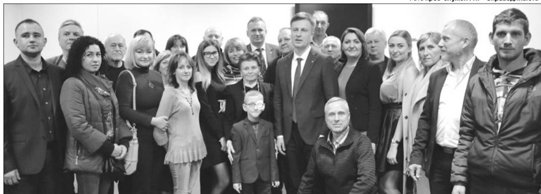
Волинські прихильники політика впевнені, що це світлина з майбутнім Президентом.

на агресора, щоб вивів свої війська і спецслужби з українських територій», — заявив кандидат. Він вважає, що сприяти деокупації має комплекс заходів, серед яких — технічне переоснащення війська, запуск на повну потужність підприємств оборонної промисловос-