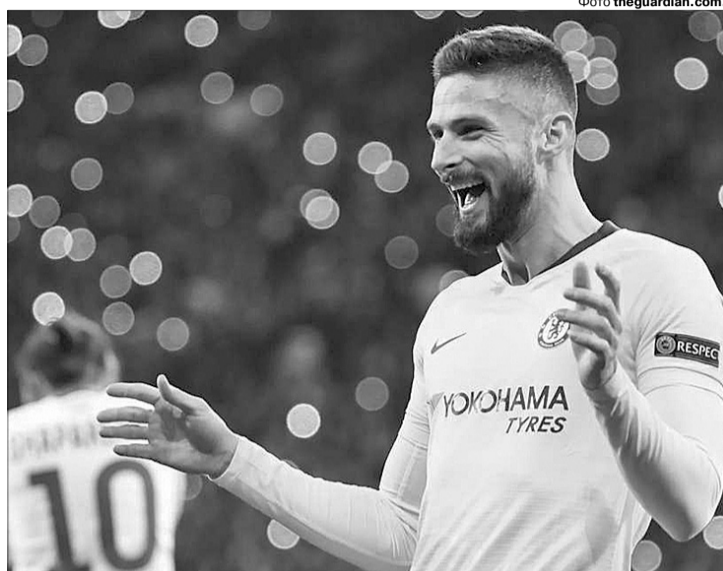
Олів'є Жиру зробив у Києві хет-трик, забивши утрічі більше, ніж у 20 матчах англійської Прем'єр-ліги.

Проте цей рахунок — як і осінні 0:9 у двох поєдинках «Шахтаря» з «Манчестер Сіті» — на невеселі роздуми такі наштовхує. Український футбол дедалі відчутніше віддається від нині еталонних зразків гри, які можемо спо-