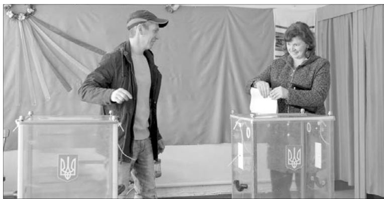
Дільниця у цьому селі розмістилася в приміщенні колишньої школи.

Перший виборець прийшов на дільницю ще о 7-й годині. Чоловікові довелося чекати, поки згідно із законом розпочнуться процедури голосування. Найбільша активність була зранку. На 15-ту годину, коли ми завітали в село, свій громадянський обов'язок виконали майже 50 відсотків виборців — 107 мешканців. Четверо місцевих жителів старшого віку зробили свій вибір удома. В них зі скринькою побували