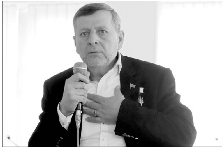
У Криму чимало гарячих сердець вболівають за Україну.

Легендарний політв'язень нагадав волинським студентам, як 5 років тому розпочиналася анексія, розповів про нинішню ситуацію на окупованому півострові, про репресії та терор із боку російської влади, адже він сам провів у неволі майже три роки. Ахтем Чийгоз пояснив та обгрунтував свій вибір: тільки Петро Порошенко, який ніколи не піде на поступки Москві й не стане на коліна перед ворогом