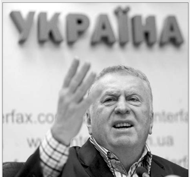
Володимиру Вольфовичу, виявляється, близькі не тільки анекдоти про Вовочку, а й анекдоти від Вовочки.