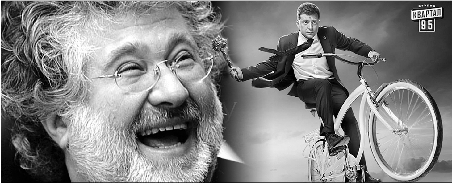
Їм смішно. А ми плакатимемо?