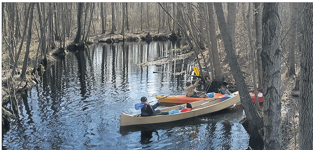
Природа Любешівщини чудова, і її треба берегти.

Уже біля пішохідного мосту, що веде до села Заріка, назбирали кілька великих