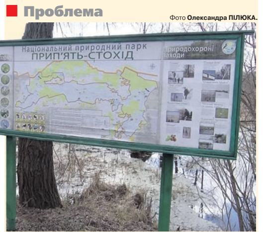
Завдання парку – оберігати багатющу природу поліського краю.