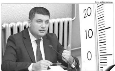
Прем'єр-міністру не сподобався розмір тарифів на тепло у Луцьку

Гривна доллечек Розмір тарифів на тепло у Луцьку розкритикував прем'єр-міністр Володимир Гройсман під час селекторної наради щодо вартості послуг із централізованого опалення і газопостачання, яка відбулась 5 березня. «До чого тут ціна газу? Що для Луцька, що для Франківська вона однакова, але у Франківську гігакалорія коштує 1312, а в Луцьку 1847 грн»