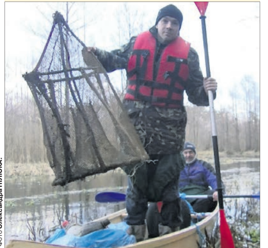
Ось такий ятір ми знайшли біля загаги!

Активісти та працівники Національного природного парку «Прип'ять–Стохід» разом із журналістами «Волині» прибирали береги річок Стохід і Бистриця