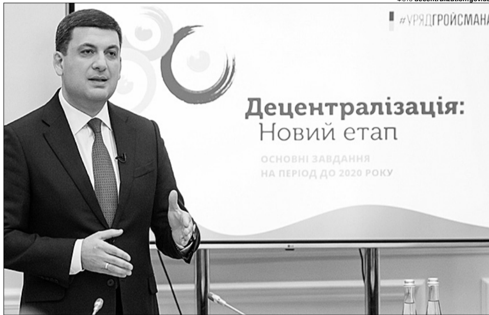
Володимир Гройсман: «Наступні кілька років стануть справжнім проривом у розвитку регіональної економіки та покращенні життя людей «на місцях»».

— У 2014-му нам пропонували федералізацію, яка б розшматовувала Україну. А ми запропонували те, що