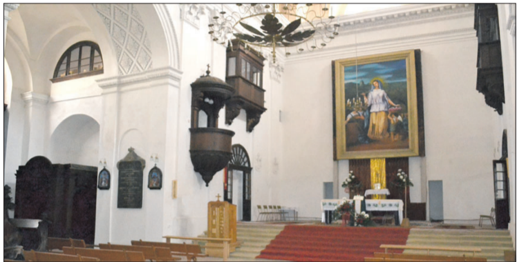
Інтер'єр храму вражає своєю пишнотою.