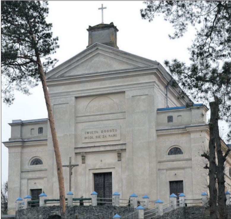
Костел названий іменем княжни Дороти, яка померла молодою.