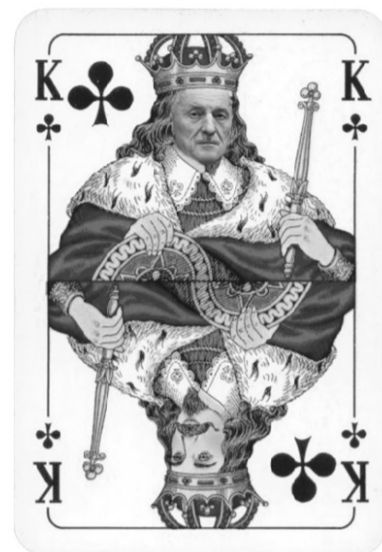
«Всю могут ВОЛИНСЬКІ королі».