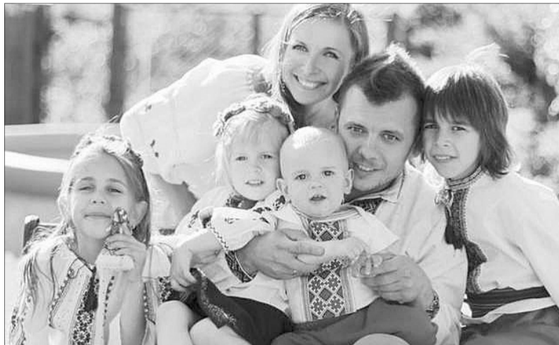
За даними Кабміну, сьогодні в Україні стоять на обліку 334 тисячі багатодітних сімей.

Виплати здійснюватимуться через Укрпошту чи уповноважений державою банк на соціальні