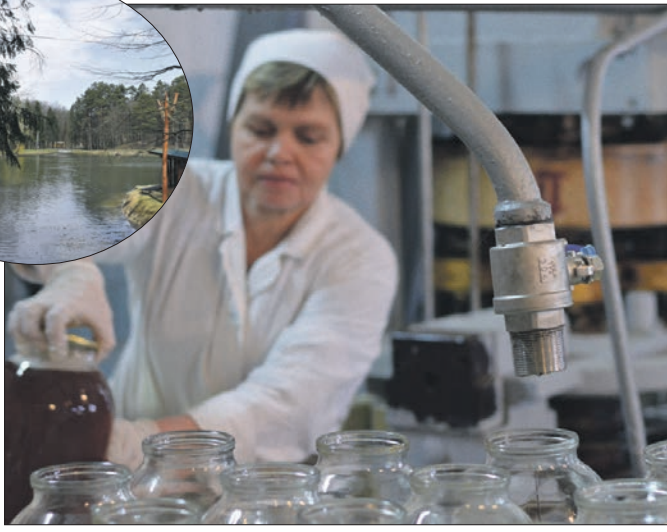
Продукцію консервного цеху ДП «Цуманське ЛГ» споживають у багатьох країнах світу.