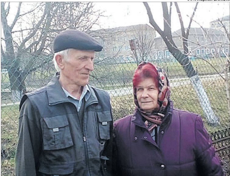
«Дай моїм батькам і в цьому році зірвати всі листки з настінного календаря» (з молитви).