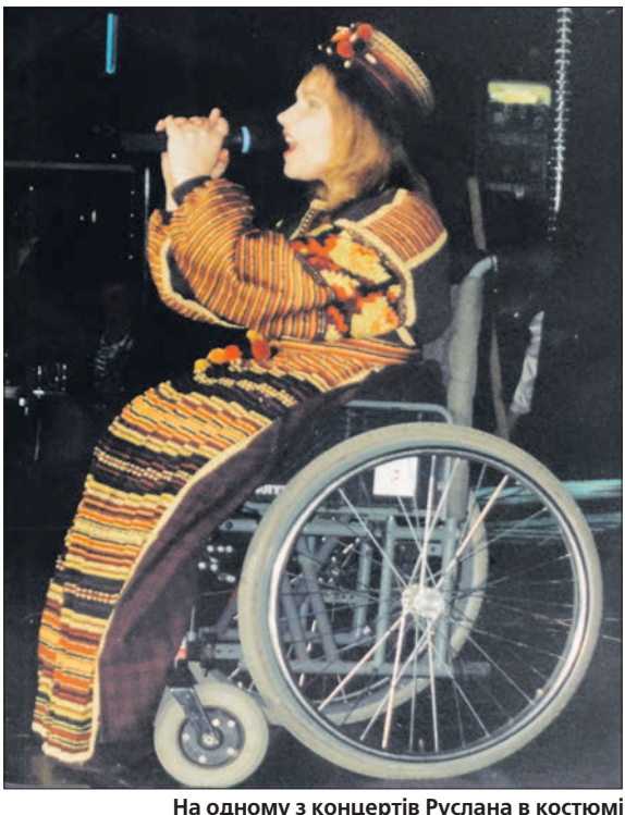
На одному з концертів Руслана в костюмі від дизайнера Роксолани Богущької.