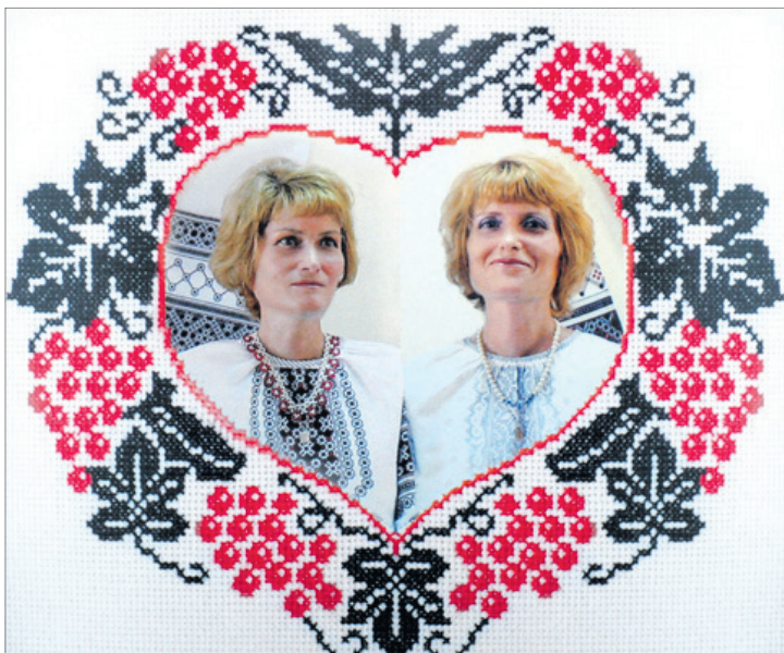
Так прожили, «немовби світлу пісню заспівали».

Пам'ятаю враження від них на виставці у Волинському краєзнавчому музеї, а тепер — торкнулася їх у кімнаті, де вони творилися, — і аж перевернулося щось усередині. Їх же вишивали руки слабкі,