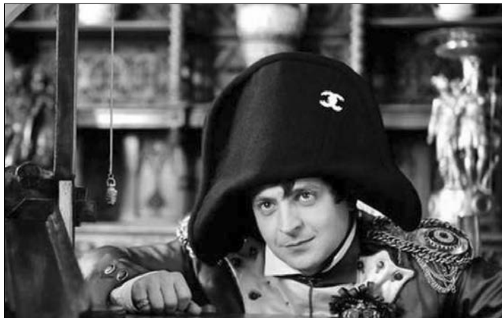
Зброю тримав тільки у фільмі, але плани — наполеонівські...

Ось, наприклад, він робить антиконституційну заяву. Говорить, що проведе референдум із приводу