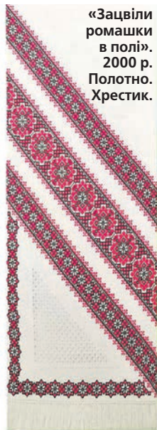
«Зацвіли ромашки в полі». 2000 р. Полотно. Хрестик.