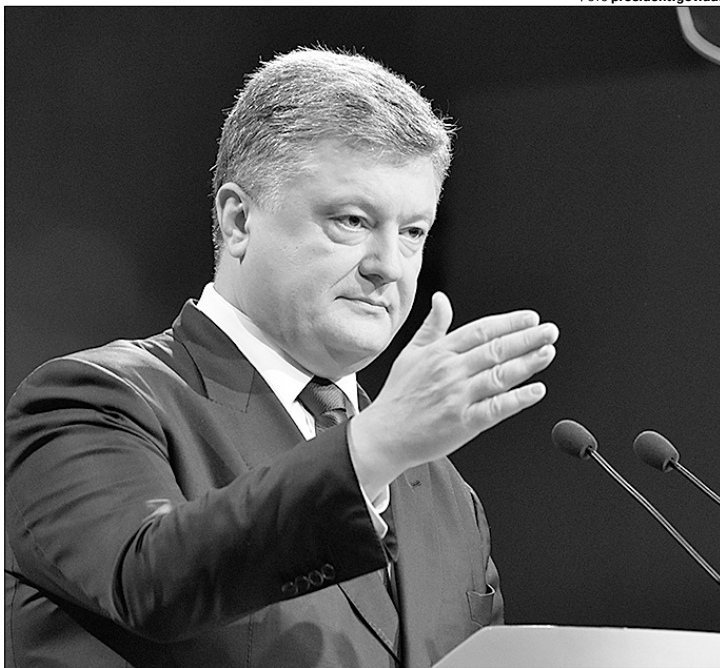
Чи скаже так Зеленський: «Прощай, немытая Россия! Ми йдемо в Європу!»

Та порівняння того ж Порошенка, при всьому критичному ставленні до нього, і його конкурента Володимира Зеленського змушує багатьох не просто поставити галочку