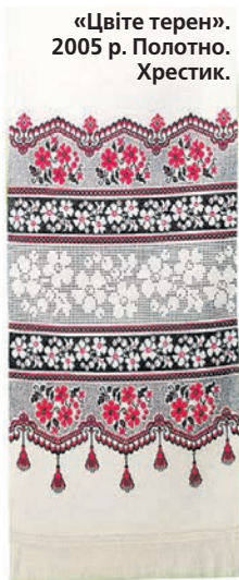
«Цвіте терен». 2005 р. Полотно. Хрестик.