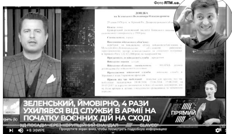
Володимир Олександрович Зеленський перебуває на військовому обліку у Кривому Розі.

Зі слів Сергія Мацейка, Володимир Зеленський кілька разів порушив закон: і тим, що не з'явився до військкомату