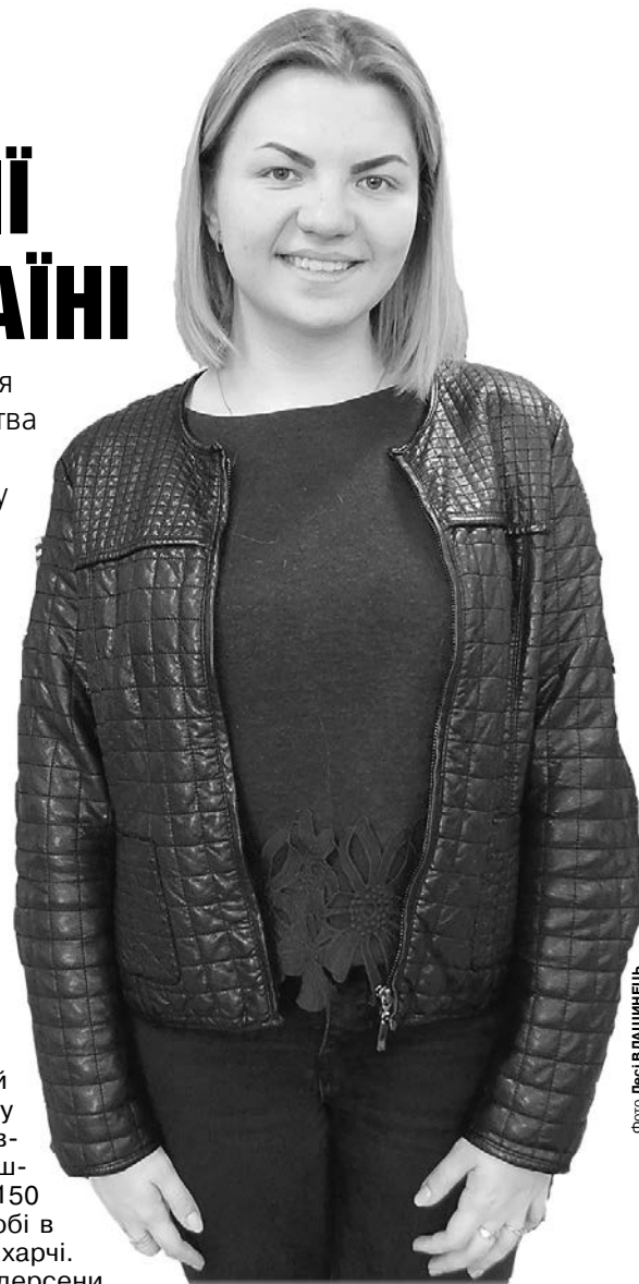
Допоможімо цій чарівній дівчинці знову стати на ноги.

Гроші можна переказувати на рахунок: 5168 7573 5313 3236 — Третьяк Алла Євгенівна. ■