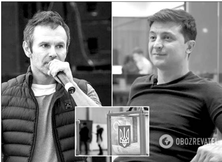
Святославу Вакарчуку не байдуже, тому він запустив хештег #ГолосуйНеПоПриколу.

А міг і на столі станцювати. Справді, 30% підтримки для комедіанта, який у серйозній політичній дискусії не може