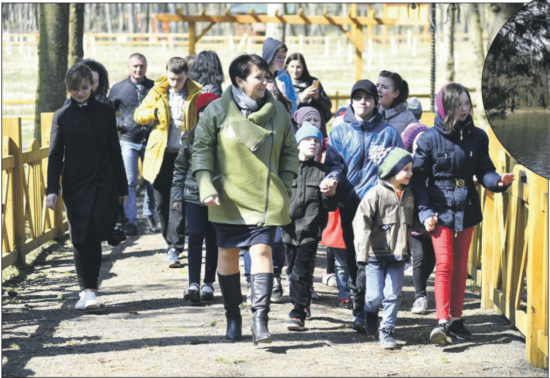
Воротнів – улюблене місце відпочинку волинян.