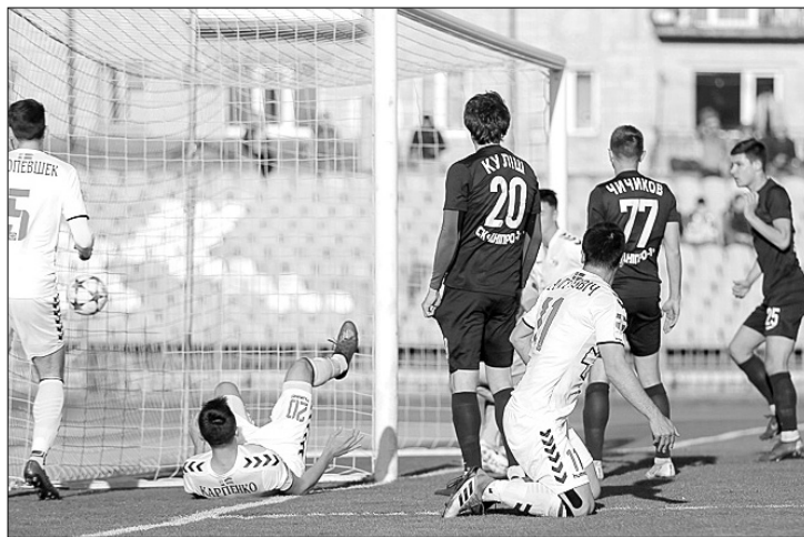
А де м'яч? У воротах СК «Дніпро-1»!

За результатами жеребкування, яке відбулось у понеділок, 7 квітня, у півфіналах Кубка України 17 квітня зустрінуться: «Інгулець» — «Зоря» і СК «Дніпро-1» — «Шахтар».