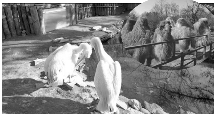
Рівненські пелікани і верблуди — це цікаво, але леви в надсучасних вольєрах луцького зоопарку викликають більший інтерес.

комунальні послуги, зросла мінімальна заробітна плата працівників, а фінансування з бюджету не збільшено. У нас навіть не було коштів, щоб виплатити зарплату за березень. А зоопарк має великі плани. Уже два роки, як ми анонсуємо побудову жирафника і завезення жирафів, але, на жаль, далі розроблення проектною документації справа не посунулася. Ми не завершили будівництво вольєра левів із новим павільйоном, є гарно промальовані аварії для птахів. На жаль, для цьо-