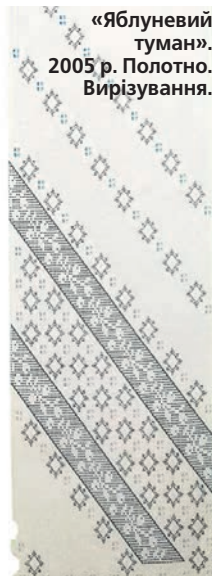
«Яблуневий туман». 2005 р. Полотно. Вирізування.