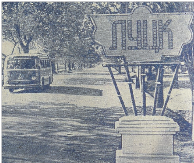
Наше місто колишнє і сучасне: автотраса «Київ—Луцьк».

Одна з версій прийшла до нас із Канади, про неї йдеться в часописі «Літопис Волині». Багатьом відоме літописне місто Перемиль, у якому княжив Данило. Але через чвари містяни розділилися на дві громади. У той час ні адміністративних, ні господарських судів ще не було, і все вирішували найавторитетніші городяни. Отож і наказали одній із непримиримих громад покинути Перемиль. Написали про право заснування нового поселення, помістили написане в засмолену діжку й пустили Стиром. Місце, до якого вона причалить, і стане їхньою домівкою. Пішли ті люди понад річку до передмістя — нинішньої Гнідави. Запитують у місцевих, чи не припливла до цього берега діжка. Ті відповідають: хлопчина тут вудив рибу і відніс її до своєї оселі. Знайшли того юнака на ймення Луцько. Тому і місто вирішили назвати Луцьком. Аби розвіяти ваші сумніви, нагадаю, що цю версію записали працівники Волинського історичного краєзнавчого музею на розкопках Перемильського замку ще далекого 1940 року. А в стародруках та і на початку минулого століття багатьох лучан називали перемильцями. Тож туристом можна бути і у своєму місті: для пізнання тут є ще багато цікавого.