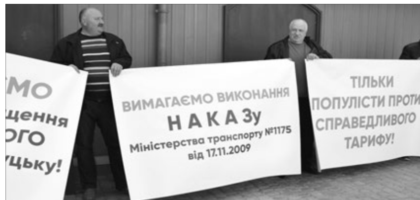
Усіх, хто прийшов на слухання, зустріли такими плакатами.

«Вимагаємо припинити знищення транспортного сполучення у Луцьку!»,