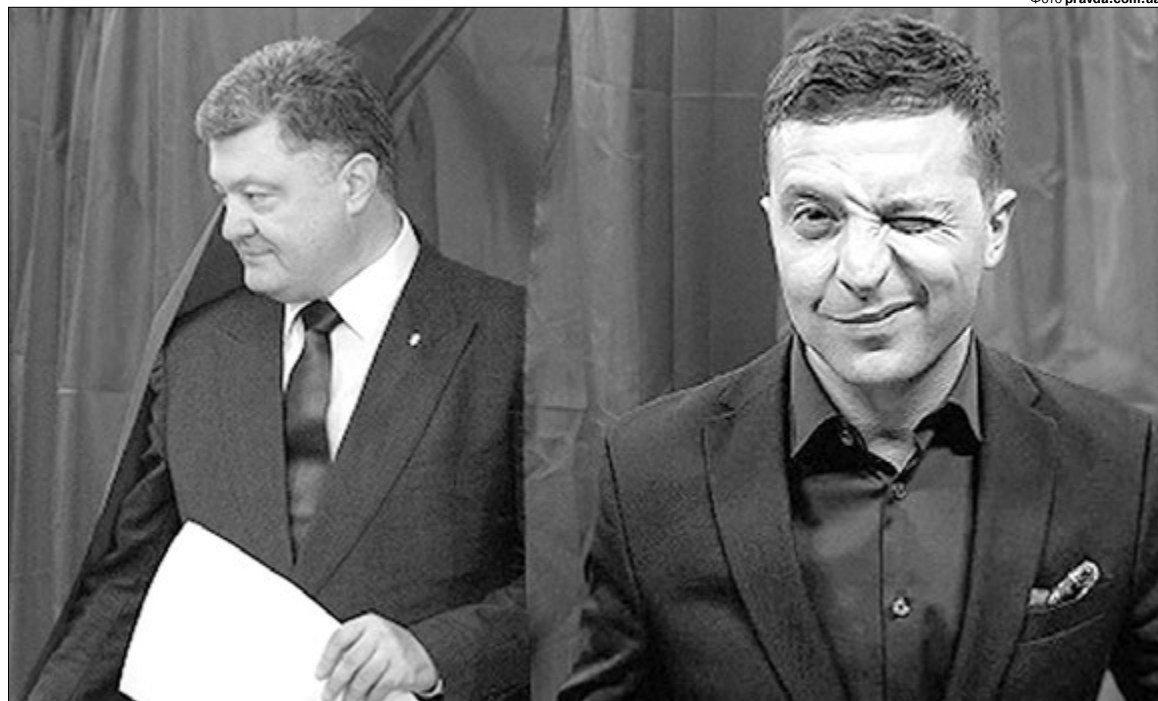
Ризикнули: зрозумілого і прогнозованого Порошенка проміняли на цілковитого новачка в політиці і управлінні державою.

Прихильники Петра Порошенка до його заслуг можуть записати і останні вибори, які були добре організованими та конкурентними. У багатьох державах колишнього СРСР, в тому числі і в Росії, де неугодних кандидатів просто не реєструють, про таке вже й не мріють. Але уваги варте й те, як Петро Порошенко прийняв свою поразку. Одряду після оголошення результатів екзит-полів він зателефонував Володимир Зеленському, привітав його з перемогою і запропонував допомогу. Це дуже важливий момент для