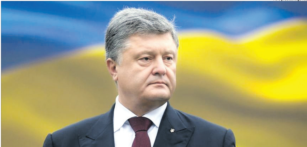
Навіть найзапекліші опоненти віддають належне бійцівським якостям «Пороха».