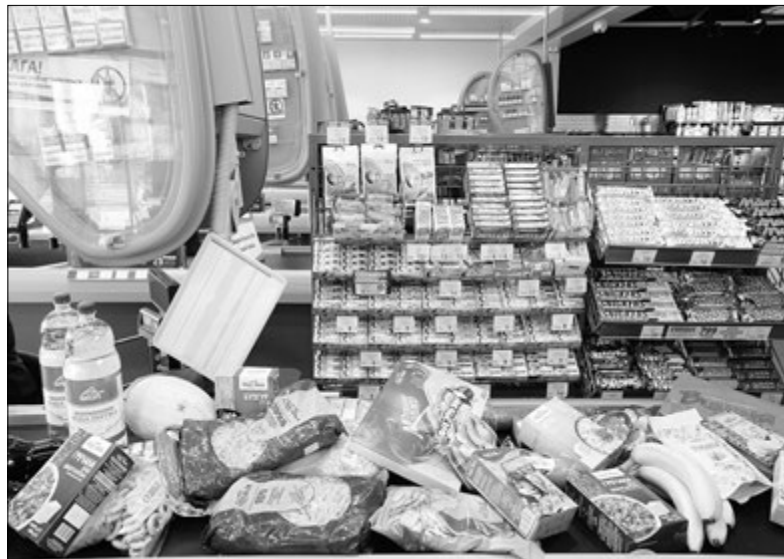
Товари в «АТБ» стовідсотково якісні і коштують дешевше.

Виробники, які співпрацюють із «АТБ-маркет», не закладають у вартість товарів величезні кошти