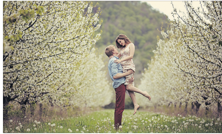
Не в тих світлинах річ. Річ у митях.

«Для кого люди зберігають тисячі митей життя, важливих лише для них? Для себе.»