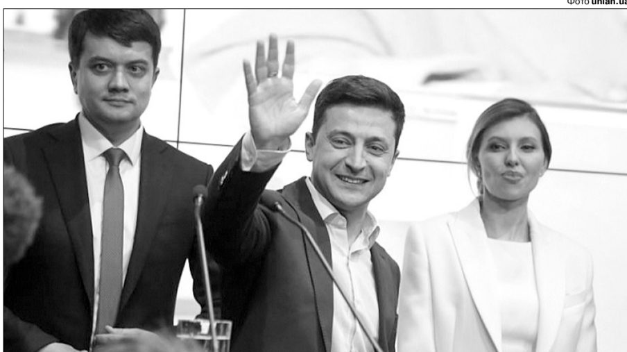
Щойно Володимир Олександрович дізнався: українці вручили йому булаву своїми 73,22% підтримки...

— Зеленський як мінімум мав би насамперед взятись за ті проблеми, які обіцяв вирішити під час виборів. У нього було кілька ключових тез (хоча ми знаємо, що вони не в компетенції Пре-