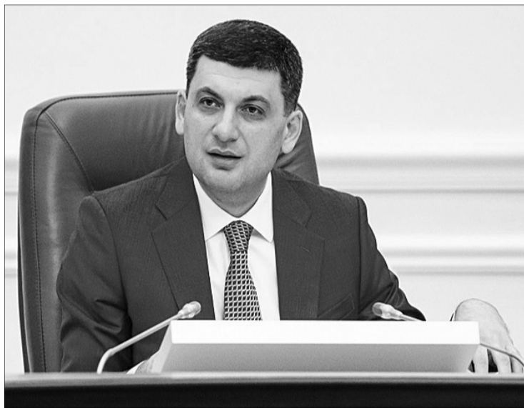
«Нафтогаз» має повідомити всім українцям, що ціна на газ із 1 травня буде нижчою за 8,55 грн/куб. м.

Прем'єр-міністр України під час засідання Кабінету Міністрів вкотре порушив одне з найбільш важливих питань для українців – вартість блакитного палива, яка на сьогодні є досить високою. Цього разу Володимир Гройсман висловив стурбованість нахабством державної компанії «Нафтогаз України», яка, умовно кажучи, просто таки «шантажує» своїх акціонерів – український народ