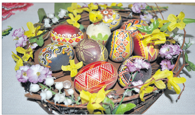
Такий кошичок — окраса святкового столу.