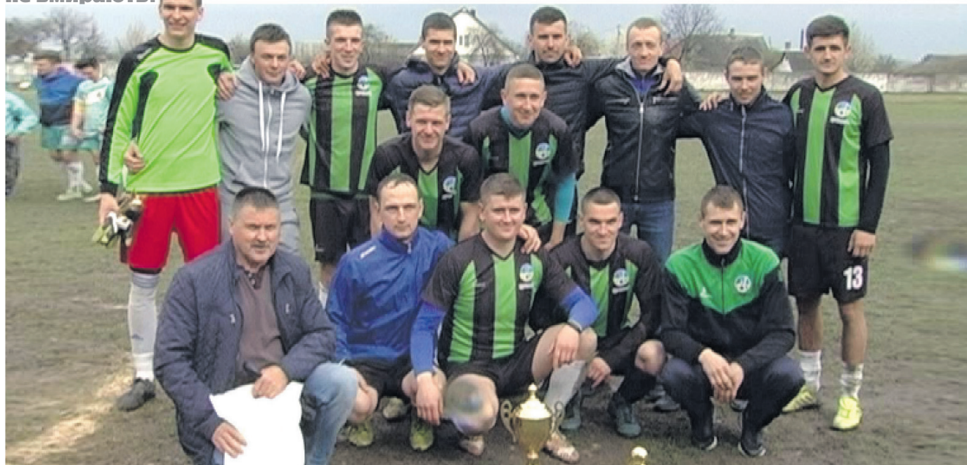
Нарешті почесний трофей здобули і цуманські футболісти.