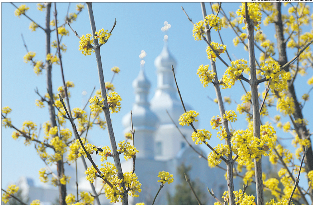
Весна в селі Ратнів Луцького району.