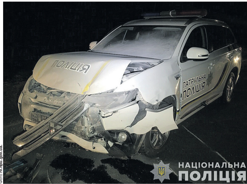
Ось на що перетворилась машина правоохоронців...