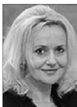
Ірина ФАРИОН , народний депутат України VII скликання (м. Львів):

Для себе під подушку хотів би якийсь «пакет» здоров'я, яке з кожним роком погіршується. А його ще треба й треба, бо відчуваю, що мені навіть з однією рукою доведеться знову воювати за Україну.