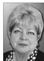
Людмила ПРИХОДЬКО , народна артистка України (м. Луцьк):

здається, найбільше зрадив би, коли б знайшов під подушкою заяву Юлії Тимошенко про припинення політичної діяльності.