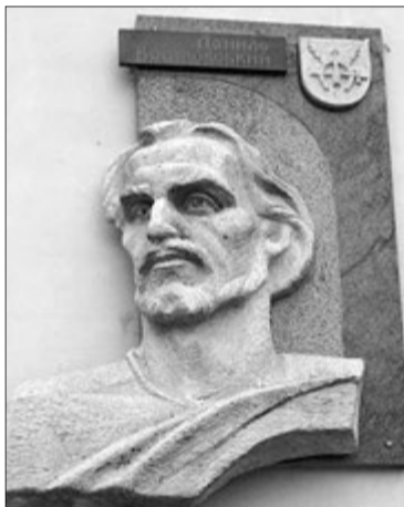
Меморіальна дошка поборнику православної віри.

Перший серйозний крок до виведення із забуття цієї неординарної особистості був зроблений до 300-річчя з дня його страти. Тоді була проведена Всеукраїнська науково-краєзнавча конференція «Данило Братковський — поет і громадянин». Далі — повне видання його творів з перекладом (вперше) на українську мову, що швидко стало всенародним, як вдячність автору за його життєву позицію. Якраз воно і потрапило до рук Братковських, які проживають у Нідерландах. Проаналізувавши своє коріння, родина прийшла до