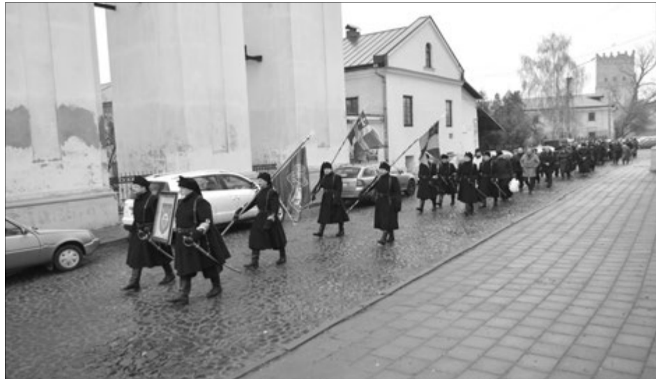
Урочиста хода від Луцького замку до місця страти героїчного братчика.