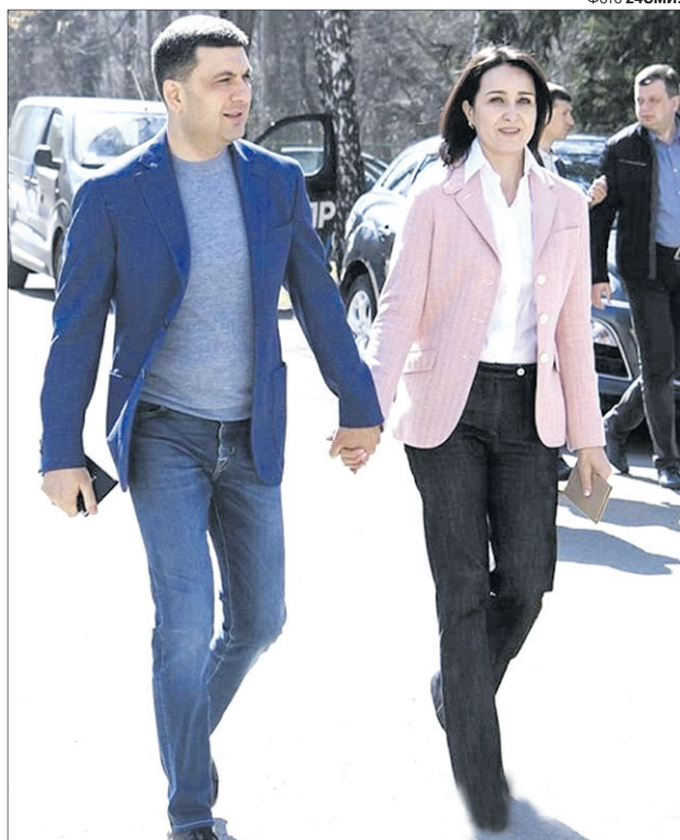
Коли прем'єр у супроводі дружини йшов на вибори, то здавалося, що він «скинув» 20 років.