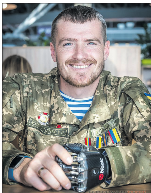
Сьогодні боєць допомагає учасникам АТО знайти себе у мирному житті.