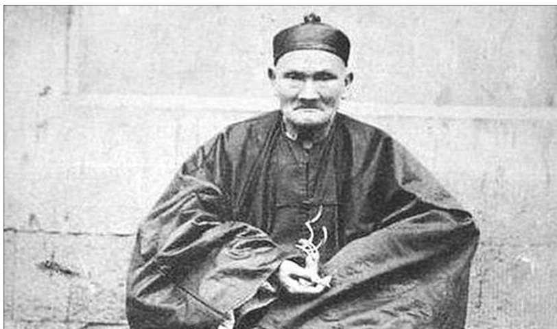
«Тримати серце слід у тиші, сидіти треба, як черепаха, ходити — бадьоро, як голуб, а спати так, як сторожовий пес».

до губернатора Сичуаня генерала Ян Сєня, який був захоплений розумом, силою і неймовірним віком земляка. Під час цього візиту була зроблена знаменита фотографія наддовгожителя.