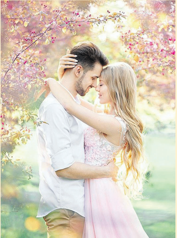
«Ми стаємо одним цілим, а чи вціліємо...»