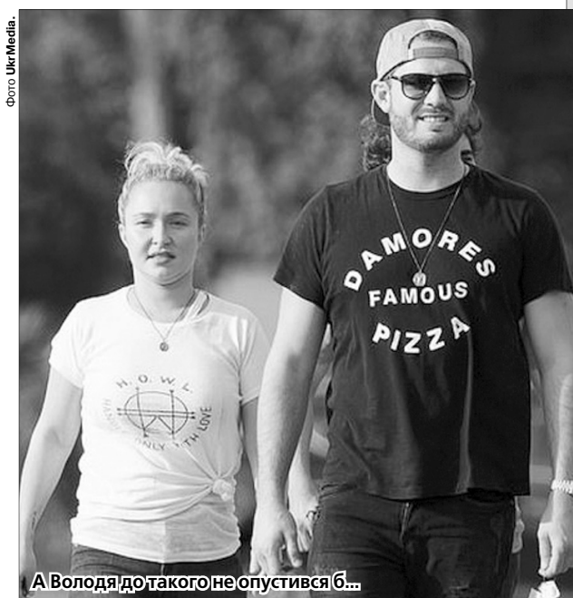
А Володя до такого не опустився б...

Нагадаємо, що після розлучення Володимира Кличка із на 13 років молодшою за нього Хайден Панеттьєрі їхня дочка