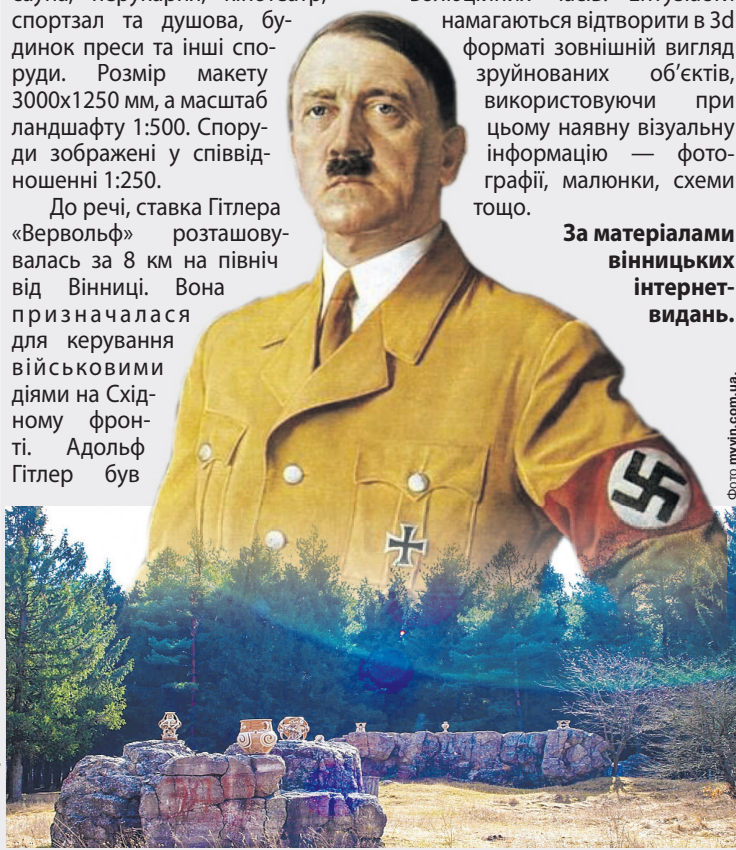
Існує версія, що саме у ставці «Вервольф» (з нім. — «озброєний вовк») фюрер став різко втрачати здоров'я через опромінення радоном з подільських гранітів.

За матеріалами вінницьких інтернет-видань.