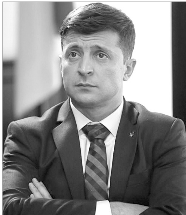
Обрати дату інавгурації — найменша з проблем, які чекають на нового президента і головнокомандувача.