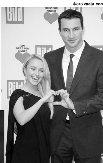
Від цієї любові залишилася тільки донька. У тата...

Допомагає у славному боксеру доглядати дитину його мама.