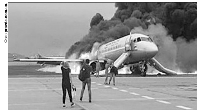
Не врятувались пасажирів, що перебували у хвостовій частині літака, яка повністю згоріла.