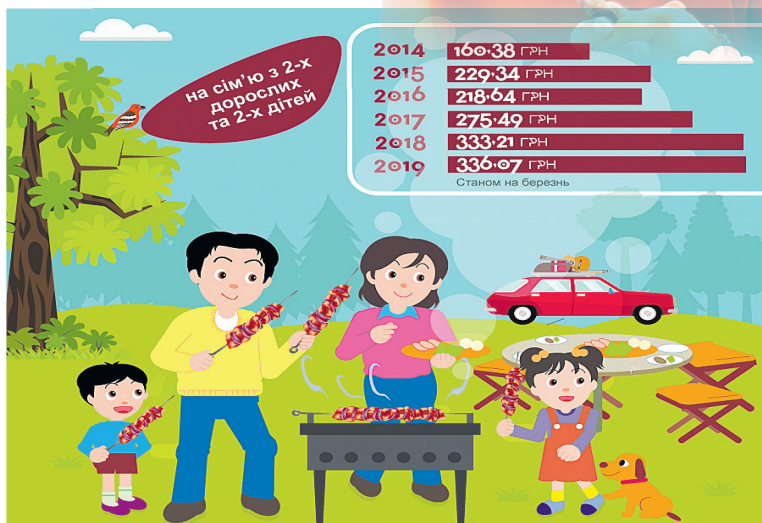
Порівняйте, як змінювався індекс шашлику протягом останніх 6 років.

У 2016 році загальна вартість шашликів для сім'ї знизилася за рахунок того, що ціни трохи впали, в тому числі й на м'ясо. Свинина (2 кг) була по 132 грн, цибуля — по 7 грн 69 коп., хліб — майже 10 грн, огірки — 34 грн 14 коп., помідори продавали по 39 грн 72 коп.