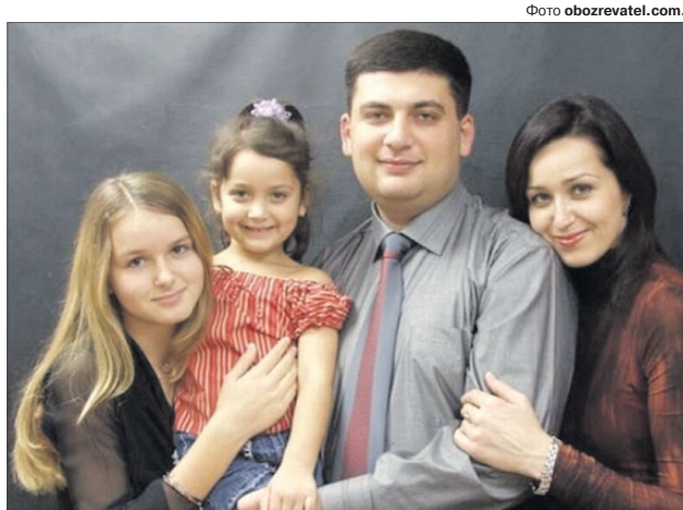
Не так давно Володимир Гройсман був у своїй сім'ї «важковаговиком».

можна споживати різні продукти, а решта 16 годин — «голодне вікно» (їсти не мож-