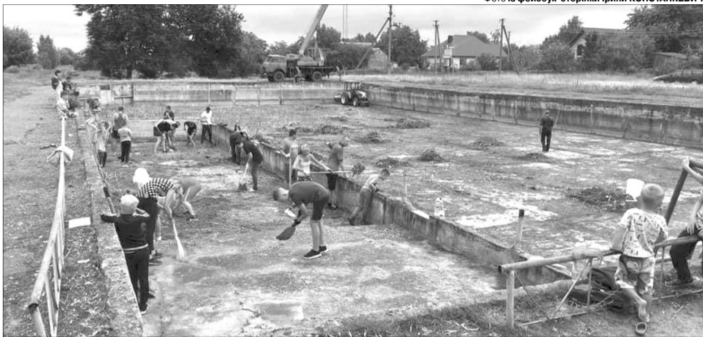
Толока зібралася, щоб прибрати територію історичного відкритого штучного водоймища.