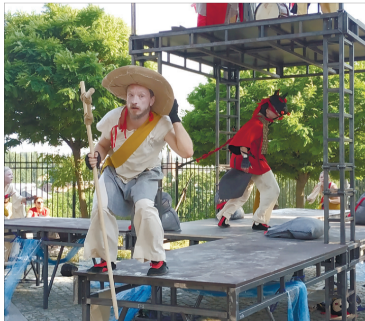
«Між річок — острів, на острові — пагорб, на пагорбі — печера, у печері — лютий змії-змії».

Почалося дійство з легенди про змія, який полював на людей і якого врешті вдалося подолати. Затим — давньоруські часи: набіги татар хана Куремси, пожежі