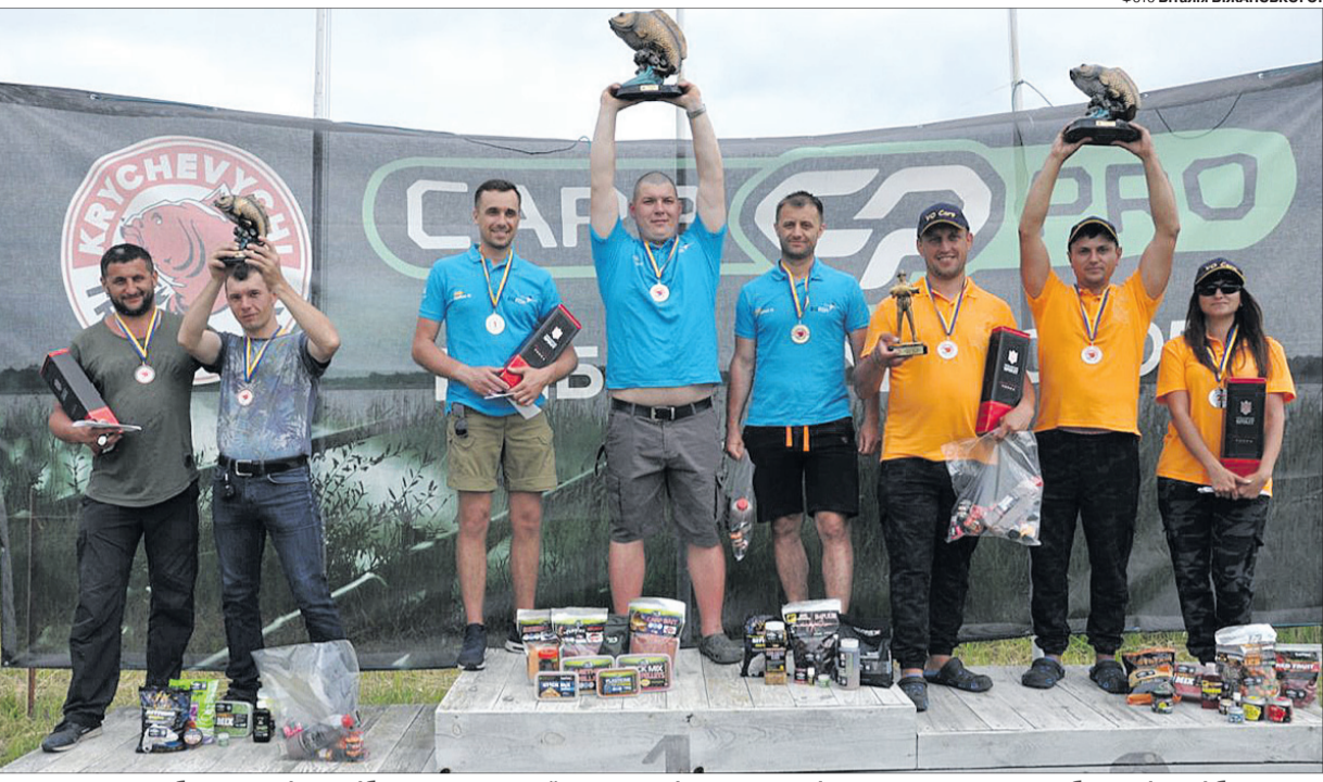
Хто не брав участі у подібних заходах, той не зрозуміє, яка це радість — повертатися з риболовлі хоч і без улову, але з неймовірними емоціями.