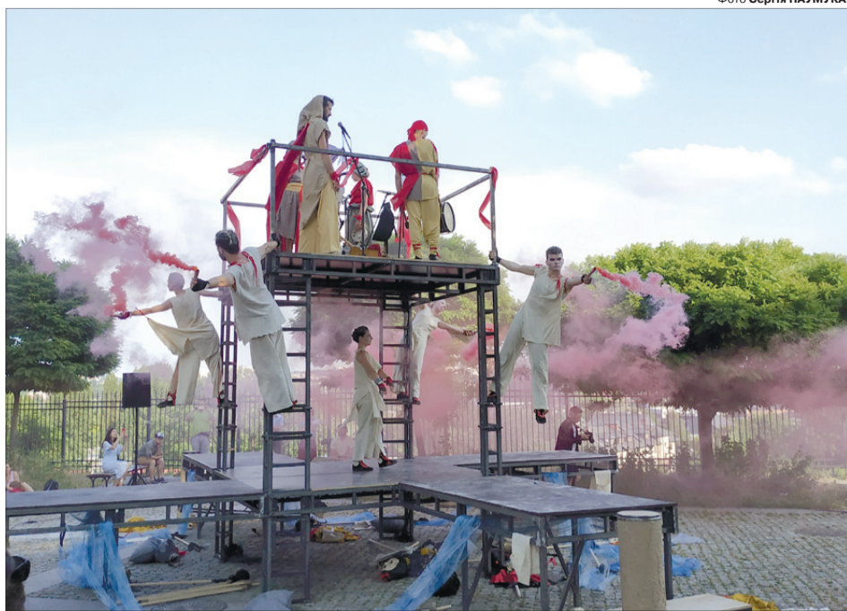
Після наказу Москви все навкруг стало червоним.