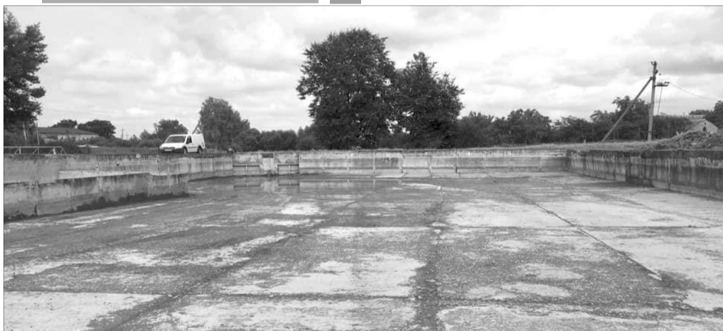
Скоро це місце може стати найпопулярнішим у польському райцентрі.

Вибори – це важливо. Але не головне. Адже є ще реальні проблеми й актуальні питання. Працюймо далі разом!». ■