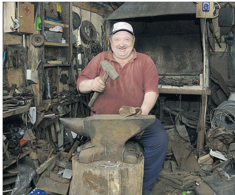
Довелося ще й ковалем стати.