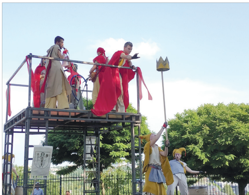
Корону Вітовт так і не дістав.