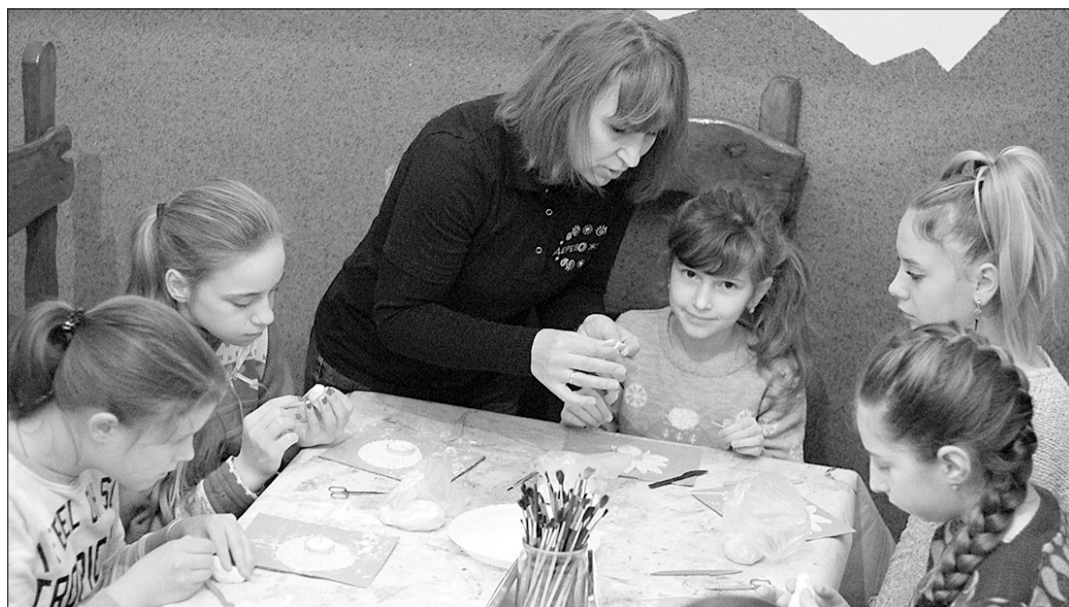
«Кожне заняття у нас — це неймовірна кількість позитивних емоцій».