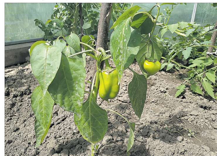
Ось такі перці зав'язалися.

Ще під час першого візиту до цієї родини ми переконалися, що приз від нашої газети та компанії «Западенські теплиці» потрапив до хазяйновитих людей. Подружжя не сидить, склавши руки. Це видно було ще від воріт: новий гараж та доглянутий квітник говорили самі за себе. Цього разу бачимо, що біля будинку є рштування. А ще Александр Дюма (старший) казав, що про добробут нічого не свідчить краще, ніж будівельний пил на черевиках.