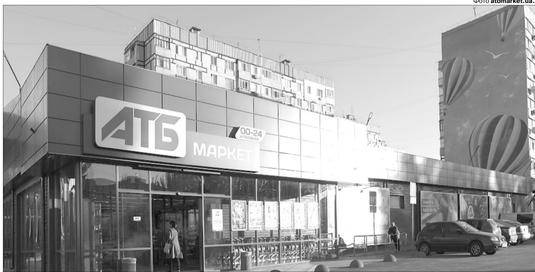
На полицях 1015 супермаркетів національної мережі «АТБ» завжди можна знайти якісні товари та свіжі продукти.