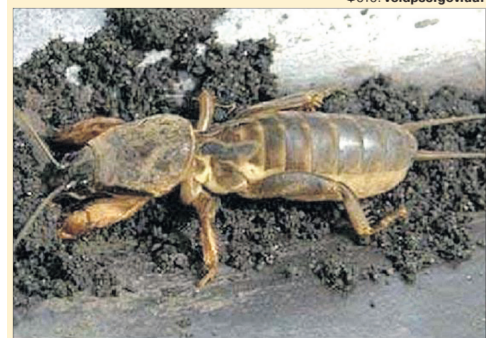
Ця комаха дуже полюбає низинні вологі місця та кислий ґрунт.