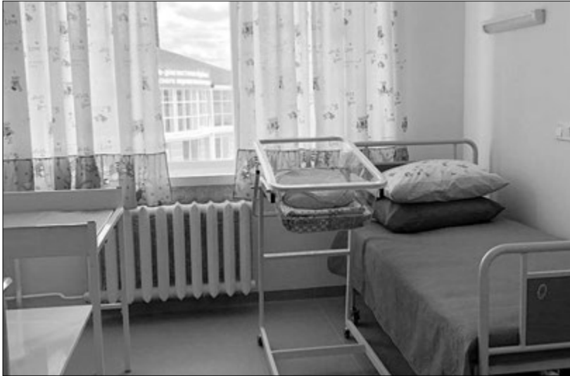
Палати максимально комфортні для маленьких пацієнтів та їхніх родин.