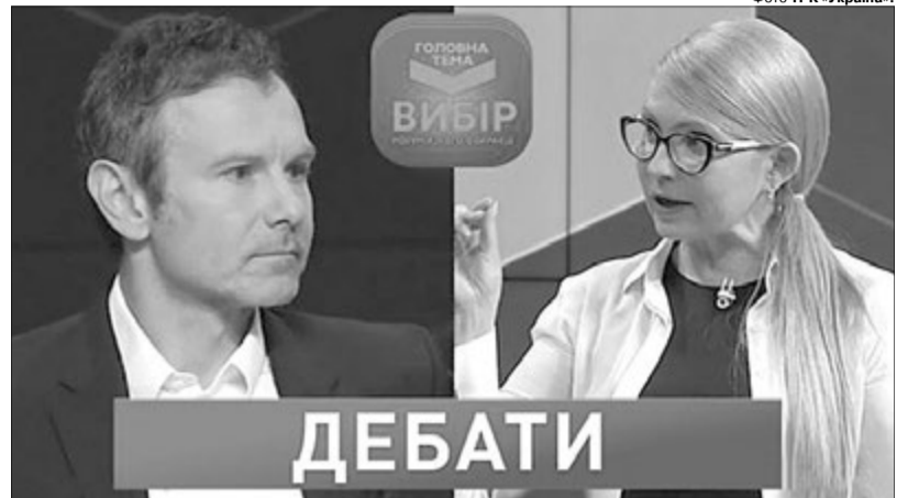
Під час «Дебатів» на каналі «Україна» Юлія Тимошенко не стала вигадувати ровера, а прямо запитала у Святослава Вакарчука: «Скільки зараз коштує газ для населення?» Той відповіді не знав...

Передвиборчий тур партії «Голос» супроводжується його ж безкоштовним концертом. Але, пробачте, чим це відрізняється від банальної роздачі «гречки», яку він так критикує? Не треба лукавства — це той же підкуп виборців. Яка різниця, підкоряти шлунки крупною чи полонити серця безкоштовними квитками? І хіба це нова якість політики, про яку Вакарчук безупинно гово-