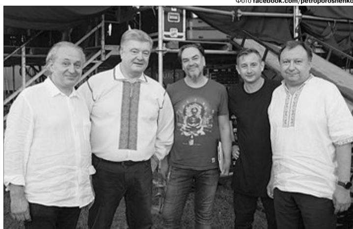
«Люди, які надихають!» — так Петро Порошенко охарактеризував зустріч із письменниками Іваном Малковичем (праворуч), Юрієм Андруховичем, Сергієм Жаданом і нардепом та телепродюсером Миколою Княжицьким на форумі Via Carpatia.

Документ підписали Дмитро Павличко, Юрій Щербак, Богдан Горинь, Іван Дзюба, Микола Жулинський, Павло Мовчан, Михайло Сидоржевський, Вадим Скуратівський, Олег Черно-