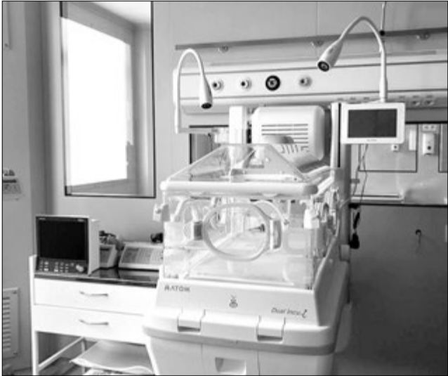
На обладнання перинатального центру з обласного бюджету цьогогоріч виділили 16 мільйонів гривень.