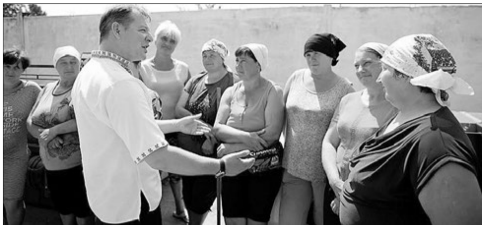
«Радикальна партія не дасть вбити українське село!» – запевнив волинян Олег Ляшко.