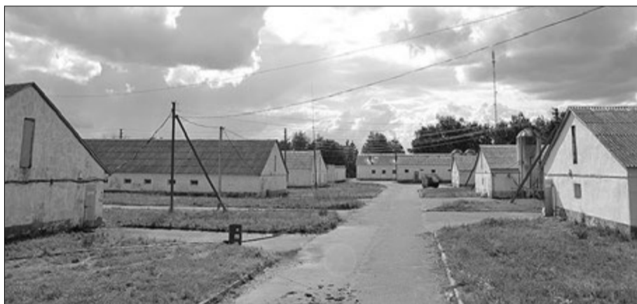
Сучасна свиноферма фірми «Віра-1» в селі Радошин.