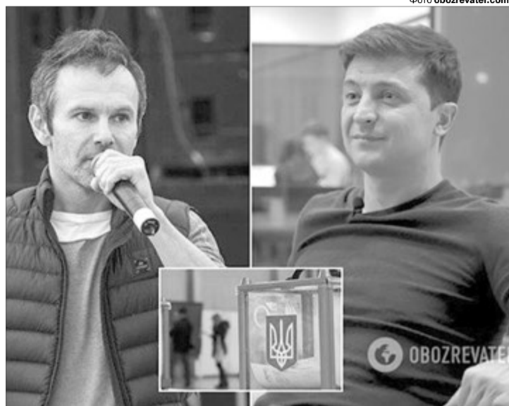
«Вакарчук за психотипом дуже схожий на Зеленського. Об'єднує їх і теперішня боротьба проти Порошенка. Ну, це по-нашому: всіх ворогів перемогли, чому ж не знищувати навіть ситуативно своїх?»

Але знаєте, що мене приголомшує в цій ситуації? Неспроможність чи небажання домовитися з представниками демократичного тавру і не конкурувати одне з одним на виборах. Я дивлюся списки мажоритарників на виборчих округах — за такого розпорощення голосів і ресурсів ЖОДЕН кандидат від демократичних партій НЕ ПРОЙДЕ. Тут, в Одесі, знову переможуть