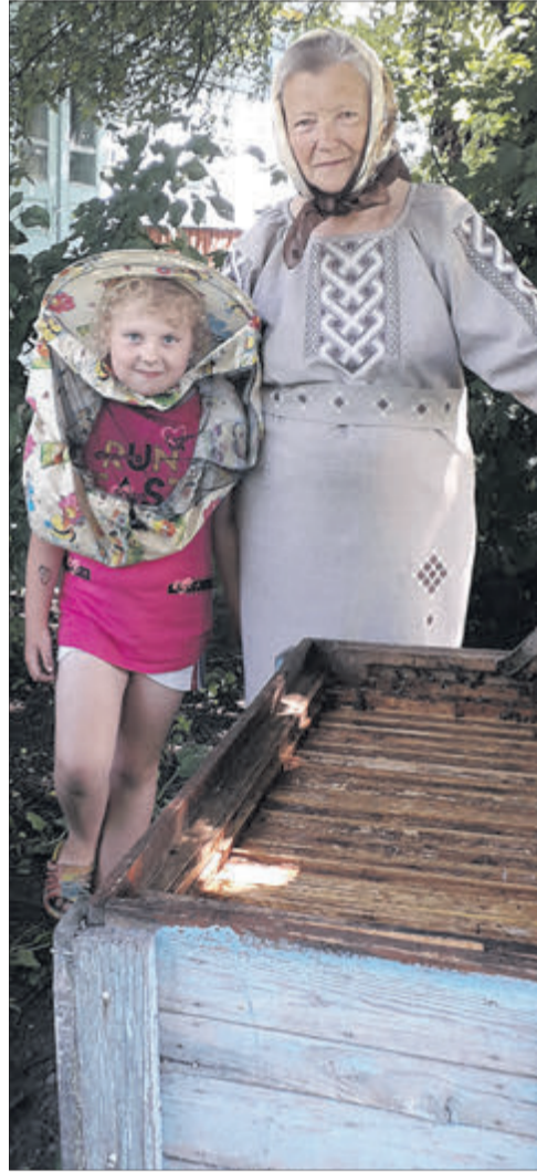
Внучка Іринка разом із бабусяю перевіряє вулики.

Можна сказати, що я виросла на пасіці. Як була маленька, така як тепер моя внучка, то носила рамки, коли качали мед.