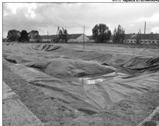
Таке гноєсховище унеможливує витікання чи появу неприємного запаху.