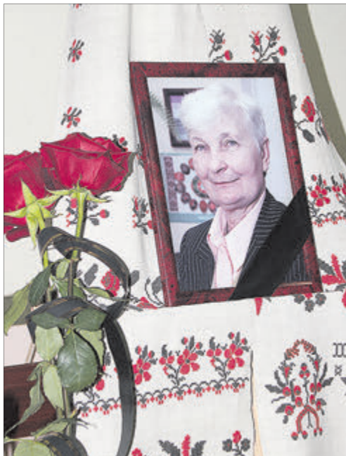
Людина живе доти, доки її пам'ятають.