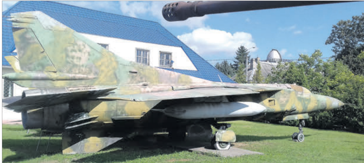
Точно такий же МіГ-23 є у Волинському регіональному музеї українського війська та військової техніки.