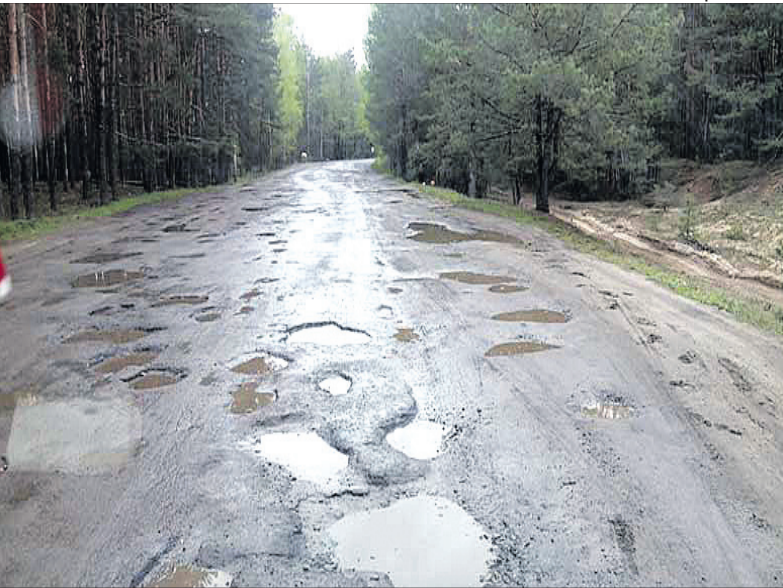
І це ще не найгірша ділянка...