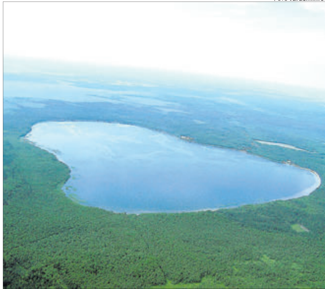
Біле озеро — одне з небагатьох в Україні з підвищеним вмістом гліцерину у воді, тому вона має надзвичайні цілющі властивості.