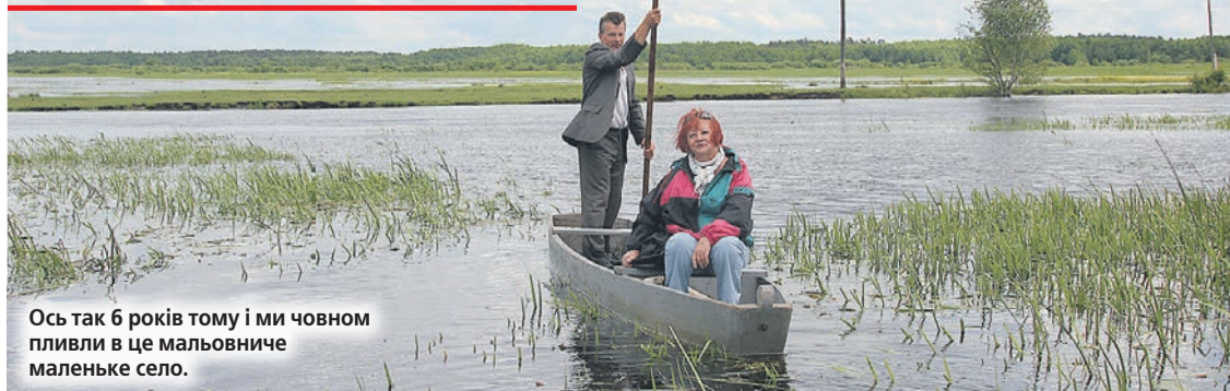
Ось так 6 років тому і ми човном пливли в це мальовниче маленьке село.