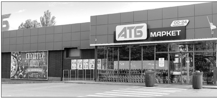
«Купівельні запити змінюються дуже динамічно, і наше основне завдання — завжди бути на пів кроку попереду».

Перша половина 2019-го вже минула, ставши історією. Надважлива для української фінансової стабільності та незалежності торговельна галузь протягом цих місяців зазнала помітних змін, причому позитивних