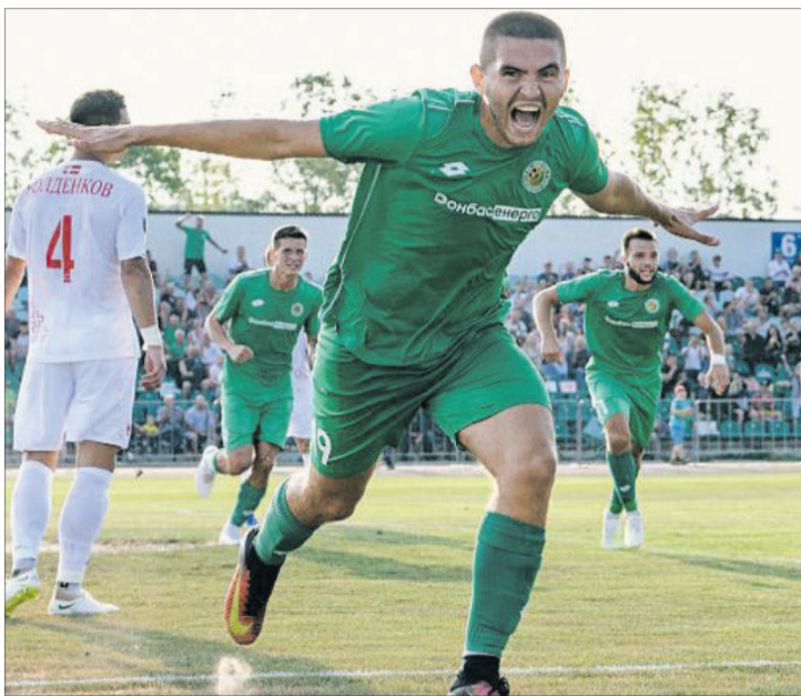
На жаль, цього разу свято було не на нашій вулиці...

Вкрай неприємний старт для команди, яка знову анонсує на сезон плани виходу в Українську Прем'єр-лігу. Проте й надто побиватися не будемо. Віритимемо, що тренерський штаб зробить правильні висновки, і надалі гравці «Волині» тишитимуть нас пере-