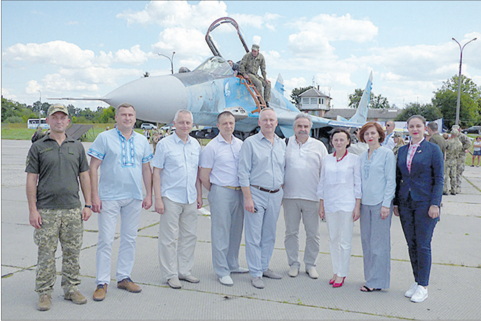
Військові та працівники «Мотору» планують реалізувати ще не один спільний проєкт.