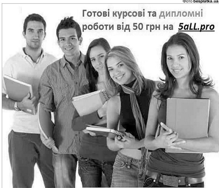
Готові курсові та дипломні роботи від 50 грн на 5all.pro

Ті, хто навчався у вишах раніше, будуть здивовані, почувши, що зараз писати самому дипломну роботу... не прийнято. У студентському середовищі це вважається відсталістю. Однокурсники на подібного товариша