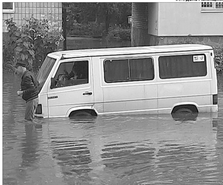
3 водняної пастки рятувальники витягнули 43 автомобілі.

У Рівному на багатьох вулицях відкачували воду з підвальних приміщень 54 житлових будинків і 17 адміністративно-громадських будівель. Від служби ДСНС для ліквідації наслідків негоди було задіяно 21 одиницю техніки, 52 бійці особового складу.