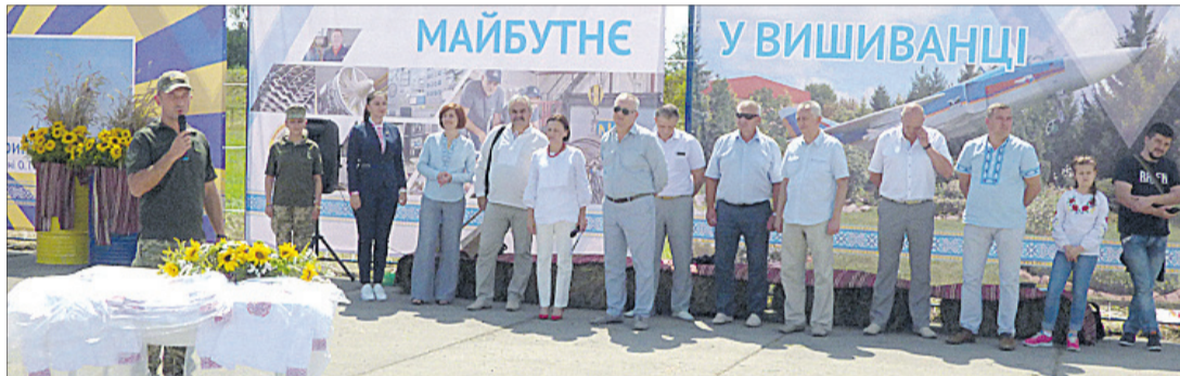
Вони працюють, щоб українські діти були у безпеці.

Бойові винищувачі та іграшкові літаки, військова форма й вишиванки, армійська дисципліна та дитячі пустощі... Таким яскравим і контрастним видалося родинне свято, яке влаштували для 204-ї Севастопольської бригади працівники Луцького ремонтного заводу «Мотор» і підприємства «Едельвіка»