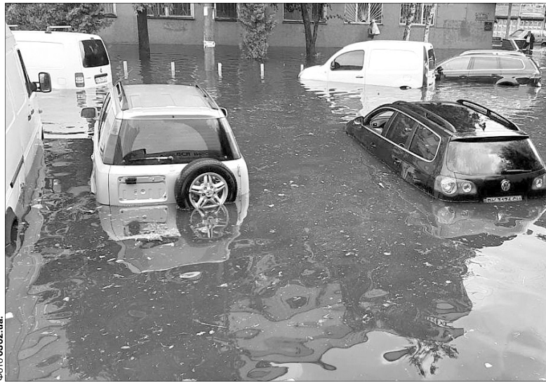
«А винен хто у підтопленні авто?» — «Їхні власники опинились не в тому місці і не в той час...»

Кожна людина має право звернутися до суду. Але це стихія, це лихо. Як тільки почалась злива, водоканал отримав команду увімкнути всі насоси, проте дуже велика кількість води за такий короткий час випала, що навіть гіпотетично владнати проблему місто не могло. І в Україні, і за кордоном, коли вирує стихія, мережі не справляються, бо технічно на форс-мажорні обставини не розраховані. Будують мережі за середніми нормативами, з урахуванням пікових навантажень, але не стихій. Ви ж не купу-