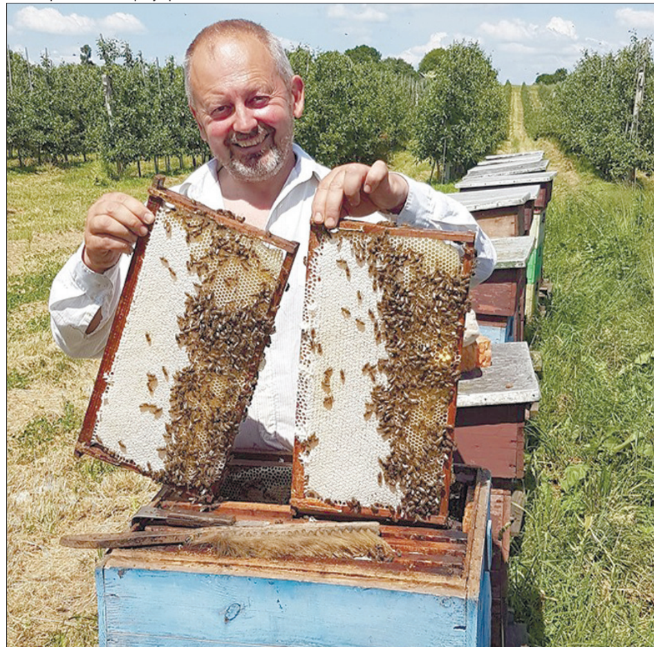
Щасливі моменти спілкування з божими комахами.