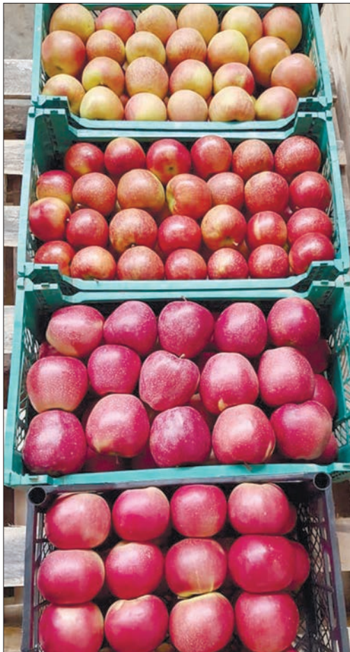
Такі яблука охоче купували б і за кордоном.