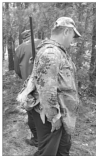
А йшли чоловіки, мабуть же, полювати на качок.