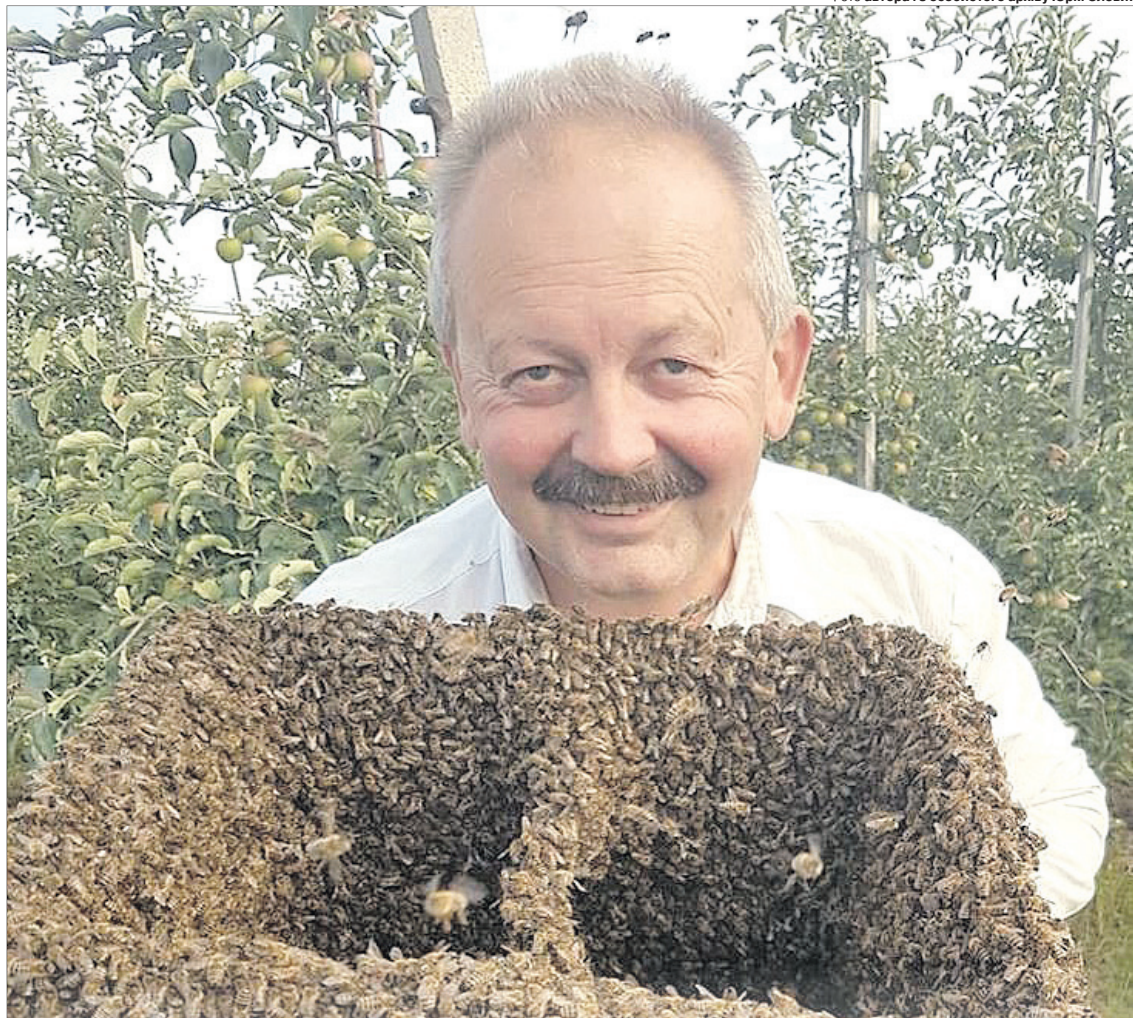
Юрій Володимирович — майстер і рій упіймати!