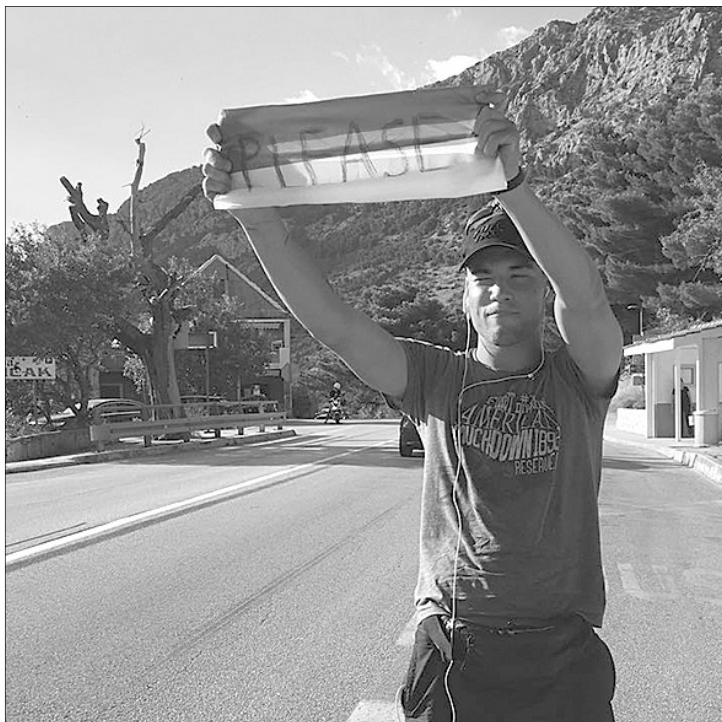
Деколи, вважають мандрівники, автомобілісти зупиняються, побачивши український прапор.