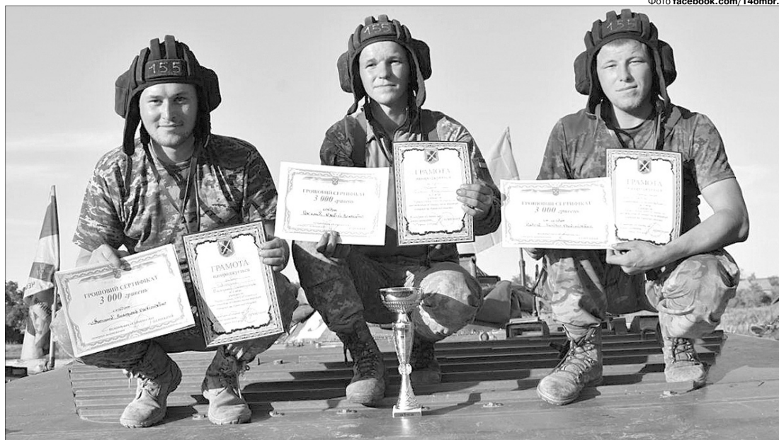
...і кожному – сертифікат на 3000 гривень призових.