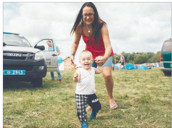
Фото зі сторінки «Бандерштат-2019» у фейсбуці.

Найменшому бандерштатівцю, якого довелося побачити, напевне, трішки більше двох місяців, багато зустрічалося і літніх людей. Усіх їх цей захід притягує до Луцька. І ще приємно дивує, що багатотисячна публіка не залишає за собою сміття. Це ж фестиваль українського духу, а його потрібно виховувати змалку. «Певно, «Бандерштат» є єдиною можливістю для нас стати частиною української історії», — сказав якимось