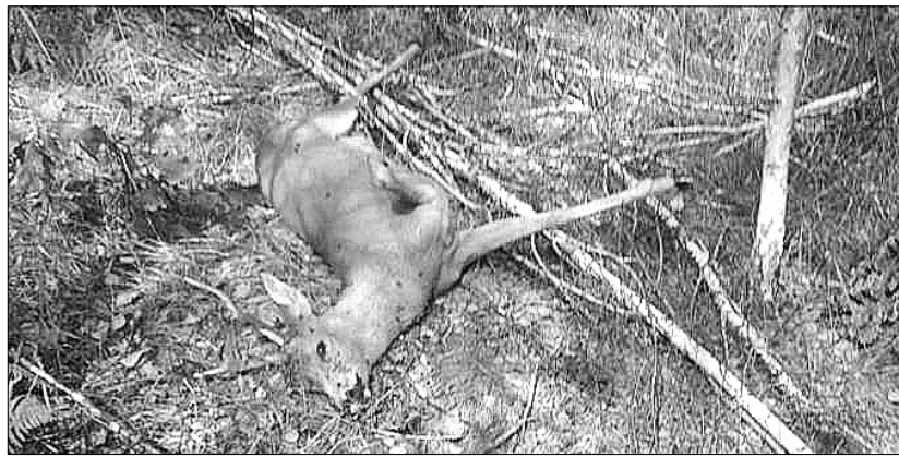
І рука не здригнулася в горе-мисливця, коли цілився в цього лісового мешканця.

Працівники групи оперативного реагування спільно з егерською службою ДП «Любешівське ЛМГ» упіймали браконьєрів, які встигли застрелити самця. Сталося це в неділю вранці на території Камінь-Каширського УТМР