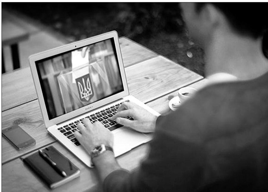
Проголосувати, не виходячи з дому, — чудова ідея. Але чи не вкрадуть хакери ваш голос?

— Складно навіть уявити таке голосування, бо натискання на кнопку хто перевірить? Принаймні зараз хоч дивляться у паспорт виборця. Я знаю, як живе село, який там рівень освіти, медицини і які пенсії. Не у всіх людей навіть телефони є, то про який онлайн можна говорити? Я поважала би владу, яка поважає свій народ. Але