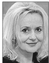
Ірина ФАРІОН, доктор філологічних наук, мовознавець, член політради ВО «Свобода», народний депутат України VII скликання (м. Львів):

— Вважаю, що ми ще не готові до таких нововведень. Можливо, колись така форма голосування і буде доцільною, але зараз вона не на часі. Це потрібно впроваджувати поступово, адже не всі мають гаджети, не скрізь є доступ до інтернету. Для мене це складно, мені значно простіше у бюлетені поставити відмітку. Я все життя так голосував — перелаштуватися важко.