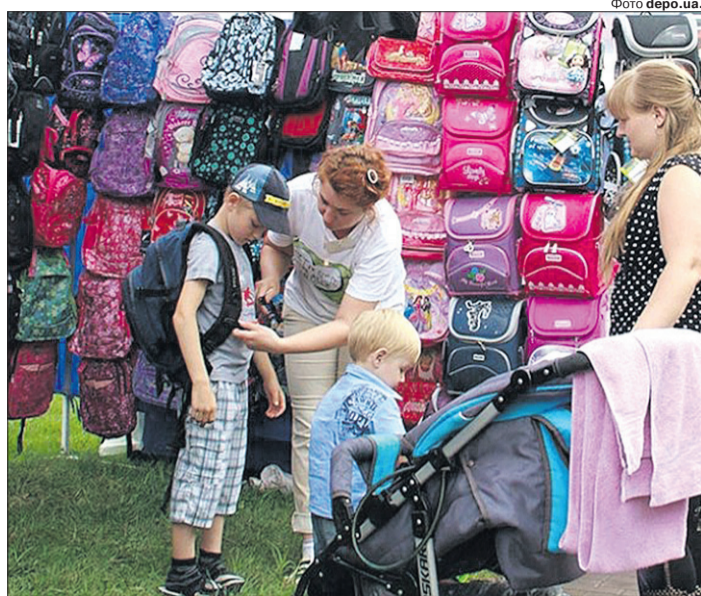
Багато батьків на власному досвіді переконалися: на рюкзаку економити не варто.