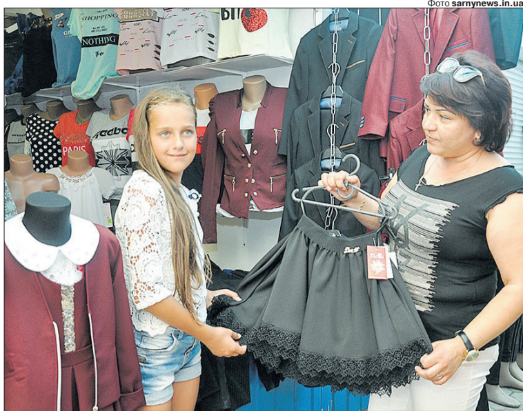
Що було б простішим: купити без проблем звичну форму чи тепер бігати і підбирати щось більш-менш строге та ще й відповідного кольору?