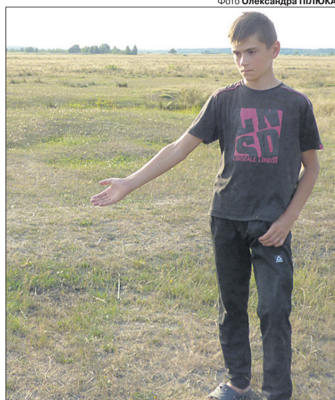
Роман показує те місце, де їх із батьком настигла стихія.