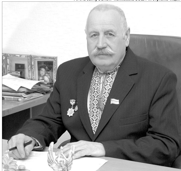
Із Віталієм Дмитровичем говорити можна про все на світі: усе йому цікаво, усе його хвилює.