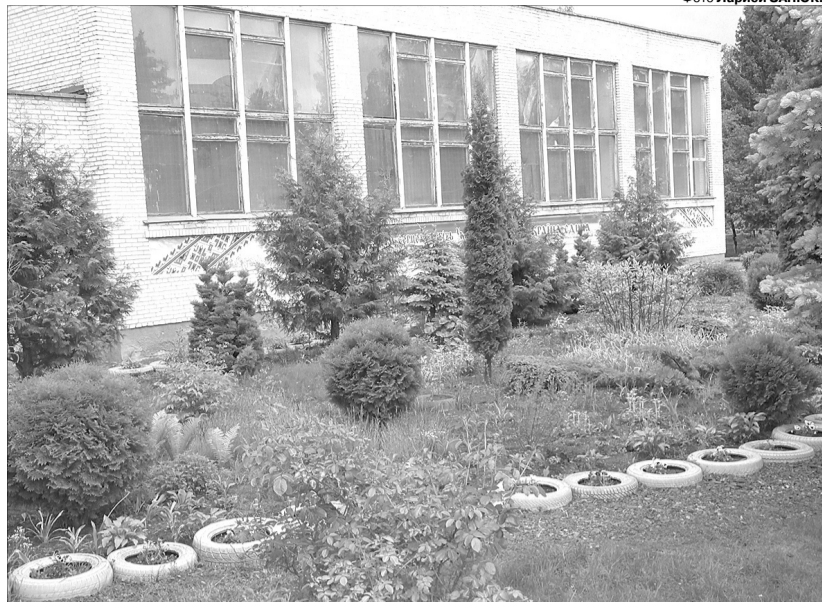
Шкільний дендропарк на честь Героїв Небесної сотні «виріс» спочатку в серці директора.