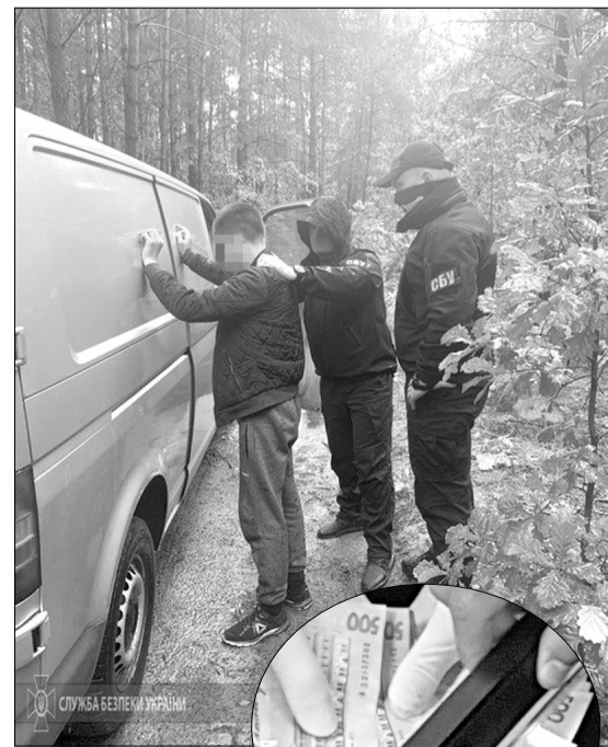
Цього разу «заробити» не вдалося.

Заходи з викриття злочинних дій прикордонника проводилися спільно з територіальним управлінням ДБР у Львові за процесуальним керівництвом військової прокуратури. ■