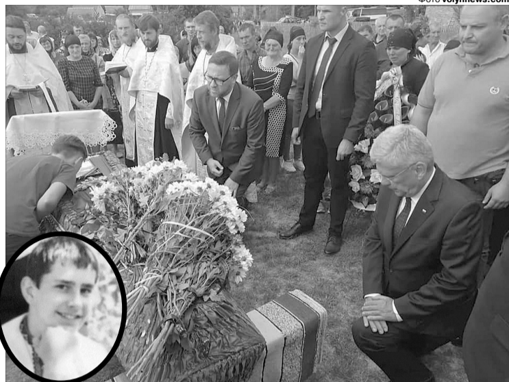
Станіслав Карчевський знайшов час, щоб особисто віддати шану бійцю-волинянину.

До речі, того дня у Костюнівці на Маневиччині відзначали 21-шу річницю Харцерської служби пам'яті на Сході. З цієї нагоди і перебував на Волині Станіслав Карчевський, який взяв участь в освяченні дерев'яної каплиці на честь польських легіонерів, торік реконструйованої за віднайденими фото оригінальної каплиці міжвоєнного часу.