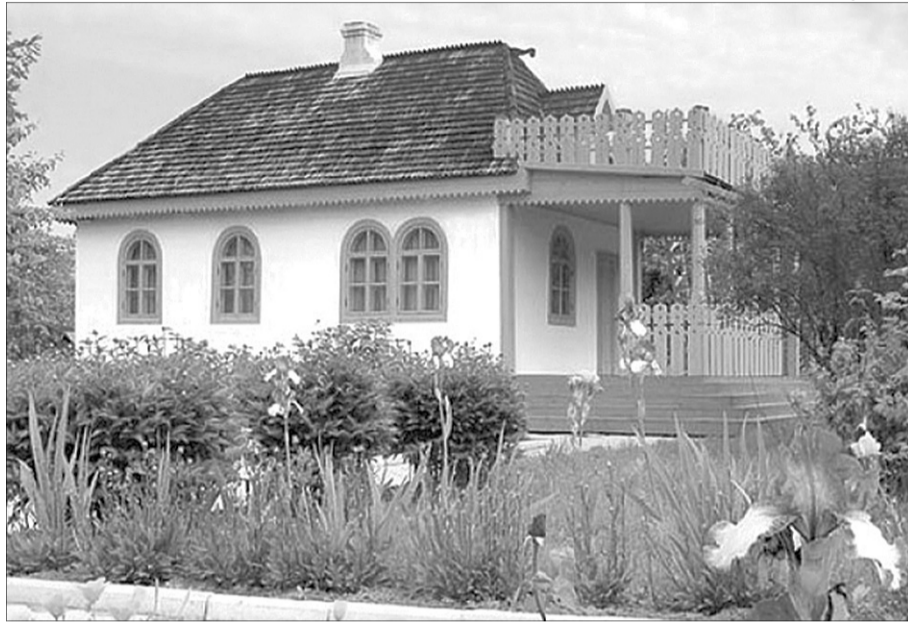
За кілька метрів від Лесиноного білого будиночка – туалет, до якого бояться ходити і діти, і дорослі.

Чим переймалася і з чого дивувалася останнім часом редактор відділу соціального захисту Євгенія СОМОВА