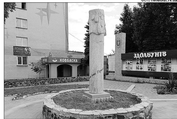
Містяни обурені: між задумом (на фото ліворуч) і його реалізацією — велика різниця.